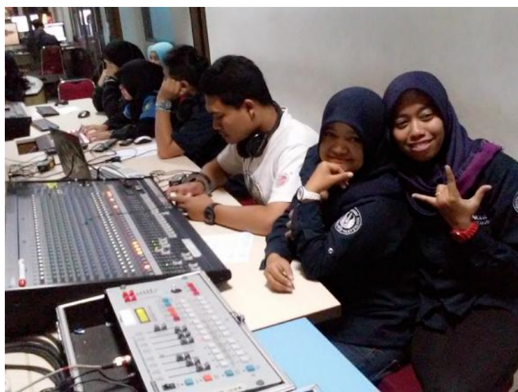
Foto Suasana ruang MCR