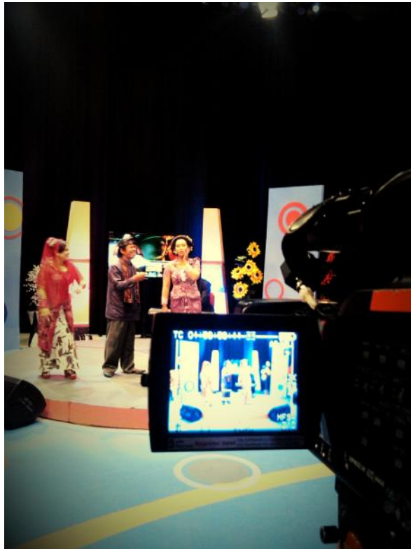
Foto saat Live Tembang-Tembung