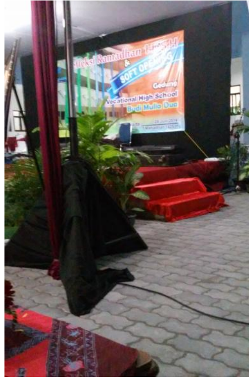
Foto Saat meliput peresmian gedung Vocational High School Budi Mulia