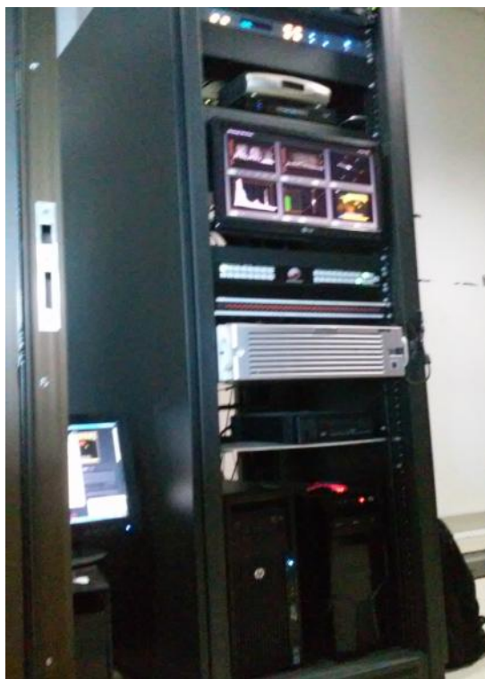
Foto Tombol on/off computer dan Tombol recording