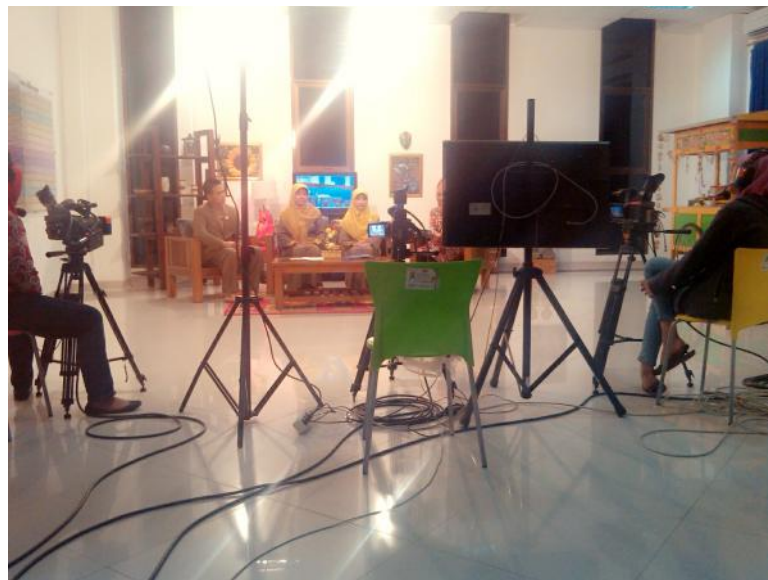
Foto saat Dialog Khusus bersama PT Arminareka Perdana