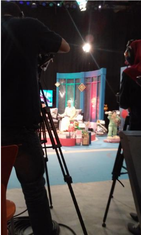
Foto saat menjadi Camera Person Ramadhanku Di Jogja