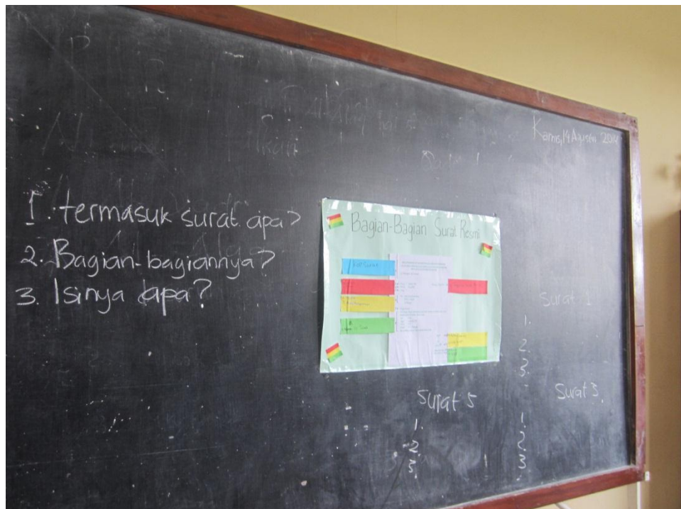
Media pembelajaran bagian-bagian surat yang digunakan dalam pembelajaran di kelas VI