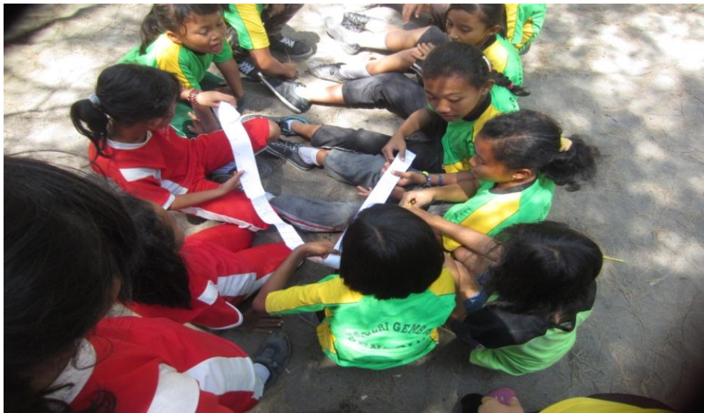
Siswa menuliskan cita-citanya di ekor layang-layang