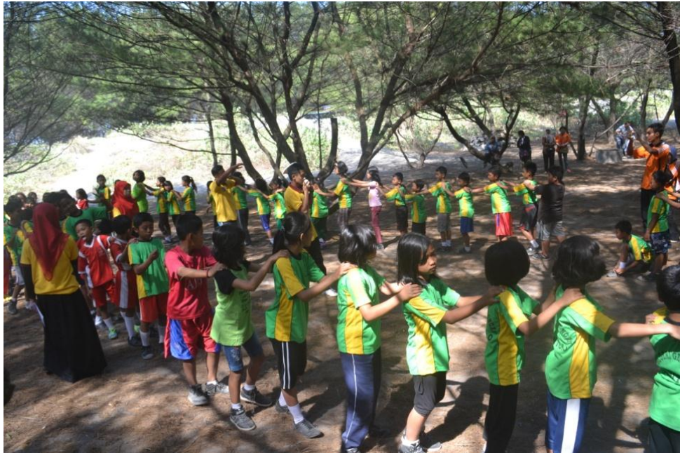
Kegiatan pemanasan sebelum siswa mengikuti outbond