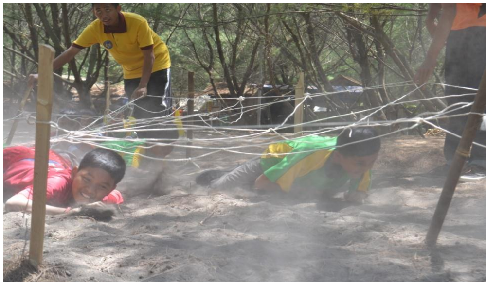
Siswa mengikuti lomba merayap melewati jaring-jaring tali