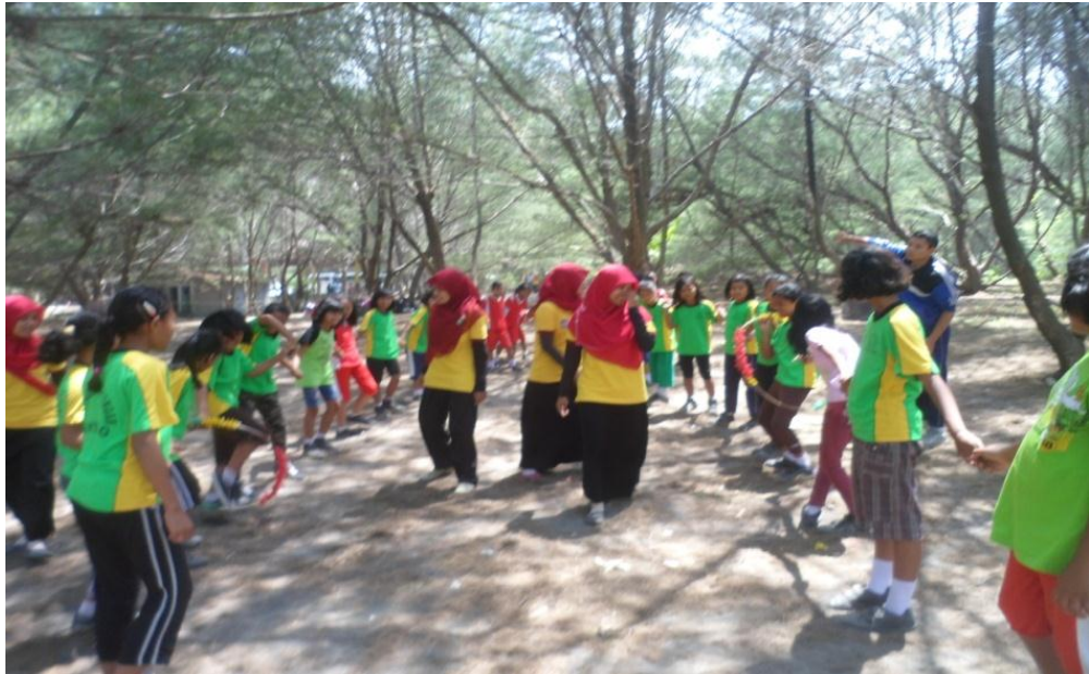
Siswa mengikuti permainan holahop