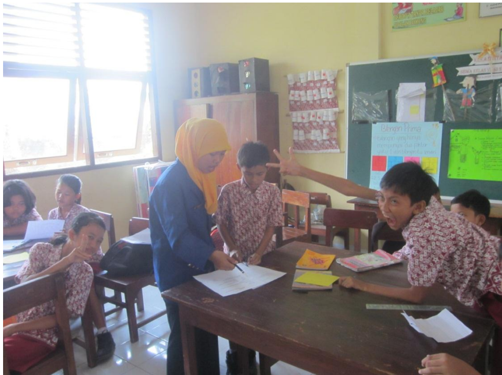
Membimbing siswa kelas VI dalam melakukan diskusi