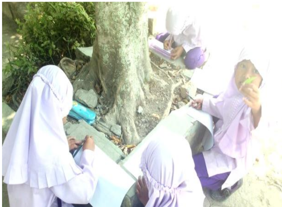
Pembelajaran tematik kelas II di luar kelas