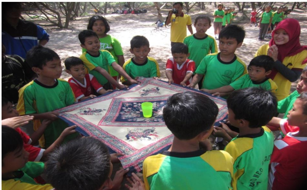
Siswa mengikuti lomba angkat gelas di atas taplak