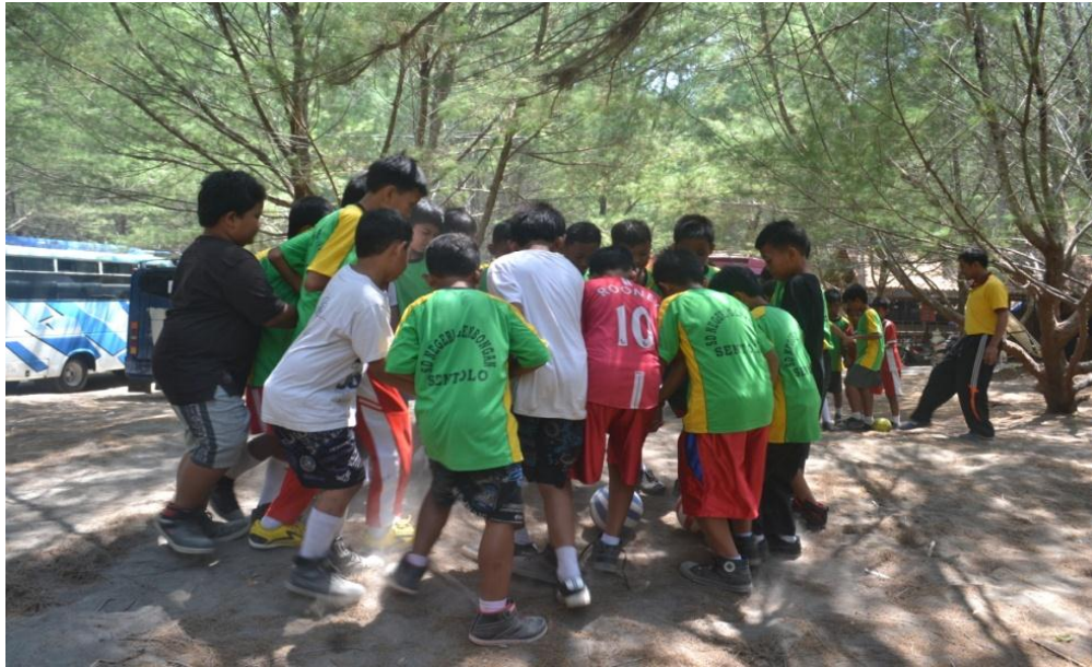
Siswa mengikuti lomba giring bola bersama