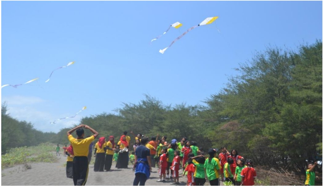
Semua peserta outbond dan panitia menerbangkan layang-layang yang berisi cita-cita mereka