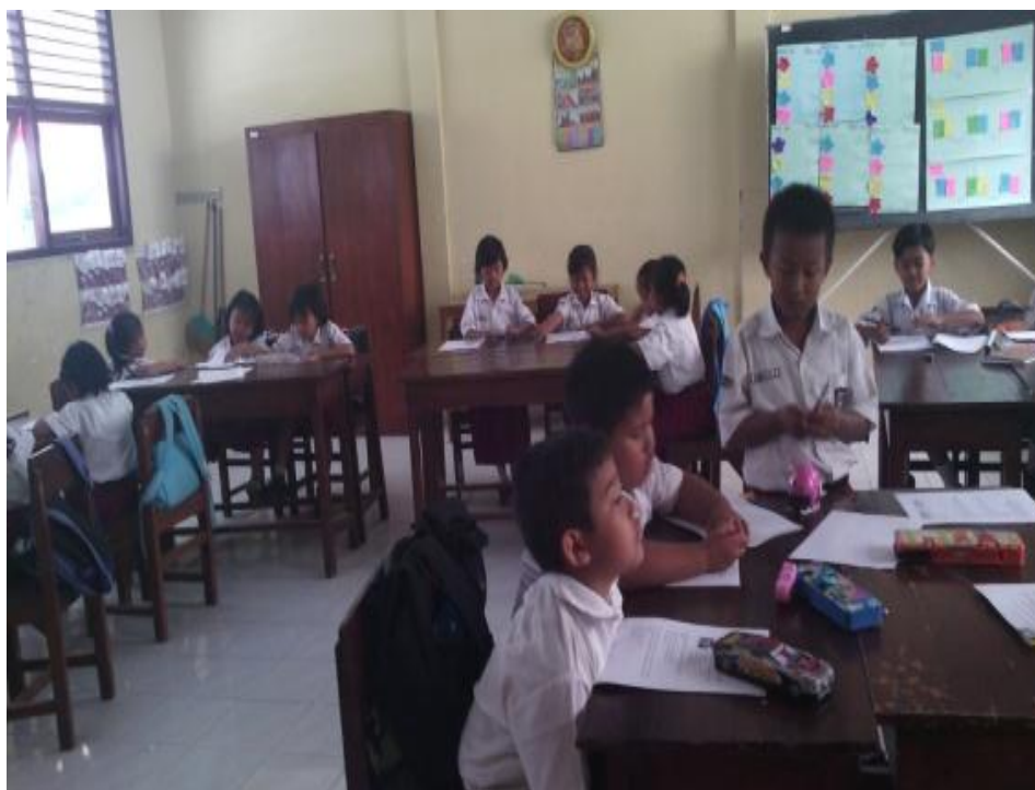
Siswa kelas II dalam pelaksanaan PPL