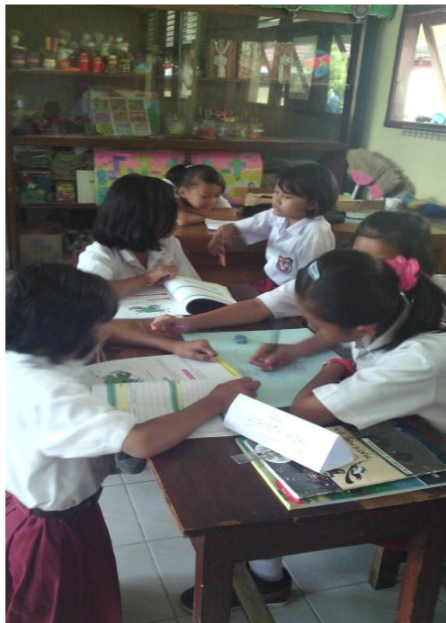
Siswa kelas V sedang diskusi kelompok