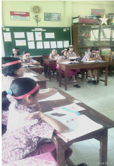
Siswa kelas V mengikuti pembelajaran PPL