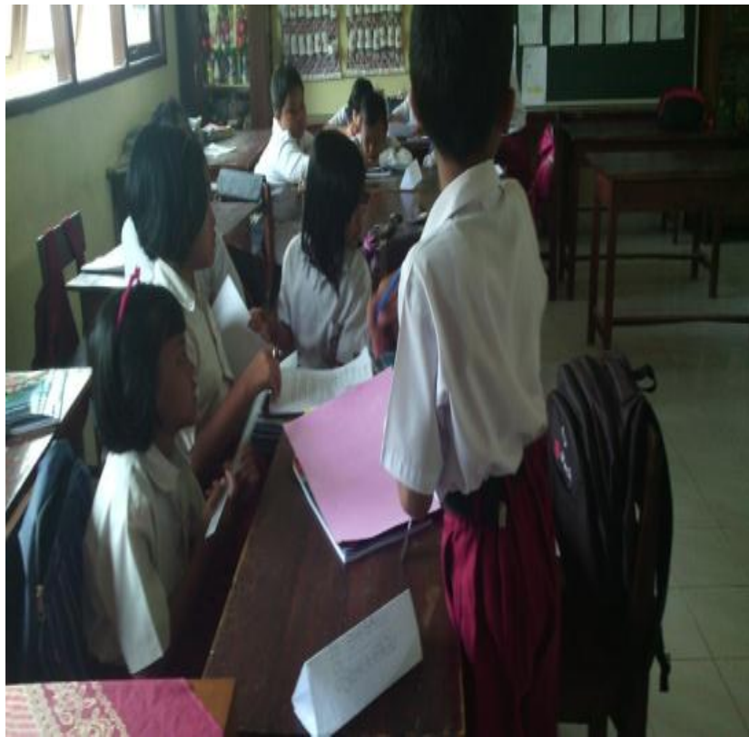
Siswa kelas V sedang berdiskusi