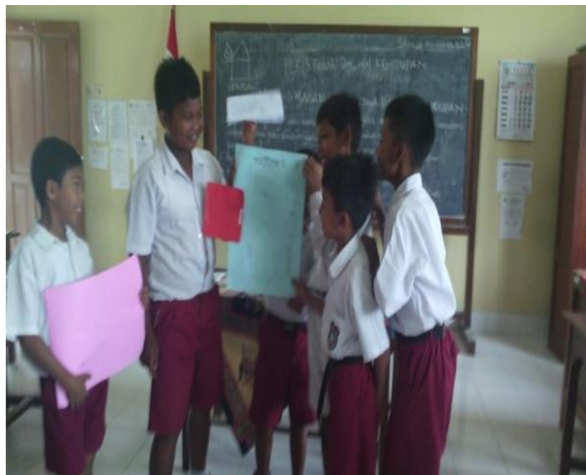
Siswa melakukan presentasi berkelompok