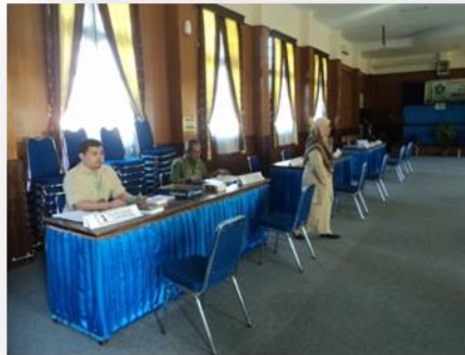
Gambar 3 Auditorium

Ruangan ini biasanya digunakan untuk acara sekolah seperti penerimaan tamu sekolah, MOS, MOM, wisuda dan pelepasan peserta didik serta acara lain yang membutuhkan ruang pertemuan di dalam ruangan ( indoor ) yang cukup luas. Ruang ini dilengkapi dengan AC, LCD dan sound system.