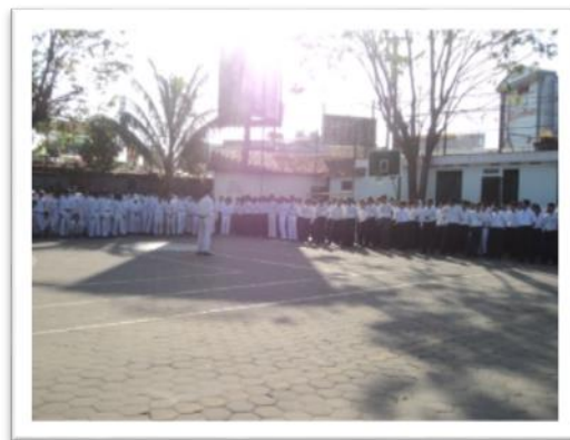
Gambar 5 Lapangan upacara

Lapangan basket adalah fungsi lain dari lapangan sepak bola. Sehingga di lapangan sepak bola juga terdapat ring basket, untuk para peserta didik bermain basket.