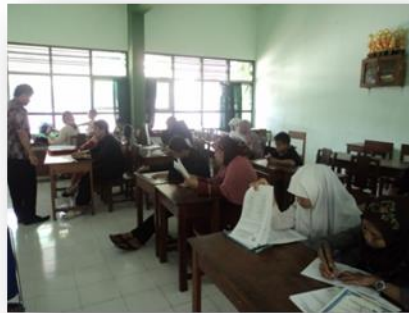
Gambar 2 Suasana ruang kelas

Gedung sekolah terdiri dari 23 ruang kelas, yang terdiri dari : 8 ruang untuk kelas X (X.MIA 1-3, X IIS 1-3, X IIK, X IBB), 3 ruang untuk kelas XI IPA, 3 ruang untuk kelas XI IPS, 1 ruang untuk kelas XI Bahasa, 1 ruang untuk kelas XI Agama, 3 ruang untuk kelas XII IPA, 3 ruang untuk kelas XII IPS, 1 ruang untuk kelas XII Bahasa, dan 1 ruang untuk kelas XII Agama. Masing-masing kelas dilengkapi dengan kipas angin, center audio room, beberapa juga sudah dipasang AC serta LCD.