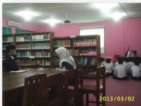
Gambar 4 Perpustakaan