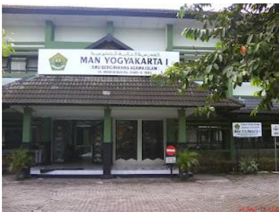
Gambar 1 Halaman Depan Madrasah

Salah satu dari Tri Dharma Perguruan Tinggi adalah pengabdian kepada masyarakat. Kuliah Kerja Nyata (KKN) sebagai salah satu mata kuliah kulikuler yang menitik beratkan pada kerja di masyarakat. Kuliah ini berupa kerja yang dilakukan di masyarakat, baik masyarakat sekolah, masyarakat instansi/lembaga atau masyarakat umum. PPL di UNY sendiri mempunyai tiga kelompok sasaran yaitu masyarakat, sekolah, dan industri. Dalam hal ini kami mengkhususkan sasaran pada masyarakat sekolah. Bagi mahasiswa, PPL berfungsi sebagai agen of change yaitu mahasiswa menjadi inovator, motivator, dan pemecah masalah. Sementara bagi sekolah, PPL berfungsi sebagai wahana untuk memperoleh bantuan pemikiran dan tenaga serta IPTEK dalam merencanakan dan melaksanakan program pengembangan sekolah. Kegiatan PPL yang dilaksanakan penyusun dilakukan pada masyarakat sekolah MAN Yogyakarta 1. Kegiatan pertama yang penyusun lakukan adalah observasi tempat pelaksanaan PPL. Setelah penyusun melakukan observasi dan diskusi dengan pihak madrasah maka diperoleh gambaran mengenai situasi madrasah itu. Gambaran ini memberikan informasi bagi penyusun dalam perumusan program kerja.