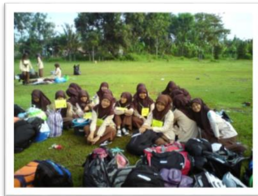
Gambar 6. Salah satu agenda ekstrakurikuler Pramuka

Dengan adanya kegiatan ekstrakurikuler memungkinkan siswa untuk mengembangkan bakat dan minatnya, sehingga hoby dan potensi yang dimiliki oleh para siswa dapat tersalurkan secara optimal. Selain fasilitas seperti di atas, MAN Yogyakarta 1 juga mempunyai prestasi yang baik.