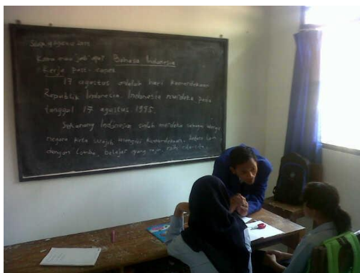
Menjelaskan pada anak mengenai hari kemerdekaan Republik Indonesia