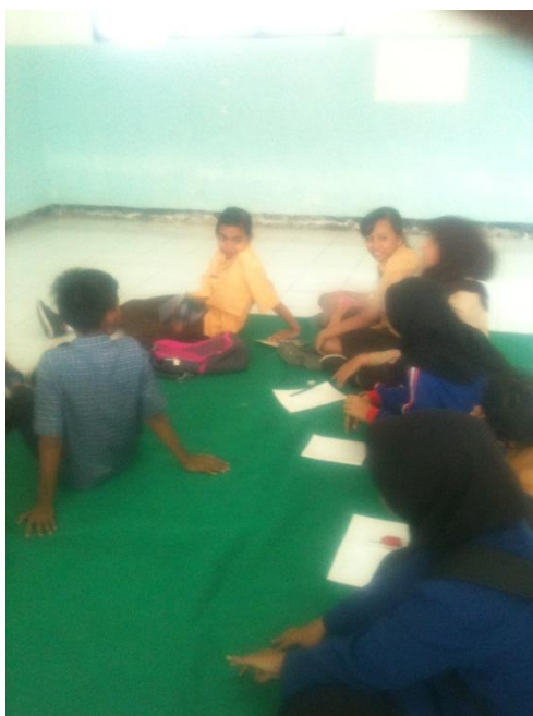
Pembelajaran olahraga gabungan bersama dengan kelas 5