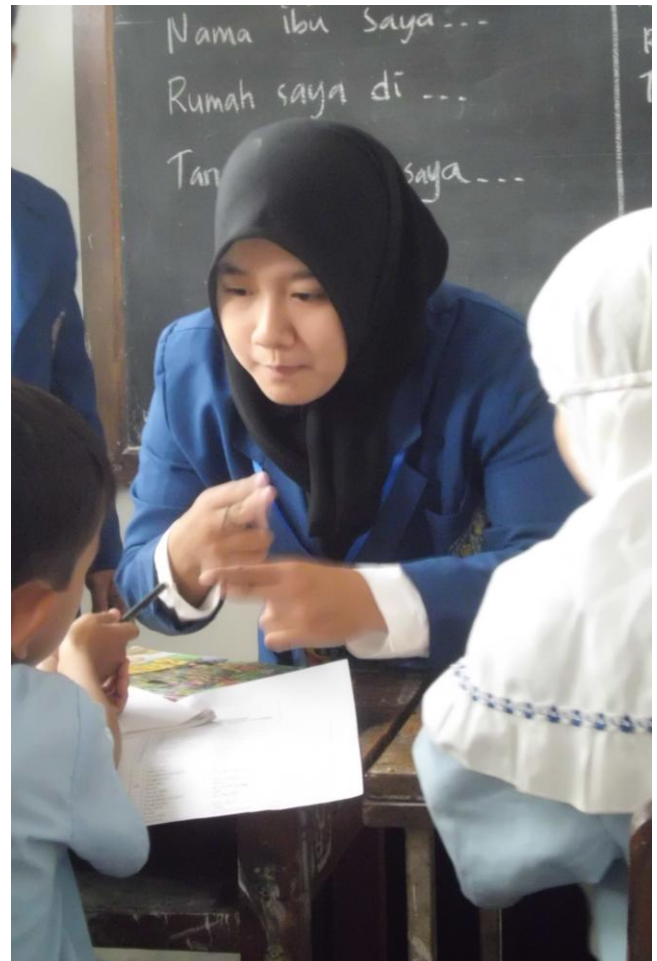
Mahasiswa menjelaskan materi biodata kepada anak.