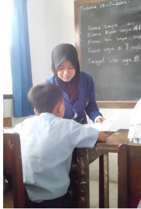
Mahasiswa memberikan lembar soal (portofolio).