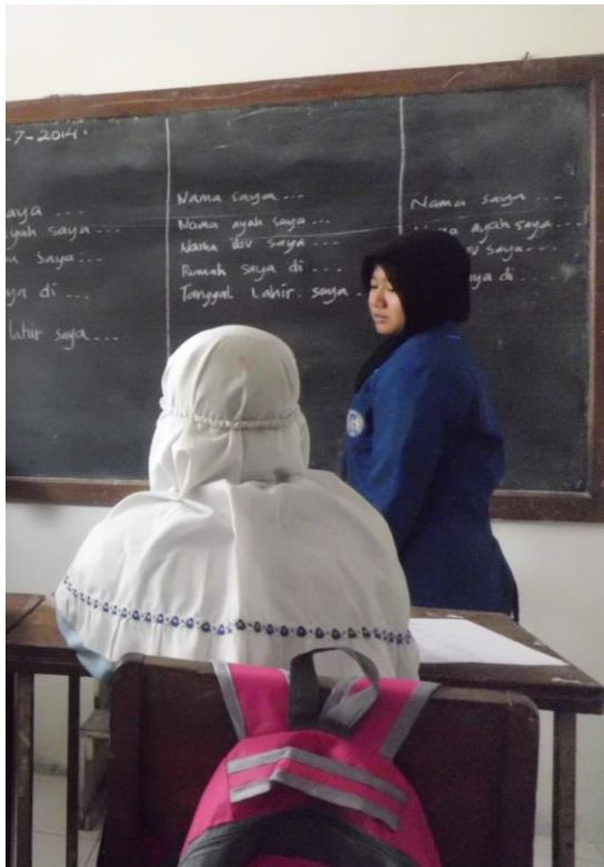
Mahasiswa selesai menjelaskan materi tentang biodata.