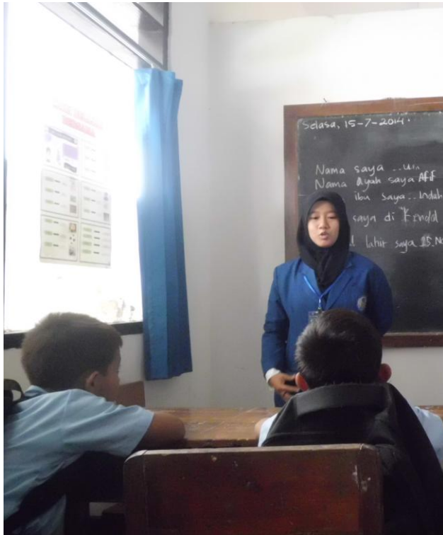
Mahasiswa mengajak anak-anak kelas dasar 2 untuk berdoa bersama