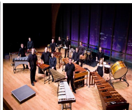
(Ansambel perkusi, campuran)