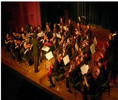
(Ansambel gesek ,sejenis)