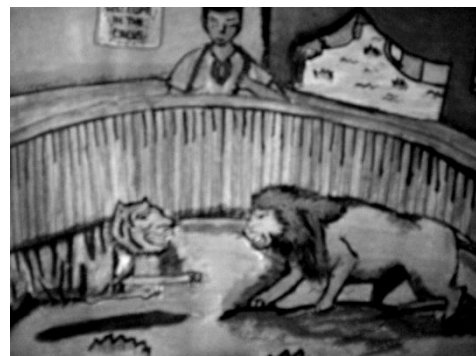
Harimau dan singa