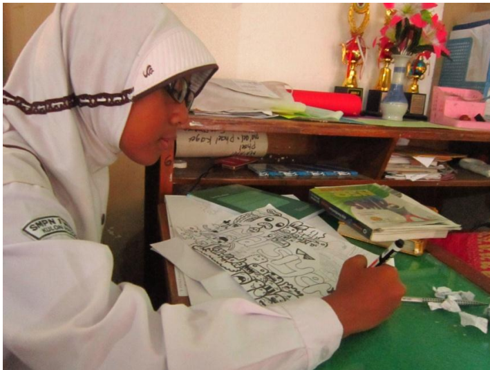
Menjelaskan yang tidak diketahui siswa