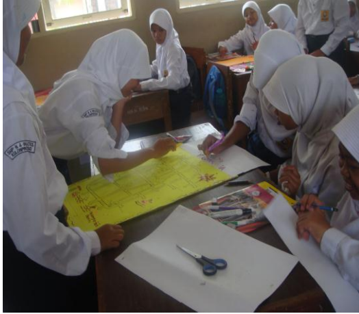
a. Pembuatan peta kelas VII C