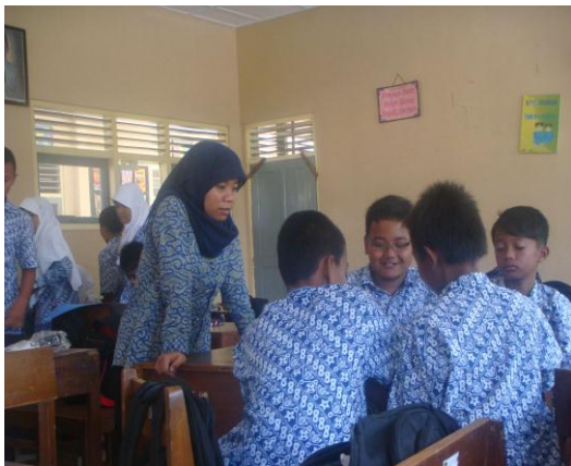
b. Diskusi kelompok kelas VII B