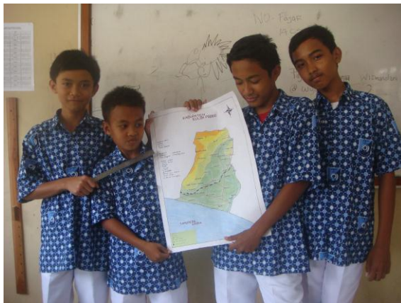
e. Presentasi Peta di kelas VII A