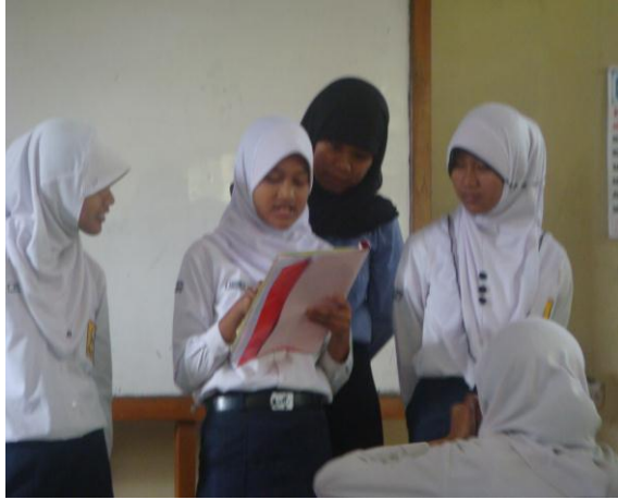
d. Presentasi Kliping kelas IX A