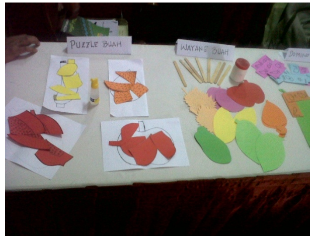
Praktek pembuatan sentra