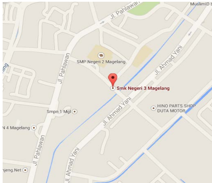
Gambar 1. Peta Lokasi SMK N 3 Magelang

SMK N 3 Magelang yang berlokasi di Jl. Piere tendean No.1 Magelang mempunyai letak yang strategis. Terletak dipusat kotamagelang dan dikelilingi oleh lingkungan sekolah dan perkantoran serta mudah dijangkau dari segala arah. Keistimewaan dari sekolah ini adalah mempunyai dua muka, yaitu satu menghadap ke jl. Piere Tendea dengan tampak muka layaknya sekolah pada umumnya sedang satunya menghadap ke jl. Pahlawan dalam bentuk hotel atau dengan nama “Hotel Citra”. Keistimewaan lainnya adalah letak sekolah ini diapit (diantara) dua sekolah favorit di kota Magelang yaitu SMP Negeri 1 dan SMP Negeri 2 Magelang, disamping mempunyai ciri khas khusus siswanya kebanyakan perempuan walaupun sebenarnya kebutuhan dunia kerja dan industri dari program keahlian ini banyak dibutuhkan laki-laki.