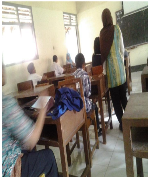
Gambar 4: Program Pendampingan UN Susulan dan UNPK Paket C