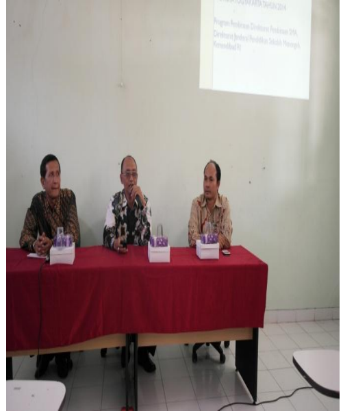
Gambar 10: Program Diklat IHT