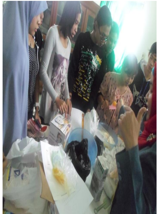
Gambar 2: Kegiatan Tata Boga