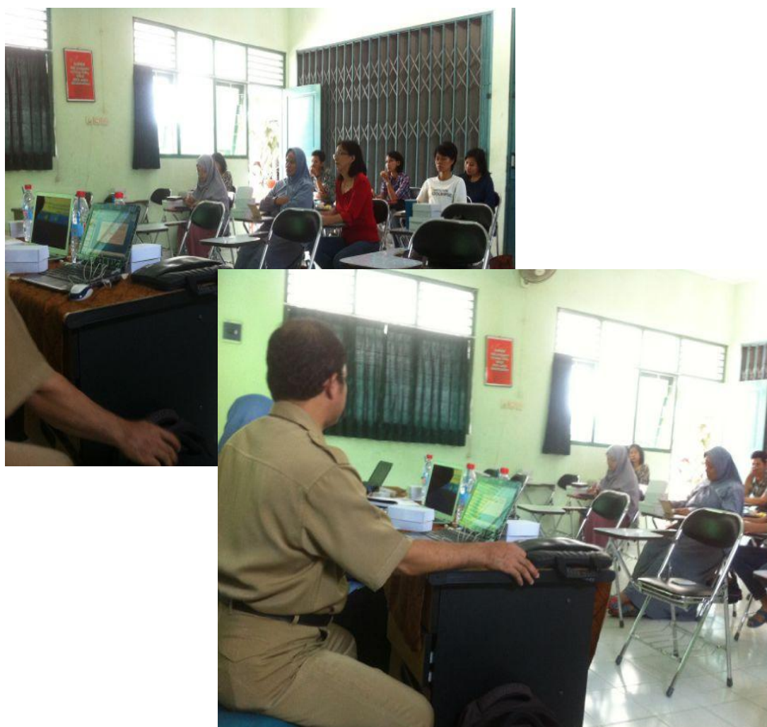
Gambar 11: Program Sarasehan Homeschooling