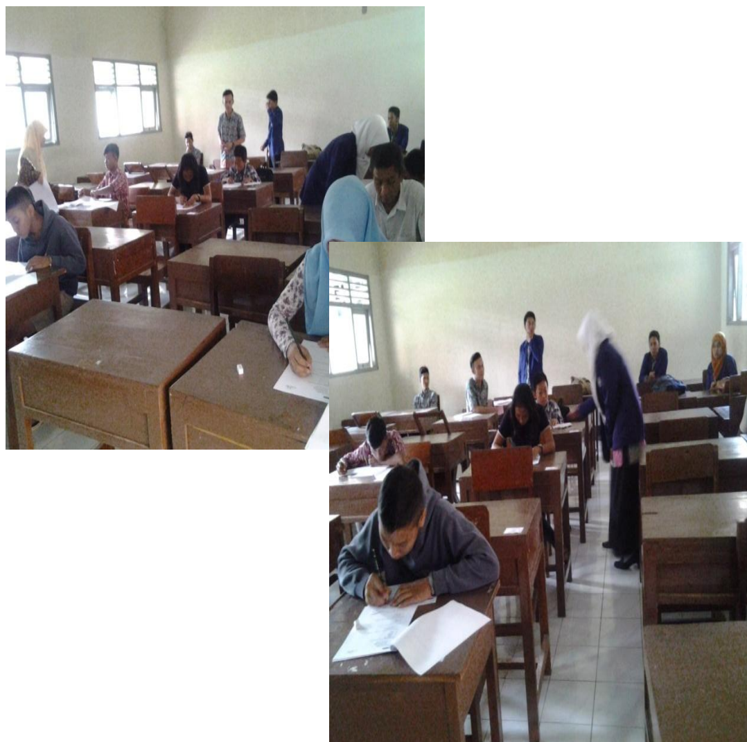
Gambar 9: Program Pendampingan Paket C