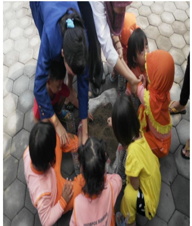
Gambar 12. Tamanisasi PAUD