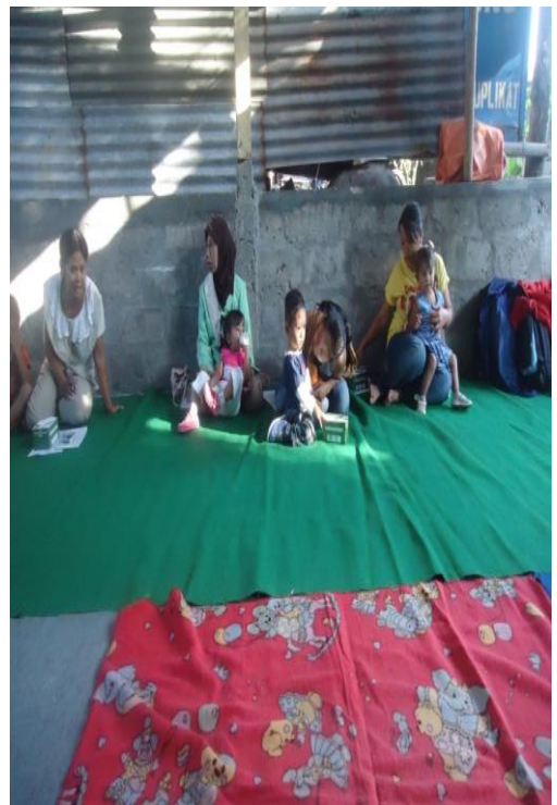
Gambar 3: Program Sosialisasi Pelatihan Holtikultura