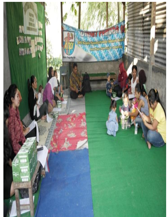
Gambar 8: Program Parenting