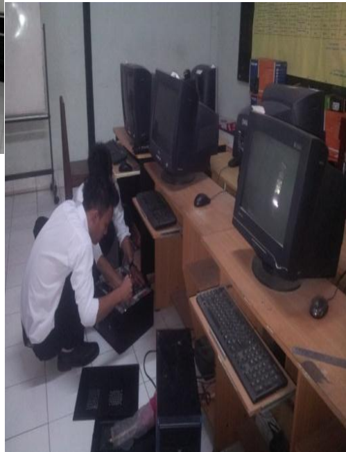
Gambar 1: Pelatihan Komputer