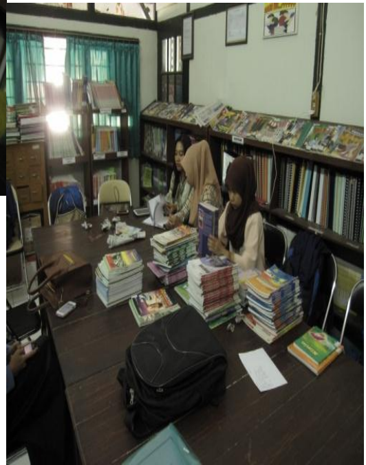
Gambar 7: Program Pengadministrasian dan revitalisasi TBM