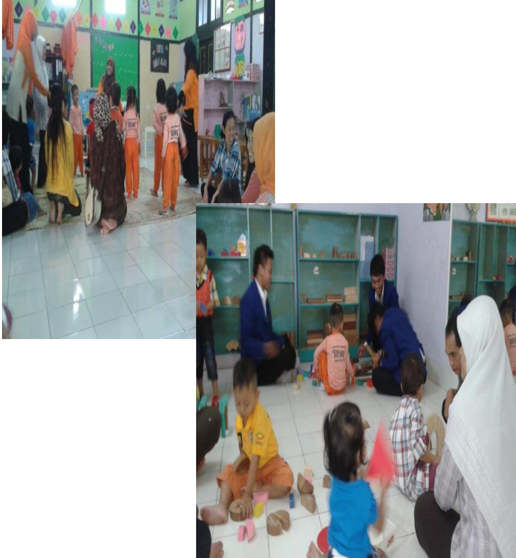
Gambar 6: Program Pendampingan PAUD KB SALMA