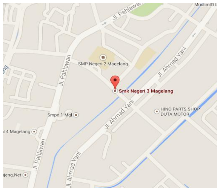
Gambar 1. Peta Lokasi SMK N 3 Magelang

SMK N 3 Magelang yang berlokasi di Jl. Piere tendean No.1 Magelang mempunyai letak yang strategis. Terletak dipusat kotamagelang dan dikelilingi oleh lingkungan sekolah dan perkantoran serta mudah dijangkau dari segala arah. Keistimewaan dari sekolah ini adalah mempunyai dua muka, yaitu satu menghadap ke jl. Piere Tendea dengan tampak muka layaknya sekolah pada umumnya sedang satunya menghadap ke jl. Pahlawan dalam bentuk hotel atau dengan nama “Hotel Citra”. Keistimewaan lainya adalah letak sekolah ini diapit (diantara) dua sekolah favorit di kota Magelang yaitu SMP Negeri 1 dan SMP Negeri 2 Magelang, disamping mempunyai ciri khas khusus siswanya kebanyakan perempuan walaupun sebenarnya kebutuhan dunia kerja dan industri dari program keahlian ini banyak dibutuhkan laki-laki.