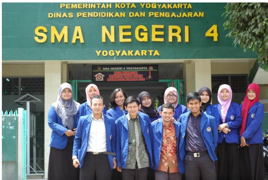
Foto Bersama Mahasiswa PPL UNY SMA Negeri 4 Yogyakarta