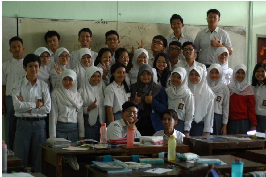
Foto Bersama Siswa