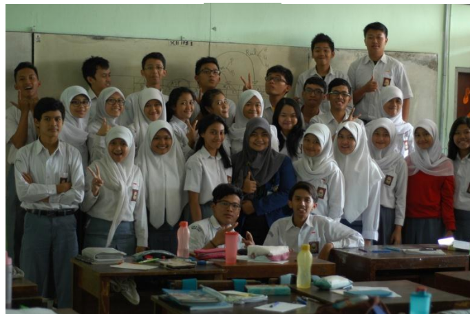
Foto Bersama Siswa