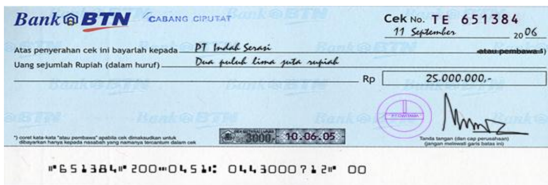
Contoh cek salah satu bank

Menurut Kamus Besar Bahasa Indonesia (KBBI), cek adalah perintah tertulis pemegang rekening kepada bank yang ditunjuknya supaya membayar sejumlah uang. Dari pengertian tersebut dapat disimpulkan bahwa cek adalah surat perintah yang dibuat oleh pihak yang mempunyai simpanan di bank, agar bank tersebut membayar sejumlah uang tertentu kepada pihak yang namanya tertera didalam cek tersebut atau si pembawa cek.