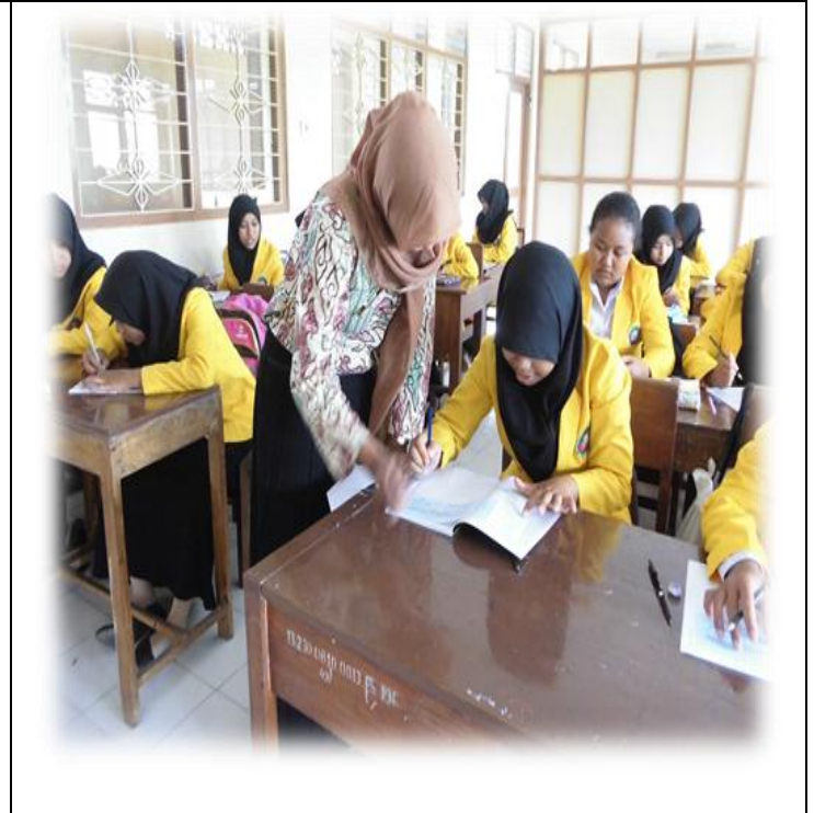
Kegiatan Belajar-Mengajar di Kelas XI AP 3