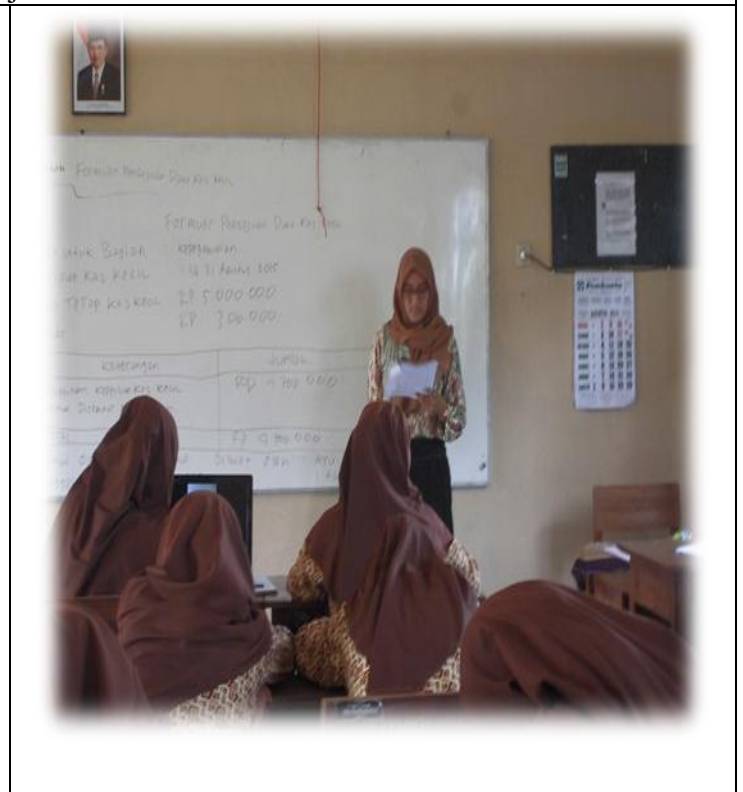
Kegiatan Belajar-Mengajar di Kelas XI AP 1