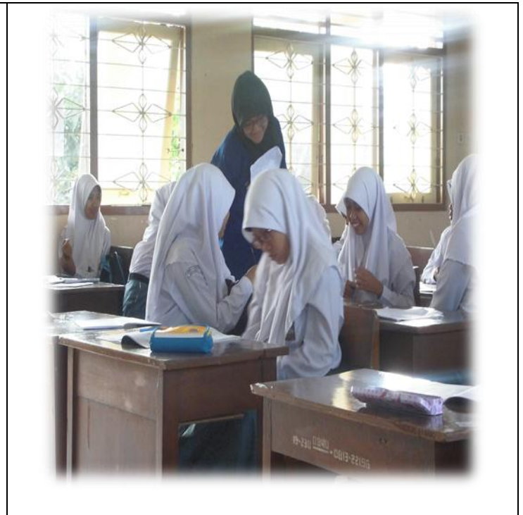
Kegiatan Belajar-Mengajar di Kelas XI AP 2