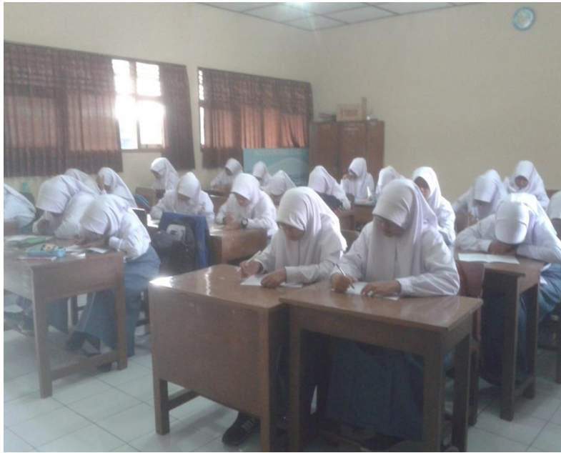
Gambar 1.4 Kondisi kelas X AP 3 Ketika Ulangan Berlangsung