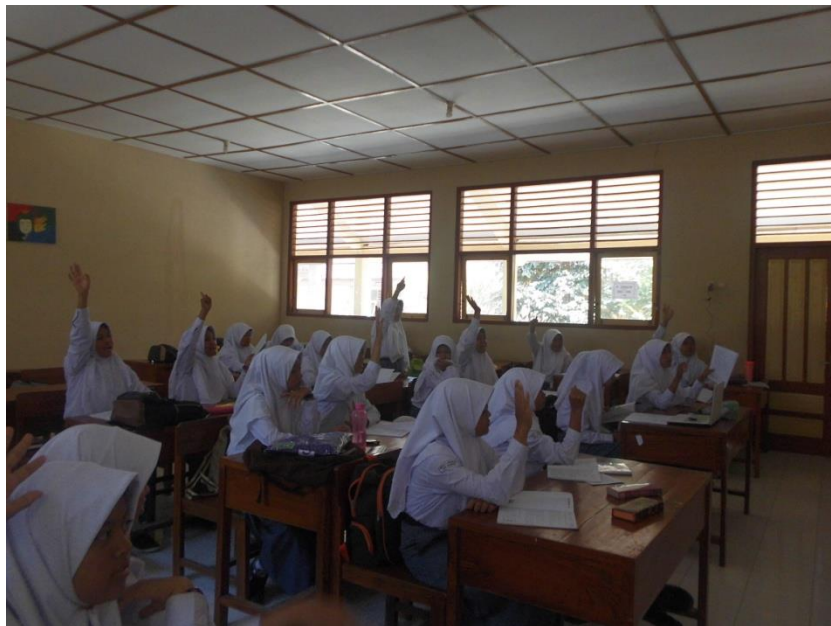
Gambar 1.8 Suasana Antusias Kelas X AP 1 dalam pembelajaran