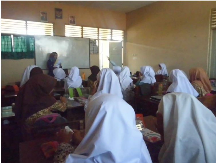
Gambar 1.2 Kondisi Kegiatan Belajar Mengajar pada kelas X AP 2