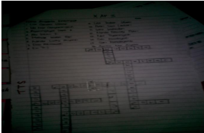
Gambar 1.7 Contoh Tugas Teka Teki Silang