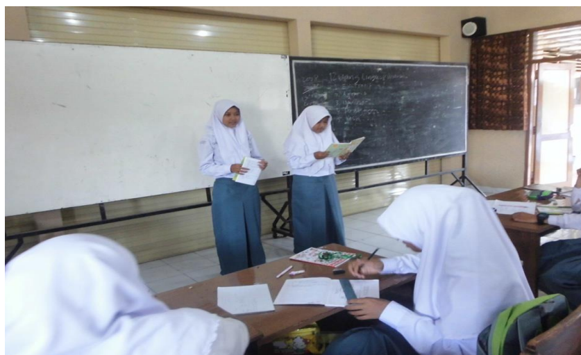
Gambar 1.9 Suasana kelas XAP 3 ketika mempresentasikan hasil kerjanya kedepan kelas