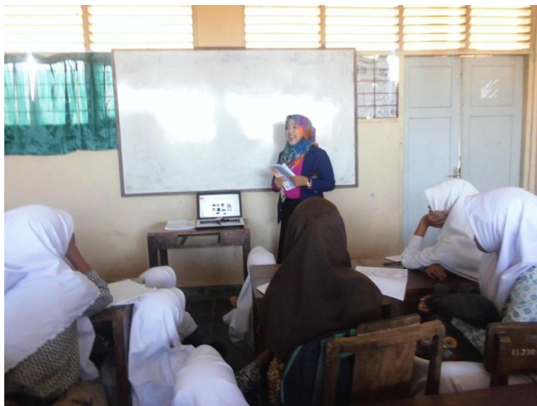
Gambar 1.3 Kegiatan Belajar Mengajar pada Kelas X AP 3