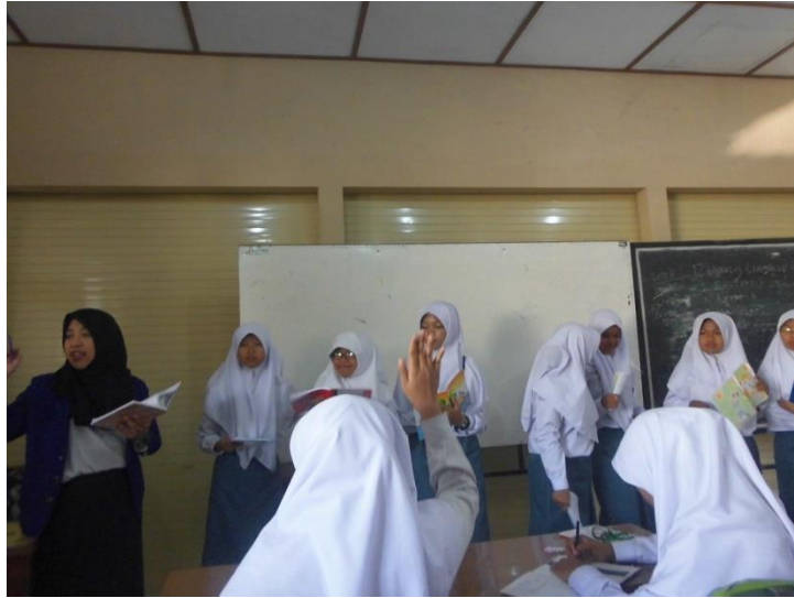
Gambar 1.1 Kondisi Kegiatan Belajar Mengajar pada kelas X AP 1