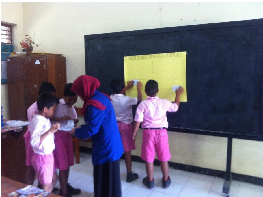
Antusiasme murid ketika maju ke depan kelas