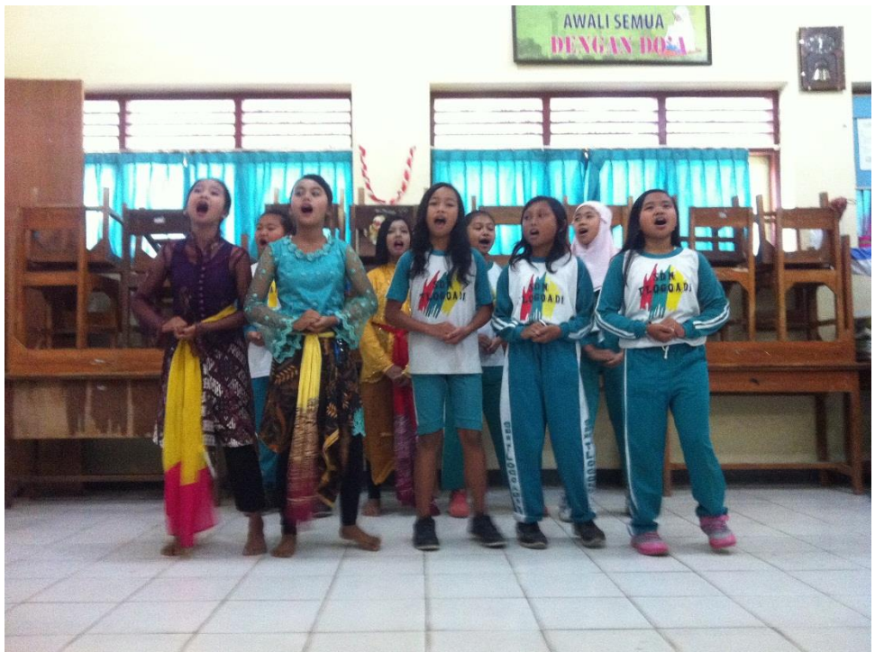
Acara Pentas Seni di SD Tlogoadi