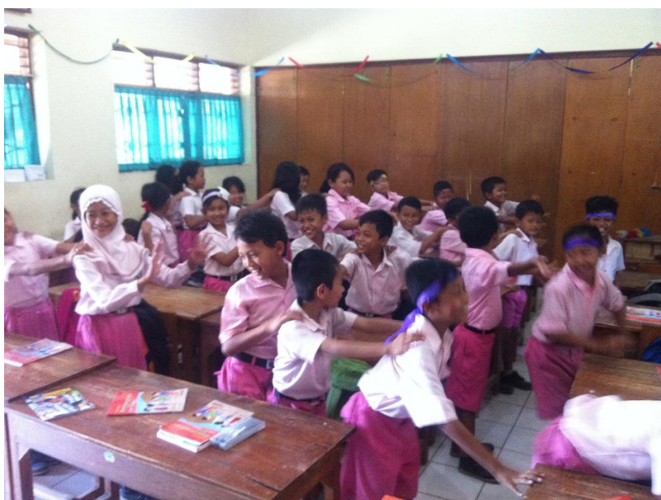
Suasana saat Ice Breaking