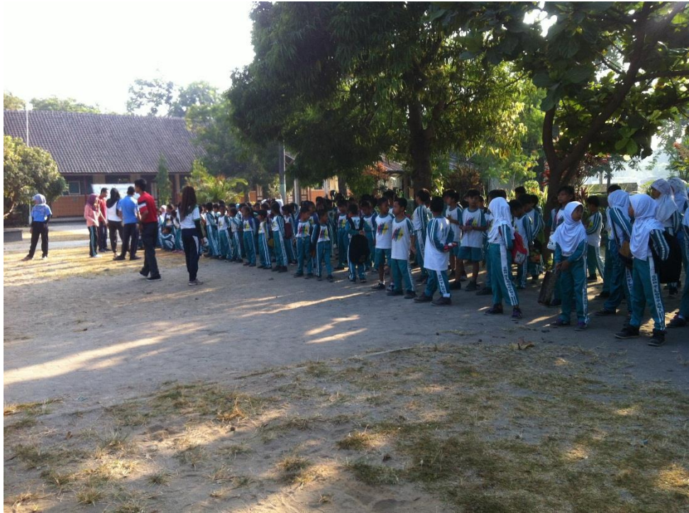
Acara saat HAORNAS