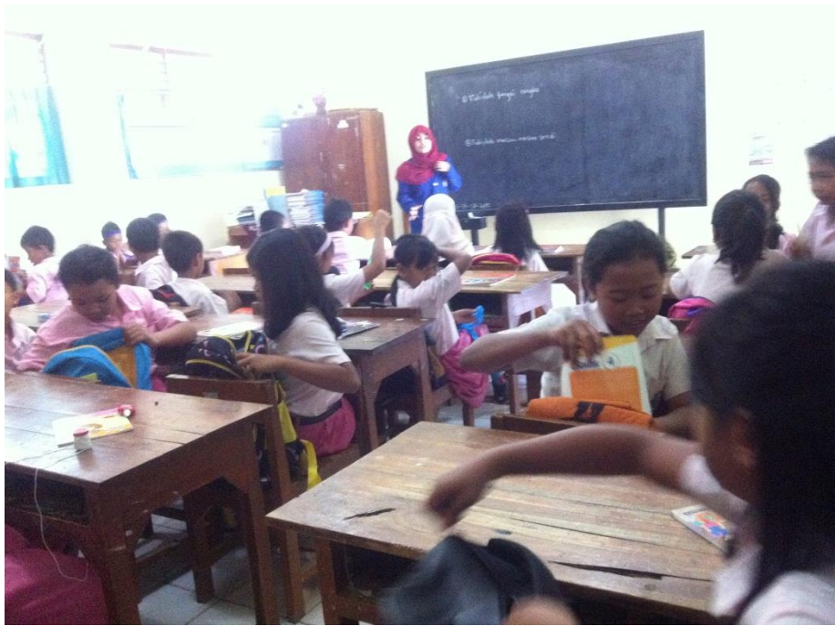
Mengajar PKn di kelas 4