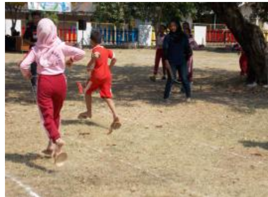
Lomba egrang bathok dalam Festival Permainan Tradisional dan Pentas Seni