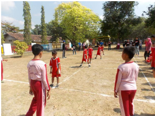
Lomba gobak sodor dalam Festival Permainan Tradisional dan Pentas Seni