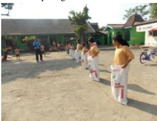
Lomba balap karung untuk memperingati HUT RI ke-70