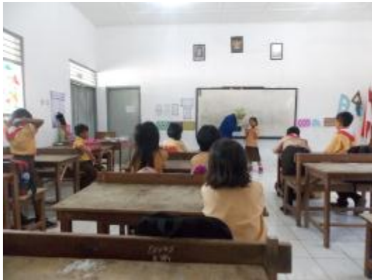
Praktik terbimbing I