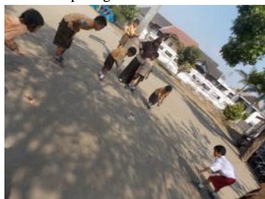
Lomba memasukkan paku ke botol untuk memperingati HUT RI ke-70