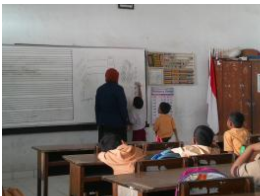
Praktik terbimbing III