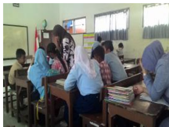
Praktik terbimbing II