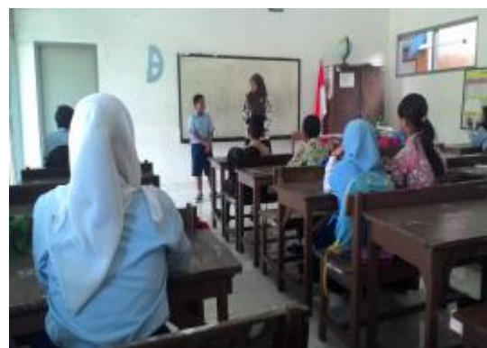
Praktik terbimbing II