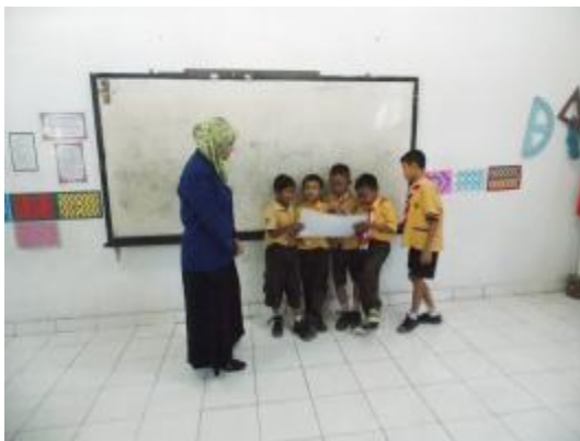
Praktik terbimbing I