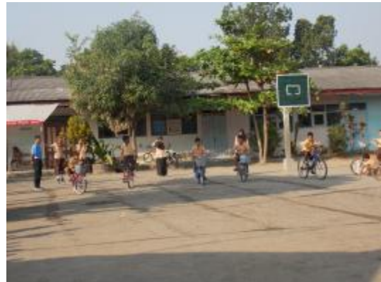
Lomba sepeda lambat untuk memperingati HUT RI ke-70