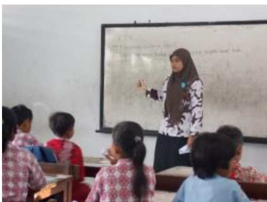
Praktik terbimbing IV