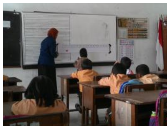
Praktik terbimbing III