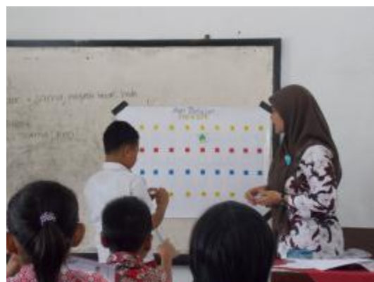
Praktik terbimbing IV