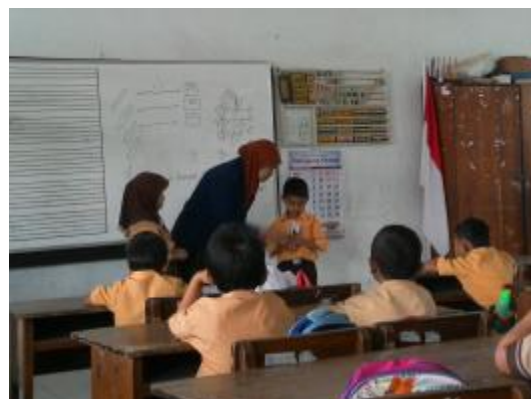
Praktik terbimbing III