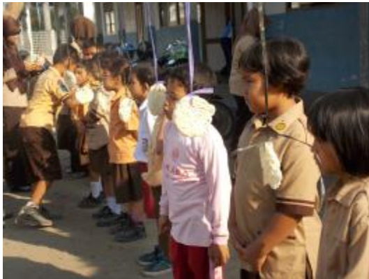
Lomba makan kerupuk untuk memperingati HUT RI ke-70