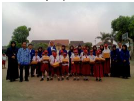
Pembagian hadiah lomba