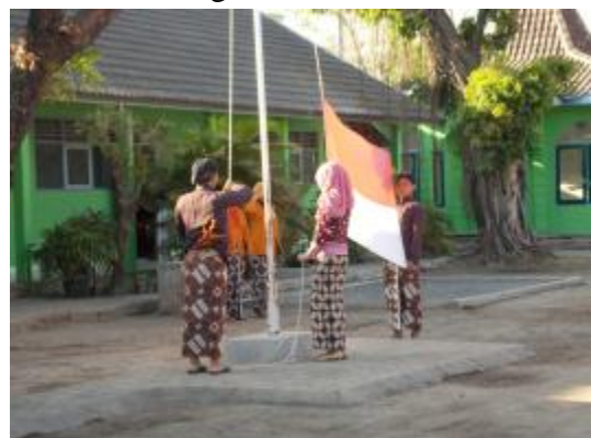
Upacara bendera memperingati Hari Keistimewaan Yogyakarta