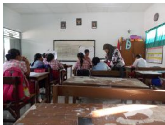
Praktik terbimbing IV