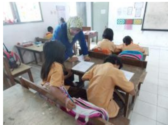
Praktik terbimbing I