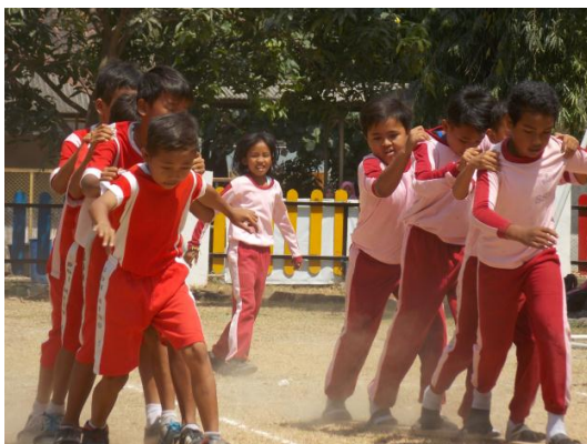
Lomba sandal bakiak dalam Festival Permainan Tradisional dan Pentas Seni