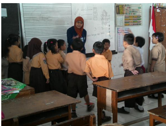
Praktik terbimbing III