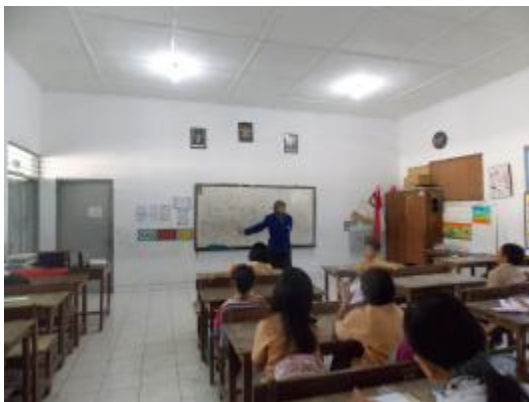
Ujian praktik II