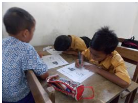
Ujian praktik II