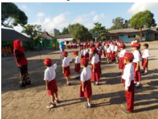
Upacara bendera memperingati Hari Keistimewaan Yogyakarta