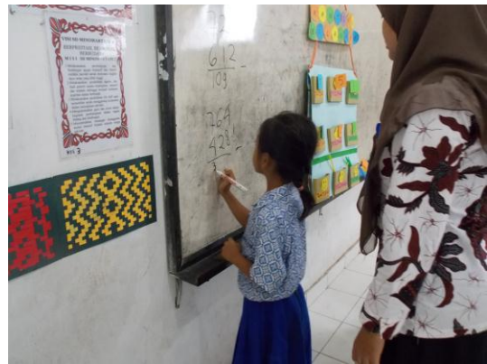
Ujian praktik I