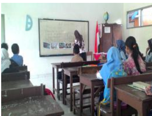
Praktik terbimbing II