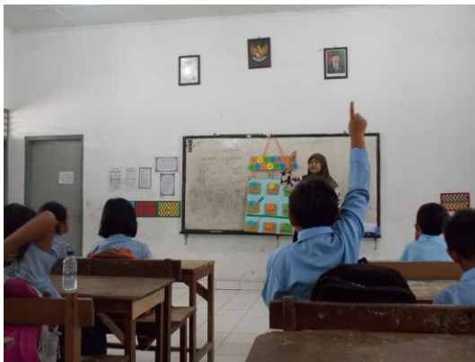
Ujian praktik I