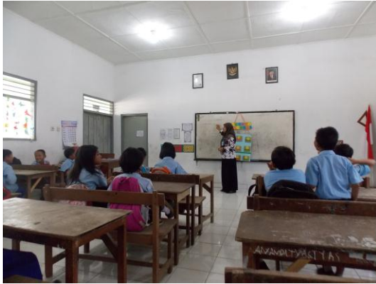
Ujian praktik I