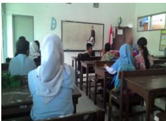
Praktik terbimbing II