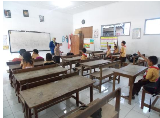
Praktik terbimbing I