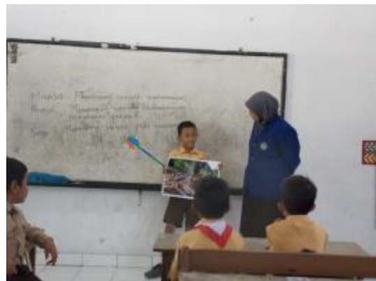
Ujian praktik II