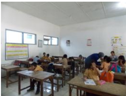
Ujian praktik II