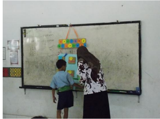
Ujian praktik I