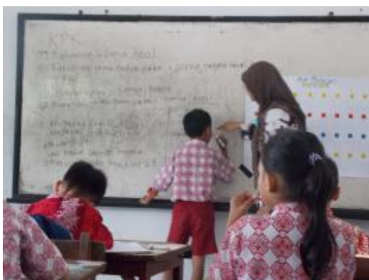
Praktik terbimbing IV