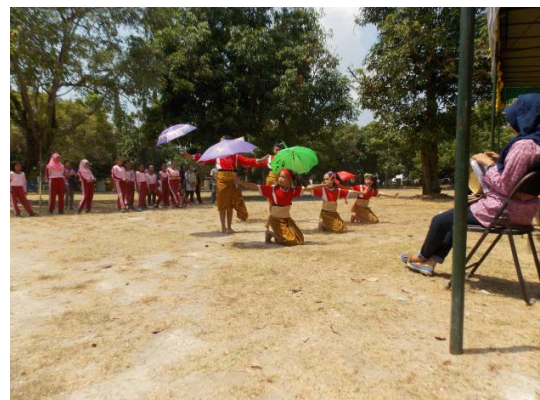
Lomba menari dalam Festival Permainan Tradisional dan Pentas Seni