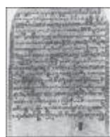
Prasasti Gajah Mada

Gajah Mada adalah patih mangkubumi (maha patih) Kerajaan Majapahit. Namanya mulai dikenal setelah beliau berhasil memadamkan pemberontakan Kutu. Gajah Mada muncul sebagai seorang pemuka kerajaan sejak masa pemerintahan Jayanegara (1309-1328). Kariernya dimulai dengan menjadi anggota pasukan pengawal raja (Bahyangkari). Mula-mula, beliau menjadi Bekel Bahyangkari (setingkat komandan pasukan). Kariernya terus menanjak pada masa