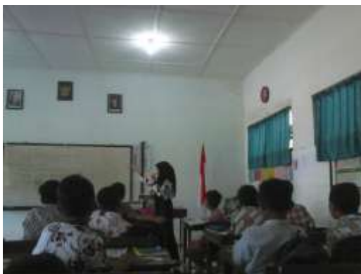
Praktek Mengajar ke-3