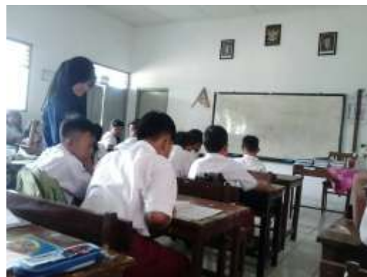
Praktek Mengajar ke-4