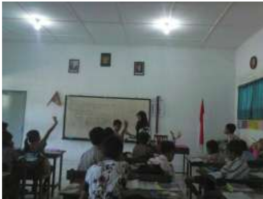
Praktek Mengajar ke-1