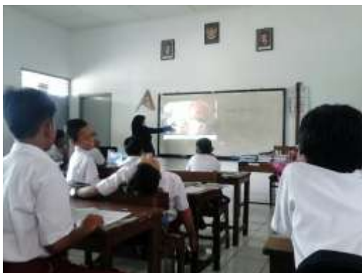
Ujian Mengajar ke-1