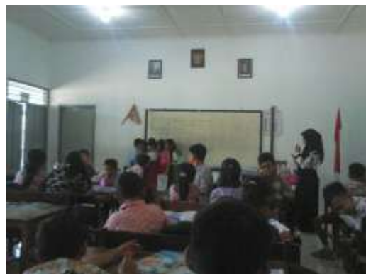
Ujian Mengajar ke-2