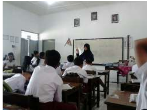
Praktek Mengajar ke-2