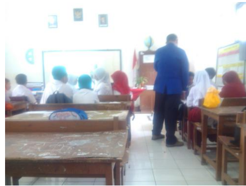
Praktek mengajar 4