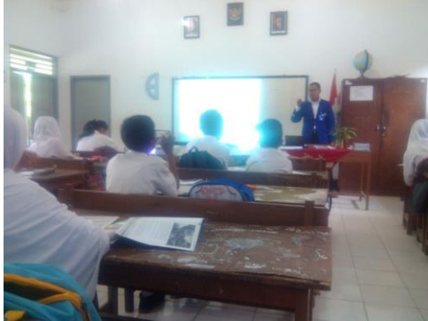
Praktek mengajar 1