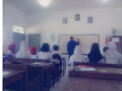
Praktek mengajar 2