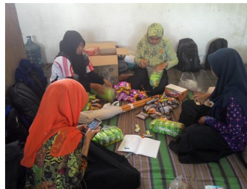
Persiapan Hadiah 17an