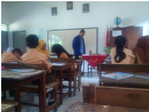
Praktek mengajar 3