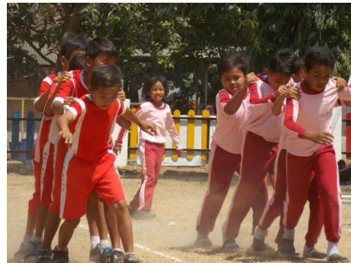
Lomba Festival Anak