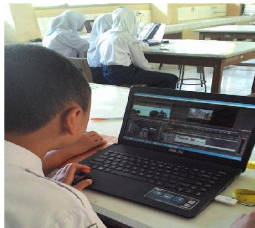
Gambar 25 dan 26. Proses editing video pembelajaran