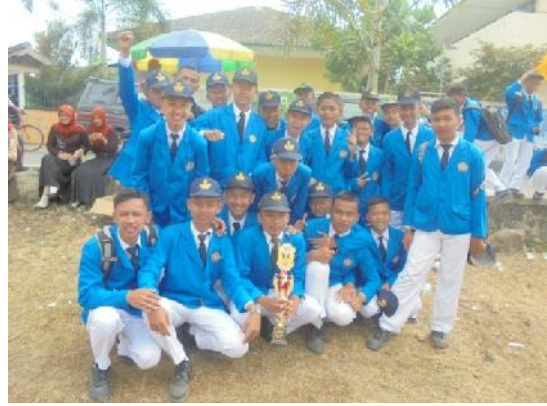
Gambar 8. Juara III Putra TONTI