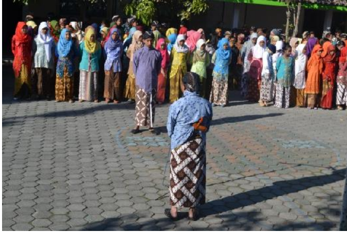
Gambar 1. Upacara bendera di sekolah