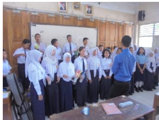
Gambar 16. Media Barang Bekas