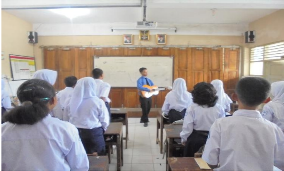
Gambar 17 dan 18. Menyanyikan Materi Lagu Daerah Bersama-sama