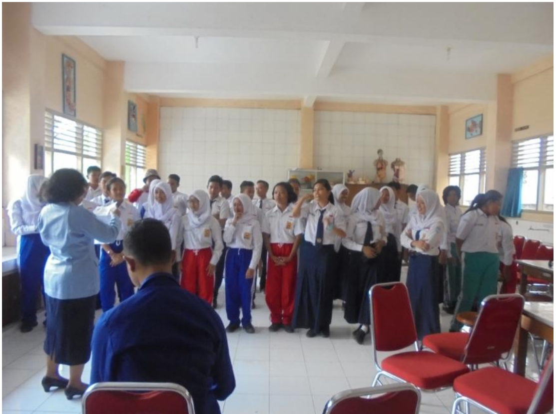
Gambar 19. Pendampingan Guru Mengajar Paduan Suara