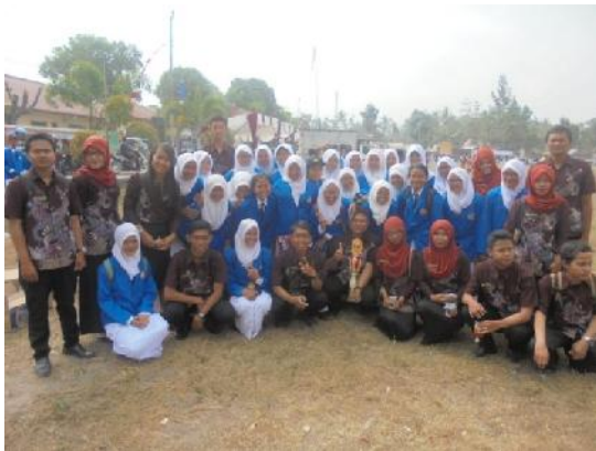
Gambar 9. Juara III Putri TONTI