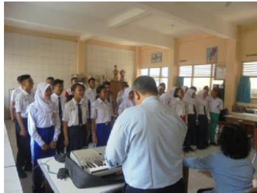
Gambar 3 dan 4. Latihan Paduan Suara di Laboratorium IPA