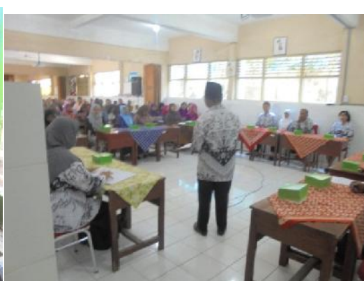
Gambar 29, 30. Rapat kelompok PPL