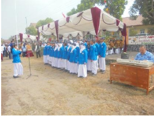
Gambar 7. Paduan Suara