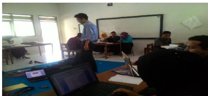
Gambar 29, 30. Rapat kelompok PPL