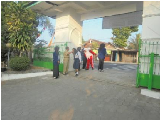
Gambar 23. Menyalami siswa