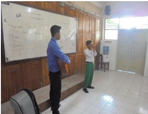
Gambar 15. Mengiringi Praktik Siswa