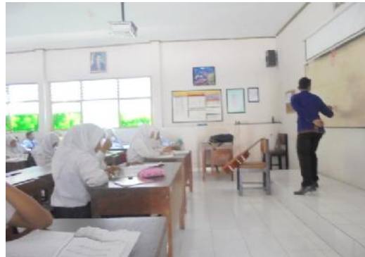
Gambar 13 dan 14. Guru menjelaskan materi