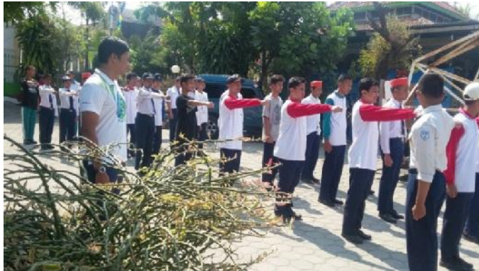
Gambar 2. Latihan TONTI