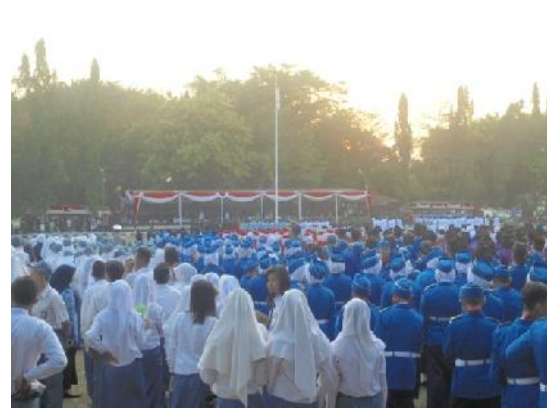
Gambar 10. Upacara penurunan bendera