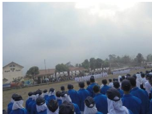
Gambar 5 dan 6. Upacara Hari Kemerdekaan 17 Agustus di Lapangan Pojok