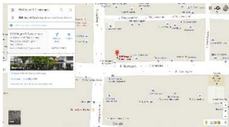
Gambar 1. Lokasi SMK N 1 Cangkringan

SMK Negeri 1 Cangkringan terletak di jalan Merapi Golf, Sintokan, Wukirsari, Cangkringan, Sleman, Yogyakarta. Telp. (0274) 713500, SMK N 1 Cangkringan merupakan Sekolah menengah kejuruan di bawah naungan Dinas Pendidikan Kabupaten Sleman. Lokasi sekolah yang secara geografis terletak dikaki Gunung merapi ini menjadi sekolah menengah kejuruan yang teratas di kabupaten sleman, dengan kondisi lingkungan pedesaan yang masih asri dan kondusif untuk kegiatan belajar dan mengajar.