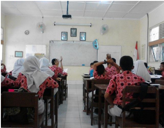
FOTO KEGIATAN PPL