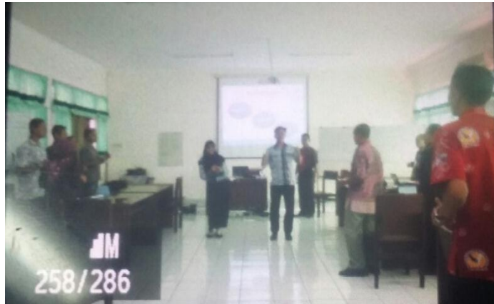
Dokumen foto saat mengisi ice breaking