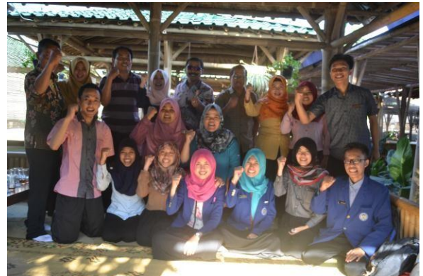
Dokumen foto keakraban dan kebersamaan dengan pegawai BBPPKS Yogyakarta