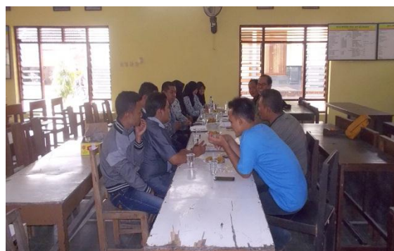
Dokumen foto saat melakukan TNA dengan Karang Taruna “Bangun” di Desa Srimartani