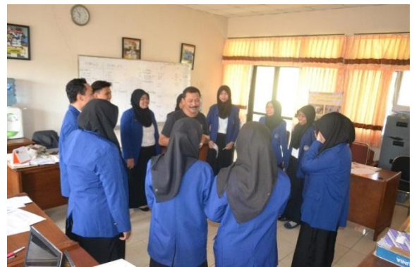
Dokumen foto saat melakukan diskusi dan latihan dinamika kelompok