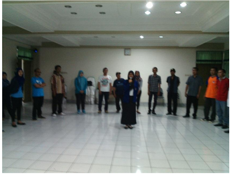
Dokumen foto saat melakukan dinamika kelompok