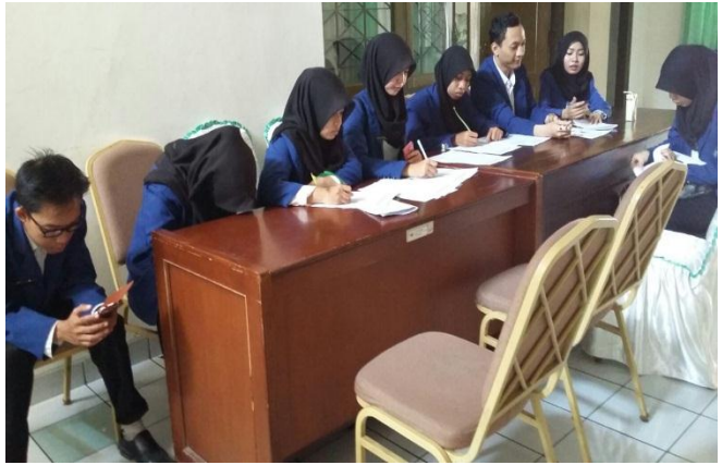
Dokumen foto saat membantu panitia menyelesaikan administrasi