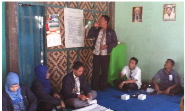
Dokumen foto saat pendampingan PBL