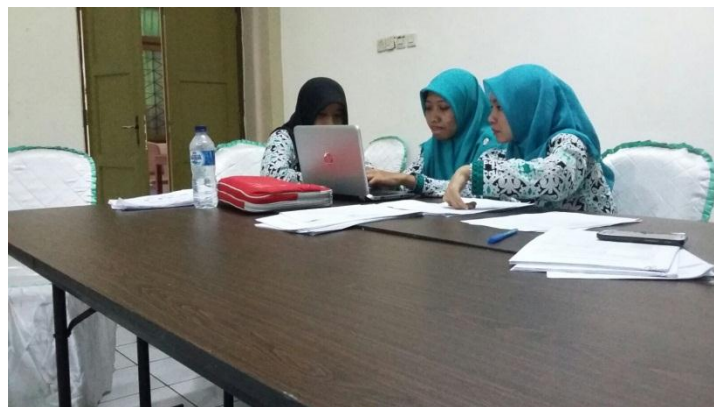
Dokumen foto saat melakukan rekap angket evaluasi fasilitator