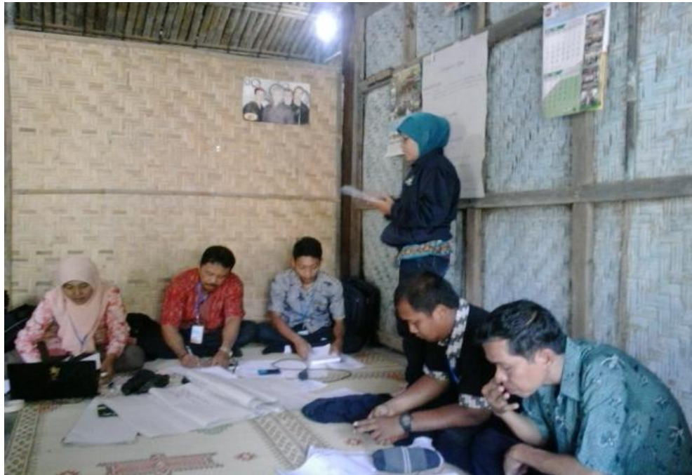
Doc. Kegiatan Pendampingan PBL