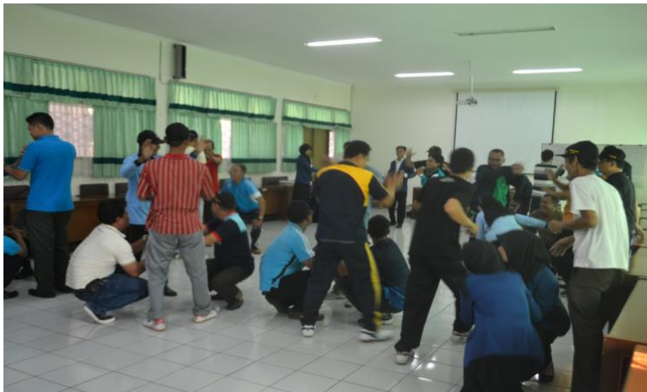
Doc. Dinamika Kelompok bersama peserta Diklat KUBE angkatan I dan II