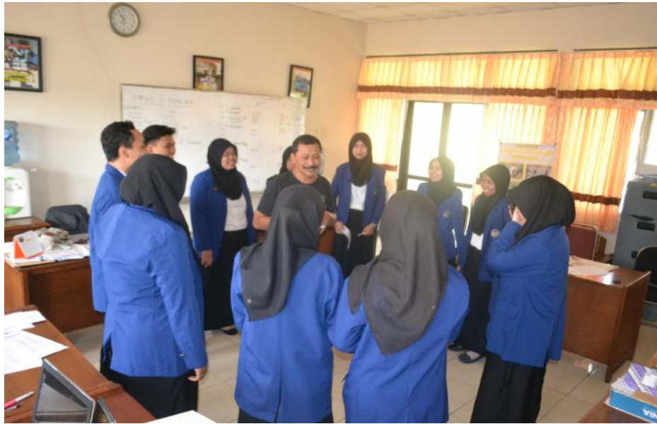
Doc. Latihan persiapan Dinamika Kelompok