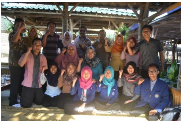
Doc. Foto kebersamaan dan keakraban dengan TIM lab. Peksos