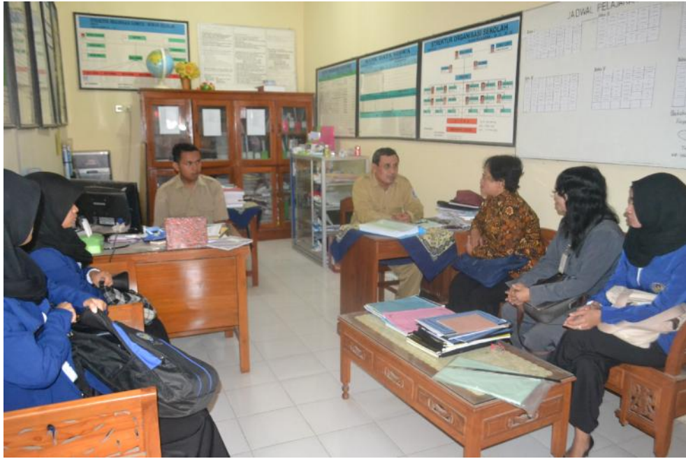
Doc. Kegiatan Identifikasi dan analisis kebutuhan di desa Prambanan