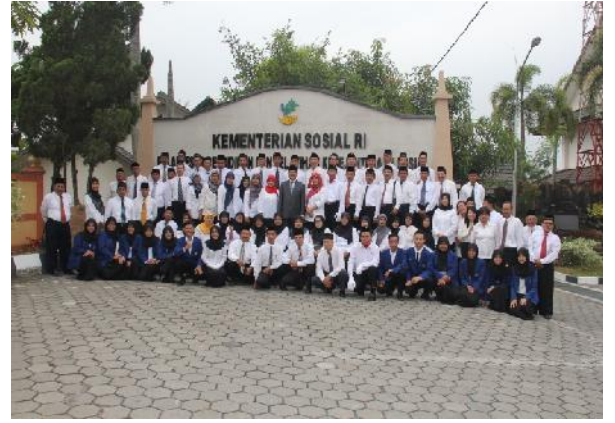
Doc. Foto bersama Pegawai BBPPKS Yogyakarta