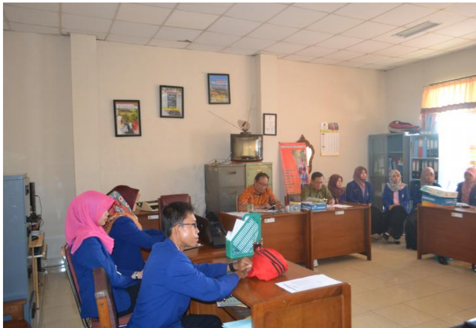
Doc. Diskusi Rutin bersama TIM Lab. Peksos