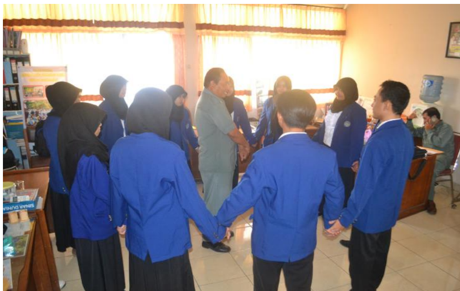
Doc. Permainan Games edukatif sebagai awal keakraban bersama TIM Lab.Peksos