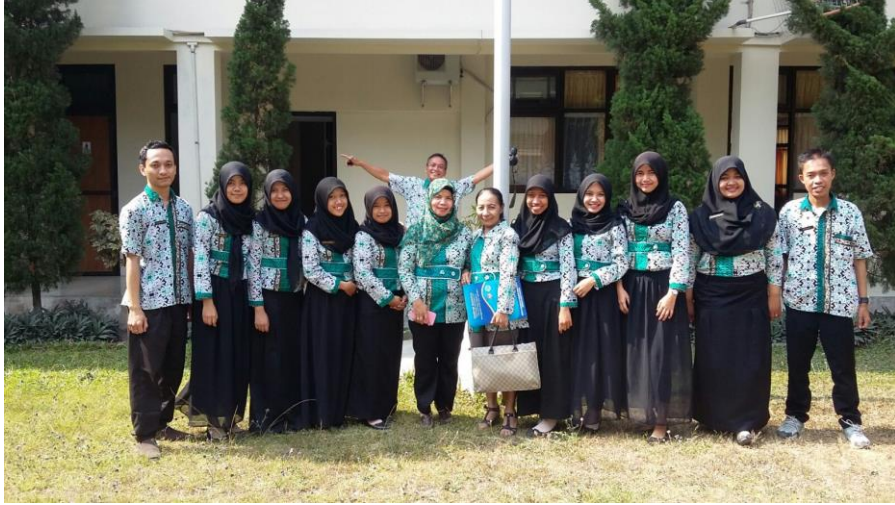
Doc. Kebersamaan dengan Staff Lab. Peksos dan Media serta foto perpisahan Magang III