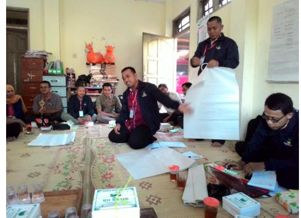
Doc. Kegiatan Pendampingan PBL