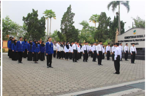
Doc. Upacara Kemerdekaan Ke 70 RI bersama jajaran Petinggi dan Staff BBPPKS Yogyakarta