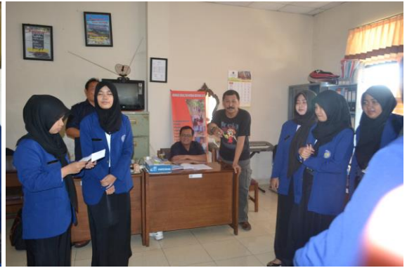
Doc. Briefing oleh Instruktur sebelum kegiatan Diklat KUBE