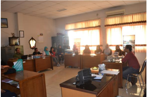
Doc. Diskusi Kelompok Gamplong untuk TNA di Dusun Gamplong