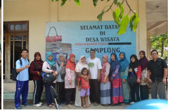
Doc. Mencoba ATBM potensi utama kerajinan Dusun Gamplong