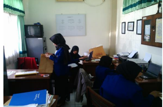
Doc. Kegiatan Penilaian Hasil Belajar Diklat dan Penyusunan Administrasi Kelengkapan Sertifikat Peserta Diklat