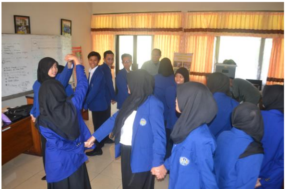
Doc. Dinamika Kelompok Mahasiswa Magang III