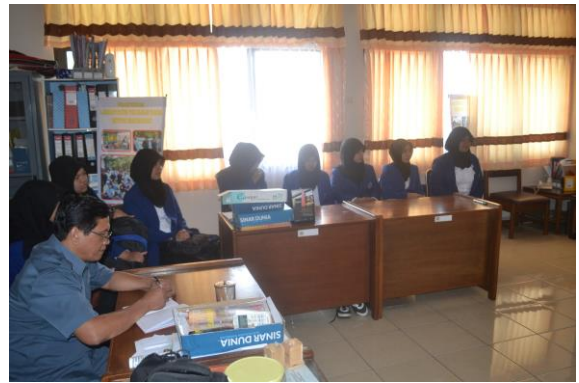
Doc. Penerjunan Mahasiswa Magang III di Kantor BBPKS Yogyakarta