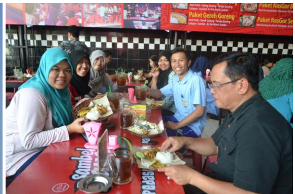
Doc. Keakraban dengan Pekerja Sosial BBPPKS