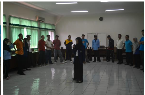
Doc. Mengisi Kegiatan Permainan dalam Dinamika Kelompok Diklat KUBE