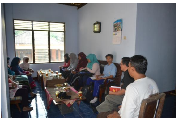
Doc. Kegiatan Training Need Assesment (TNA) di Dusun Gamplong