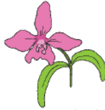
Bunga Anggrek Bulan