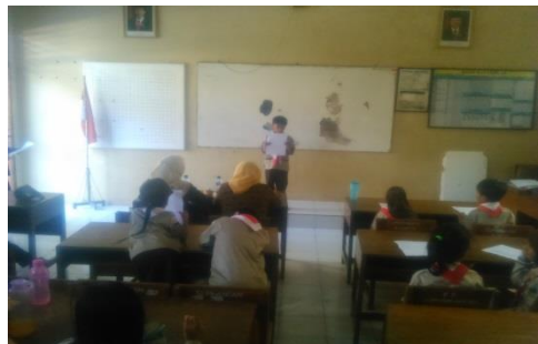
Lomba Peringatan HUT RI ke-70