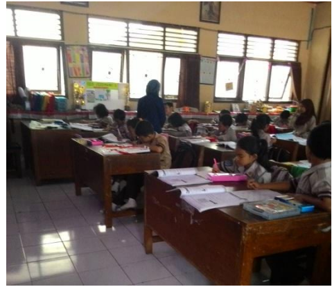
Pelaksanaan Ujian PPL 1 (Kelas III A)