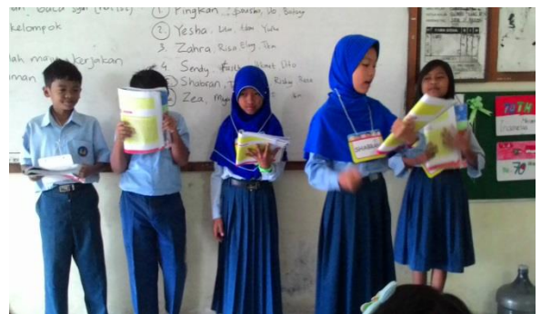
Pelaksanaan PPL Terbimbing 4 (Kelas VA)