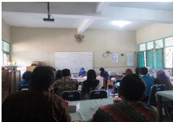
Penarikan PPL UNY