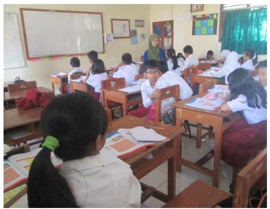
Pelaksanaan Ujian PPL 2 (Kelas V B)