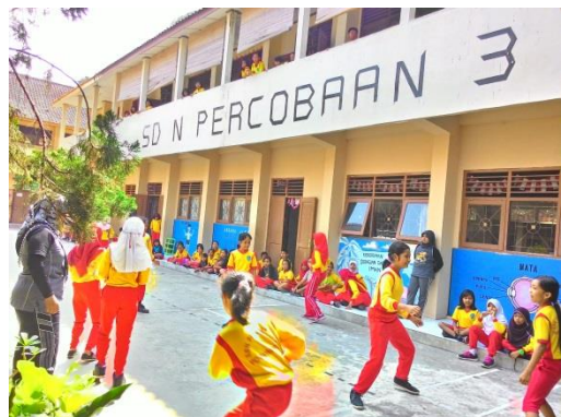
Lomba Peringatan HUT RI ke-70