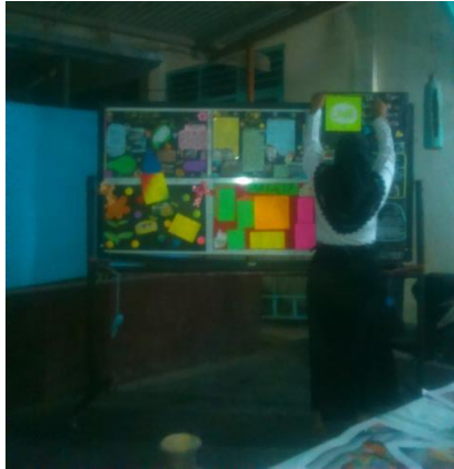
Membantu persiapan lomba gugus