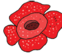
Bunga Rafflesia Arnoldi

Beberapa negara memiliki bunga nasional.