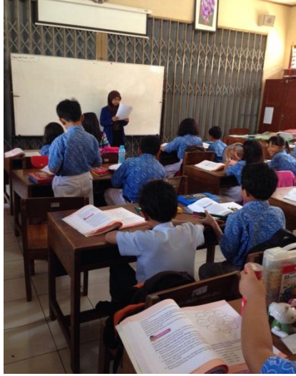
Pelaksanaan PPL Terbimbing 2 (Kelas III B)