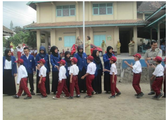
Perpisahan PPL UNY