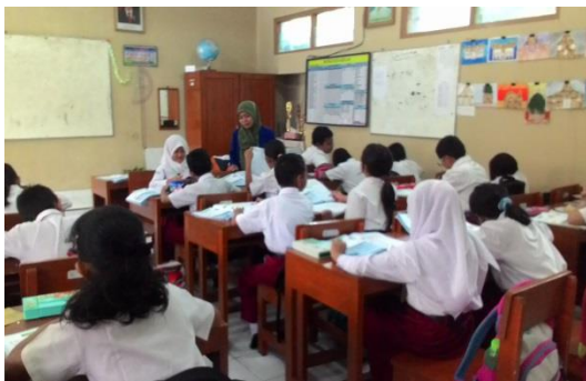
Pelaksanaan PPL Terbimbing 3 (Kelas IVB)