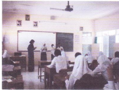
Siswa diajak praktik membaca wacan basa jawa kelas VIII B.