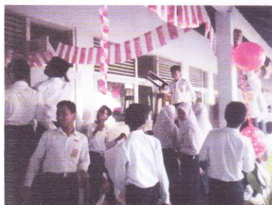
Lomba kebersihan dan hias kelas 17 Agustus 2015