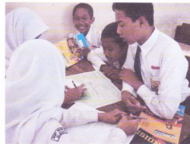
Diskusi kelompok membahas wacan berbahasa Jawa kelas VIII B.