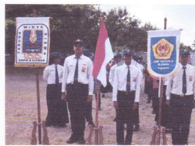
Pendampingan pemilihan pengurus OSIS hingga pelantikan.