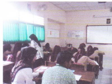
Membuat geguritan bertema gotong royong kelas VII B