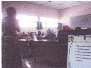
Menerangkan Aksara Jawa dengan power point kelas VIII D