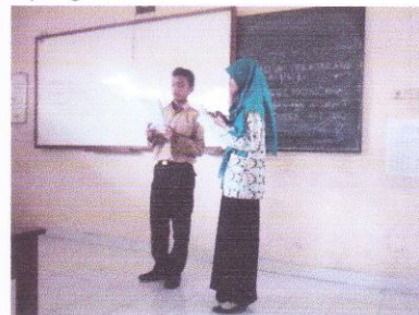
Praktik membaca geguritan kelas VII B