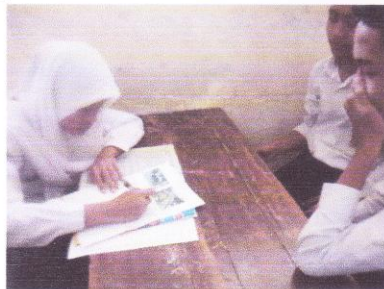
Diskusi membuat satu jenis wacan berbahasa Jawa berdasarkan gambar kelas VIII D.