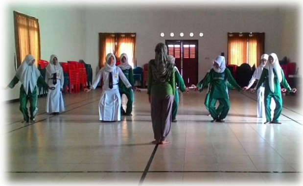
Pengembangan Diri Kelas 8