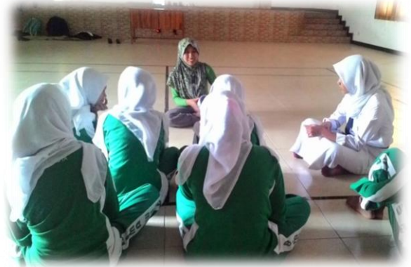
Pengembangan Diri Kelas 8