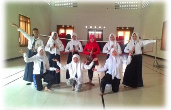
Pengembangan Diri Kelas 9