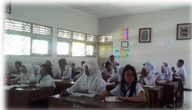
Mengajar Teori Kelas 8C