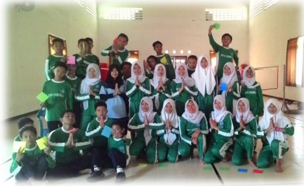
Praktik Tari Zapin Kelas 8C