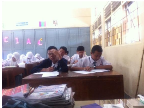
Gb 3 Situasi KBM di kelas X D pada saat diskusi