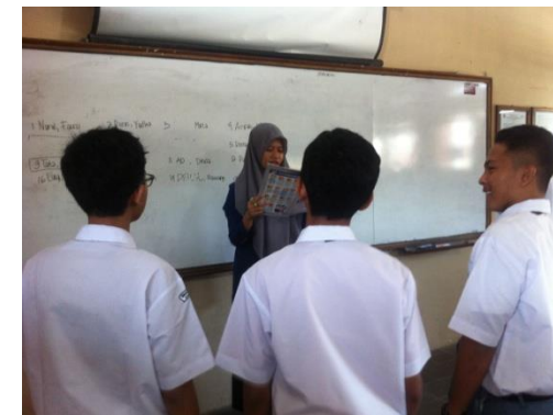
Gb 4 Situasin KBM di kelas X B pada saat mencari informasi tentang materi.