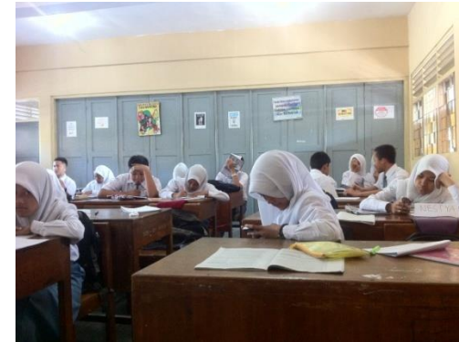
Gb 2 Situasi KBM di kelas X B pada saat diskusi