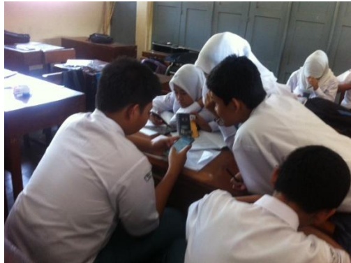
Gb 1. Situasi KBM di kelas X D pada saat metode Jigsaw