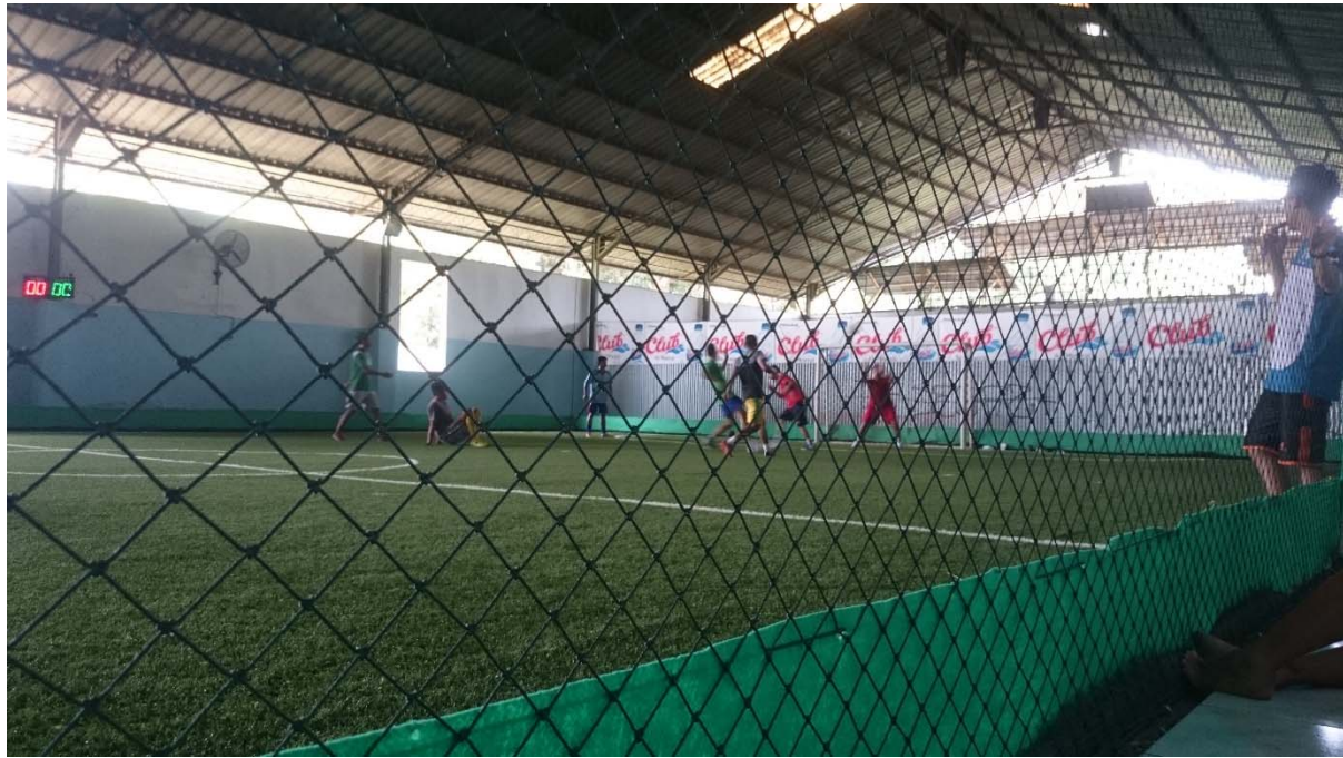
Futsal Putra Dalam Rangka Lomba 17 Agustus 2015