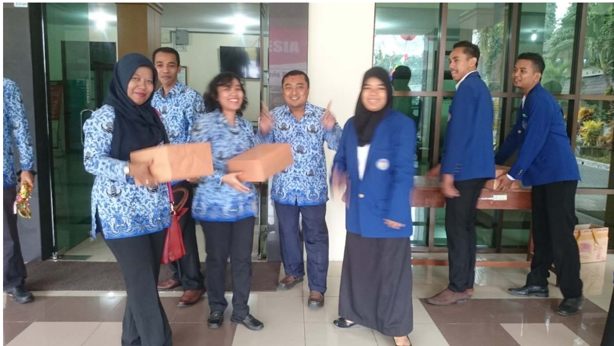
Penyerahan Trophy & Hadiah Lomba 17 Agustus 2015