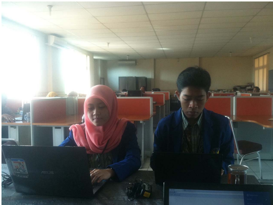
Analisis Hasil Evaluasi Diri Sekolah (EDS)