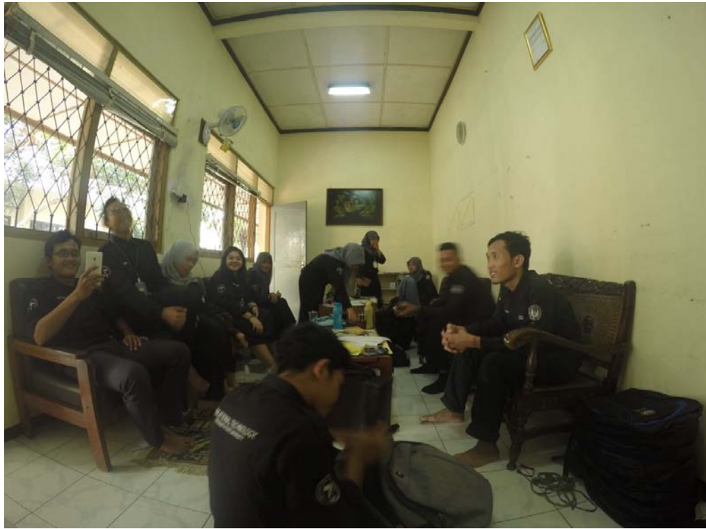
Koordinasi & Konsultasi Program PPL