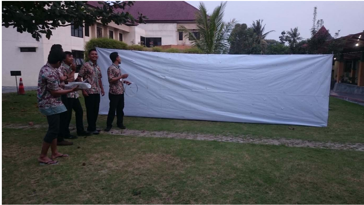
Pembuatan Voli Banner Dalam Rangka Lomba 17 Agustus 2015