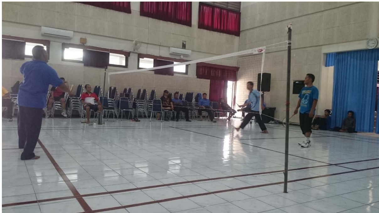
Bulu Tangkis Putra Dalam Rangka Lomba 17 Agustus 2015