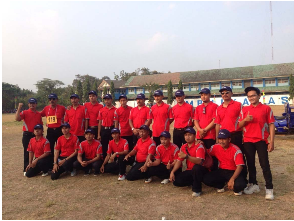
Lomba Gerak Jalan Dalam Rangka Lomba 17 Agustus 2015