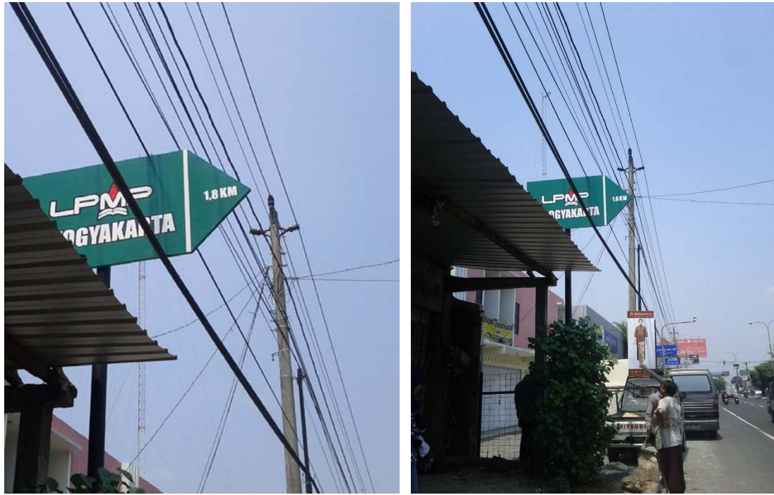
Pemasangan plang/papan penunjuk arah di Jl. Solo