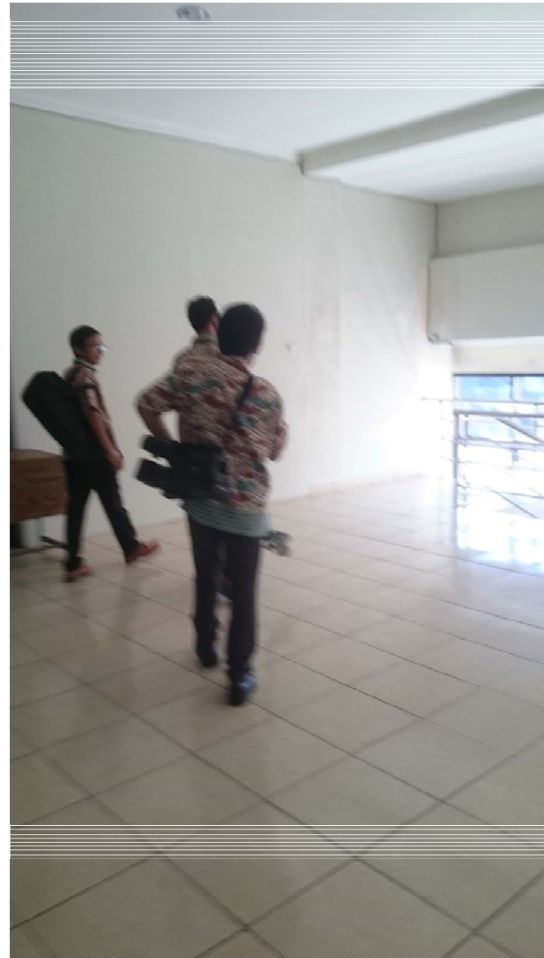
Pembuatan Video Profil LPMP DIY