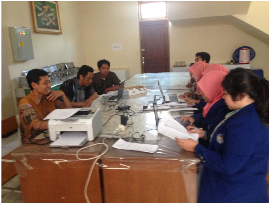
Inventarisasi Aset BMN