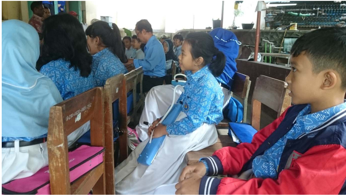
Diklat Kepsek Kab. Tabrauw Papua Barat Di SDN Percobaan 3 Sleman