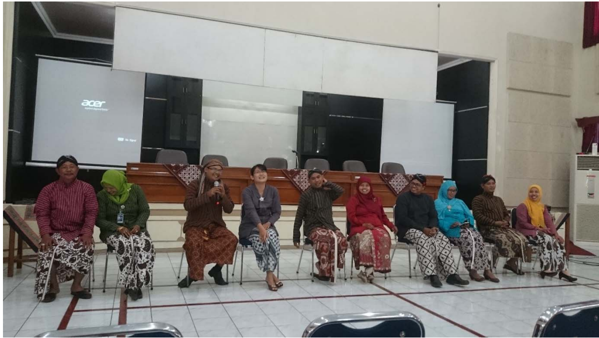
Peringatan UU Keistimewaan Yogyakarta