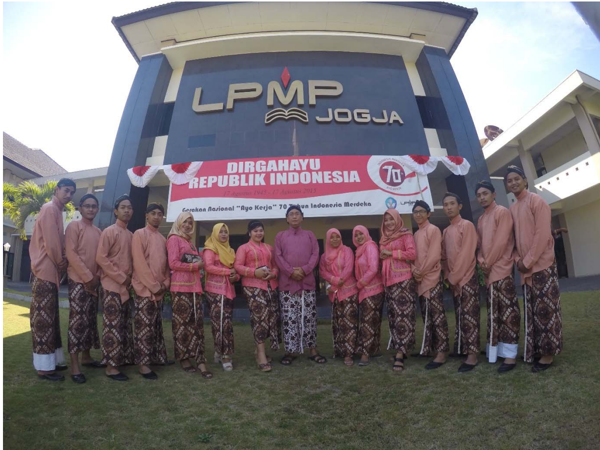
Peringatan UU Keistimewaan Yogyakarta