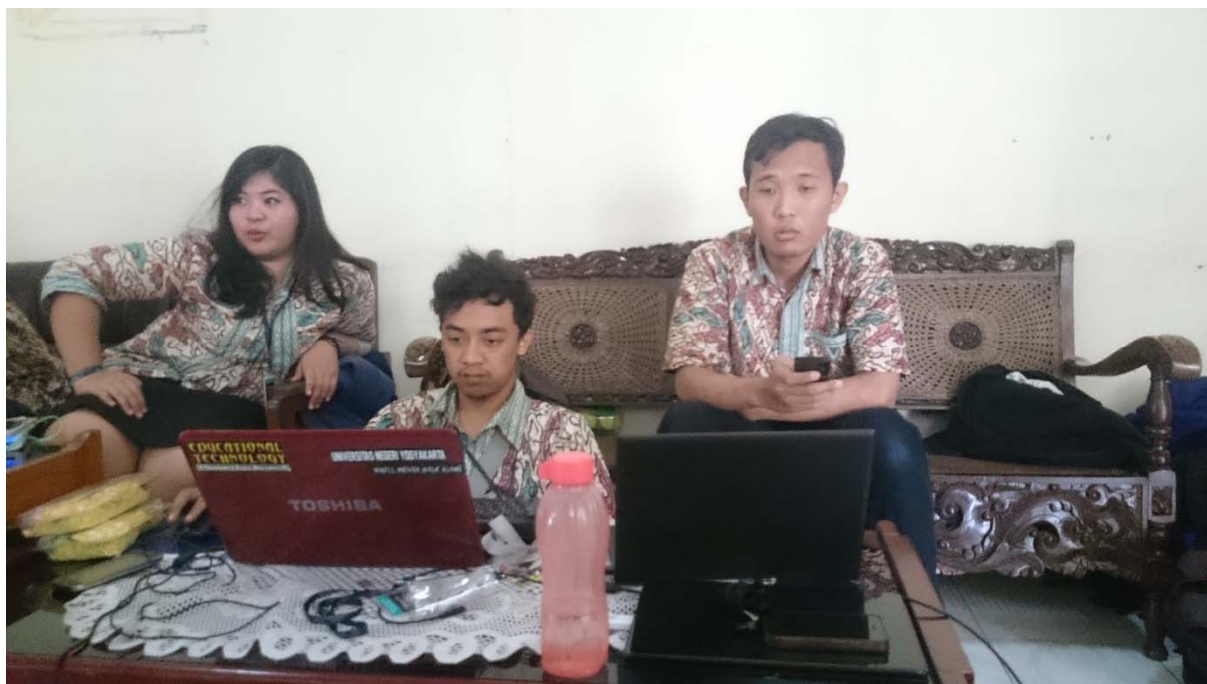
Editing Pembuatan Video Profil LPMP