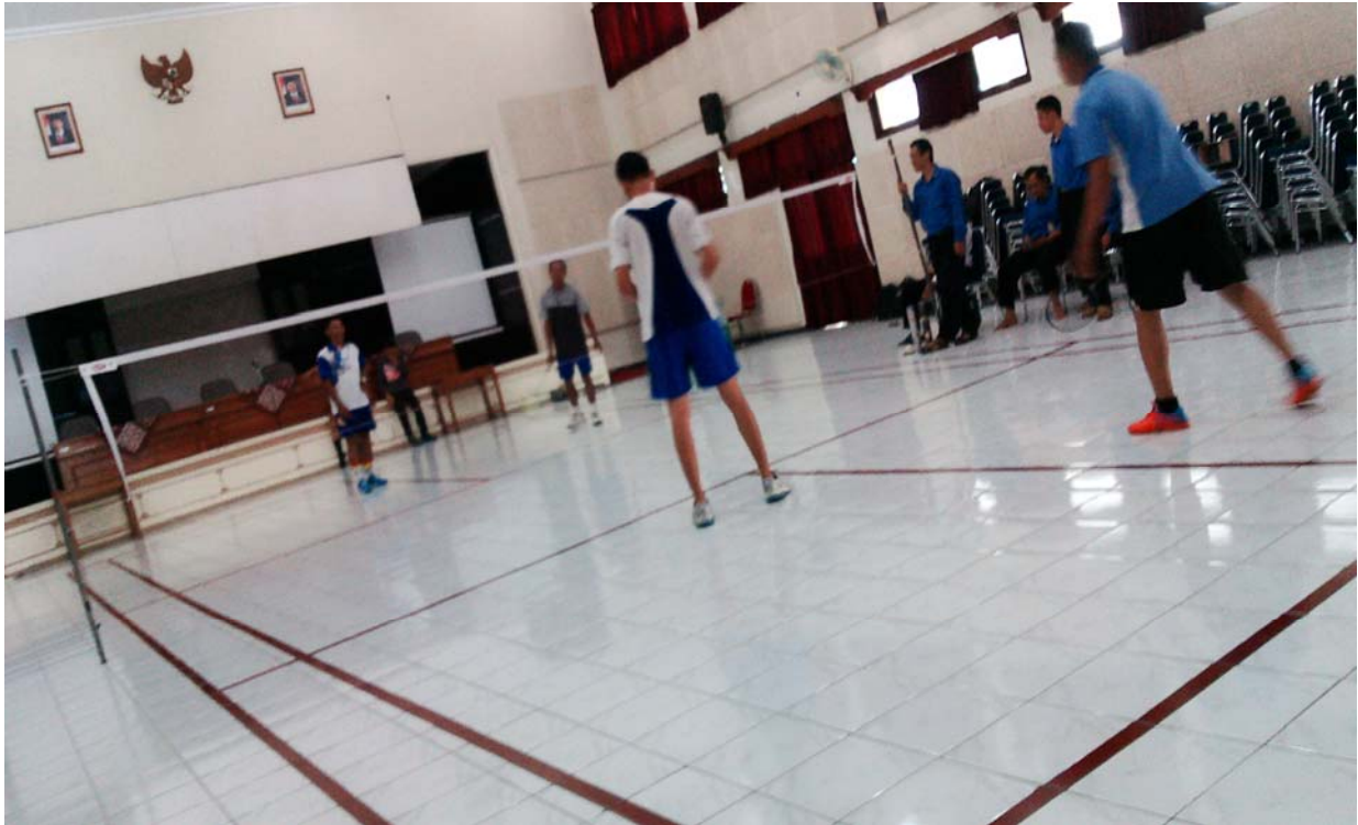
Gb.2 Lomba Bulutangkis