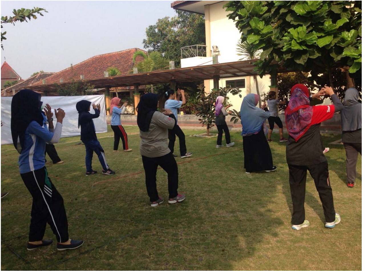
Gb. 9 Senam Pagi (Zumba)