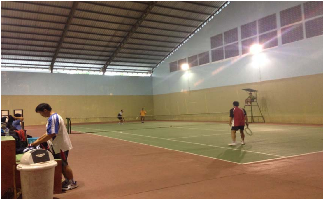
Gb. 3 Lomba Tenis Lapangan