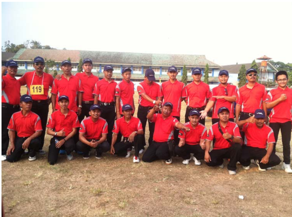
Gb. 10 Gerak Jalan Peringatan HUT RI ke 70 se Kecamatan Kalasan