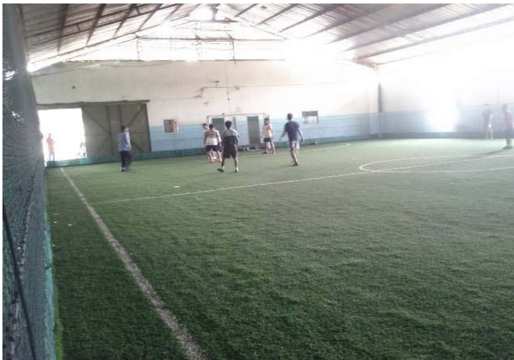
Gb. 4 Lomba Futsal