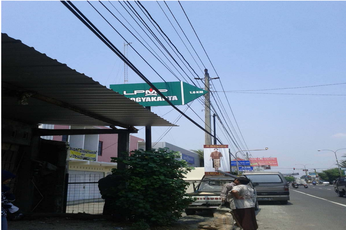
Gb. 6 Pembuatan Papan Penunjuk Arah