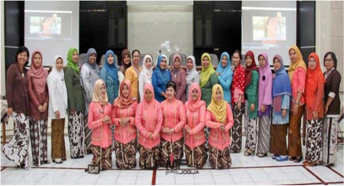
Gb. 7 Peringatan UU Keistimewaan Yogyakarta