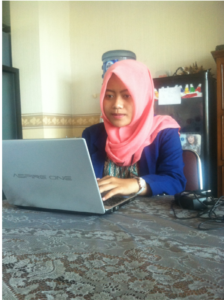
Gambar 8. Analisis Hasil Evaluasi Diri Sekolah