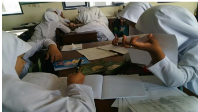
Gambar 3. Siswa Berdiskusi Saat Pelajaran di Kelas