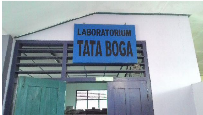
Gambar 1. Laboratorium Tata Boga