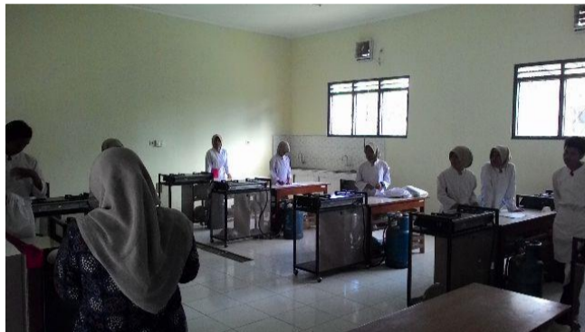
Gambar 2. Pembelajaran Praktek