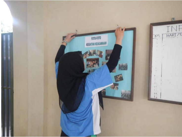
Persiapan lomba sekolah sehat