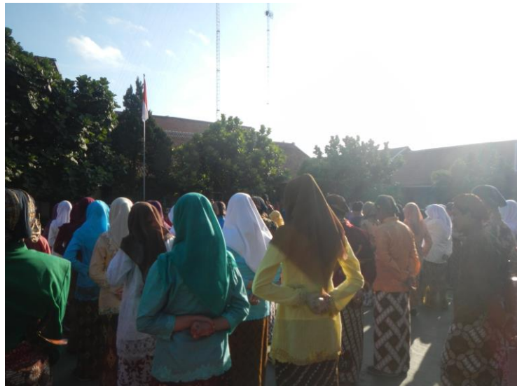
Upacara hari Senin