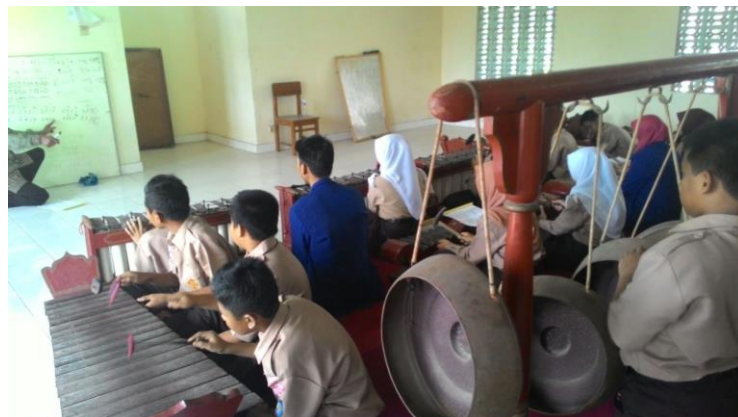
Pendampingan pengembangan diri seni karawitan