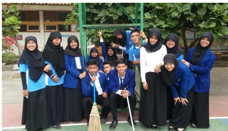
Lomba peringatan HUT RI ke 70