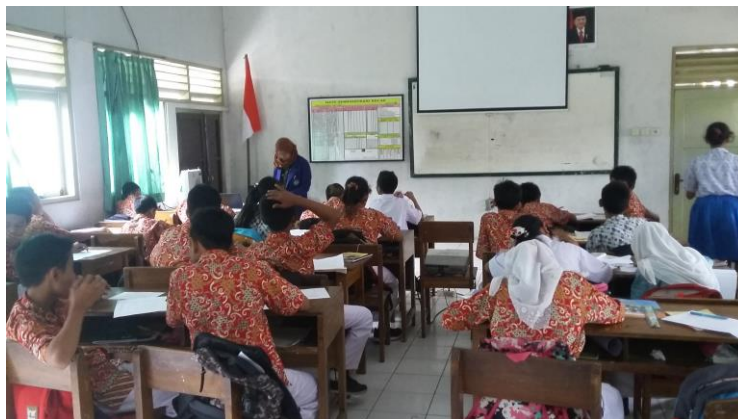
Pelaksanaan praktik mengajar di kelas