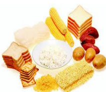
b. m a k a n a n p o k o k