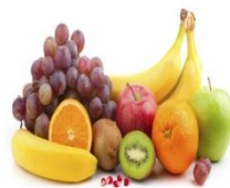
c. b u a h