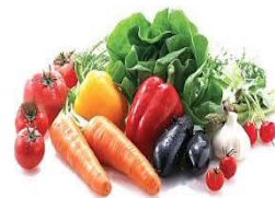
d. S a y u r