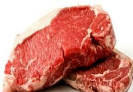
e. D a g i n g