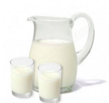
a. s u s u