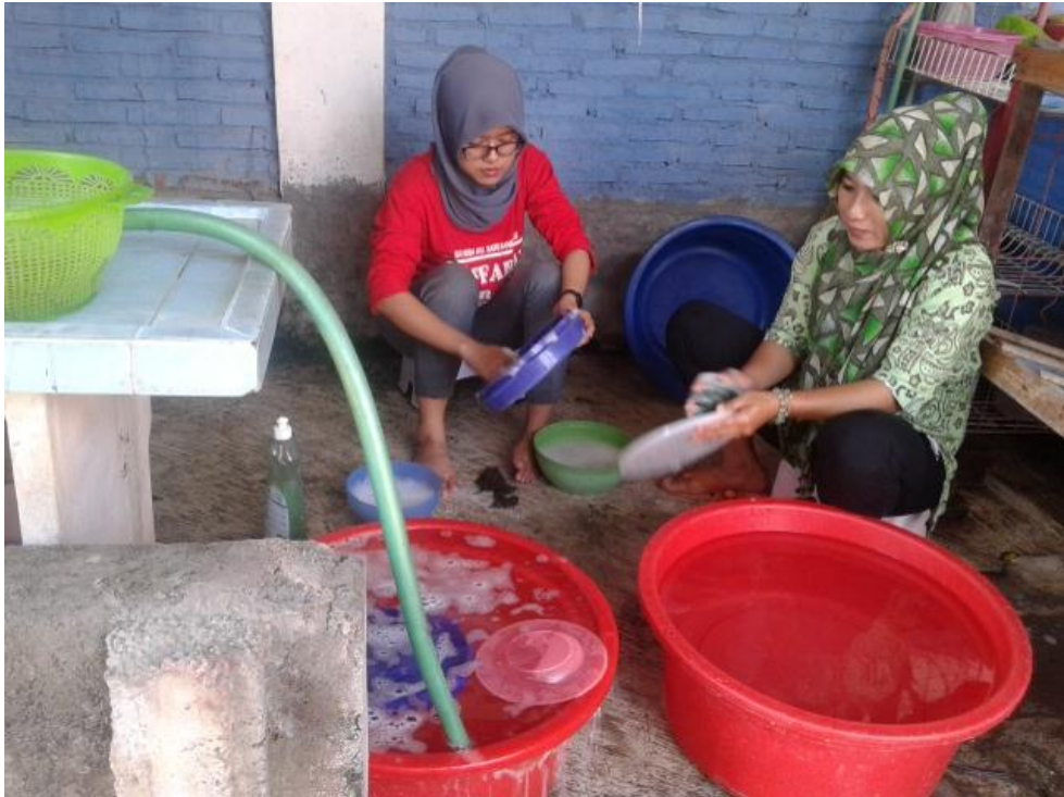
Mahasiswa saat piket mencuci