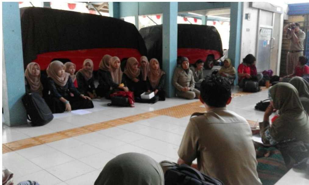
Mahasiswa PPL dan guru saat rapat rutin