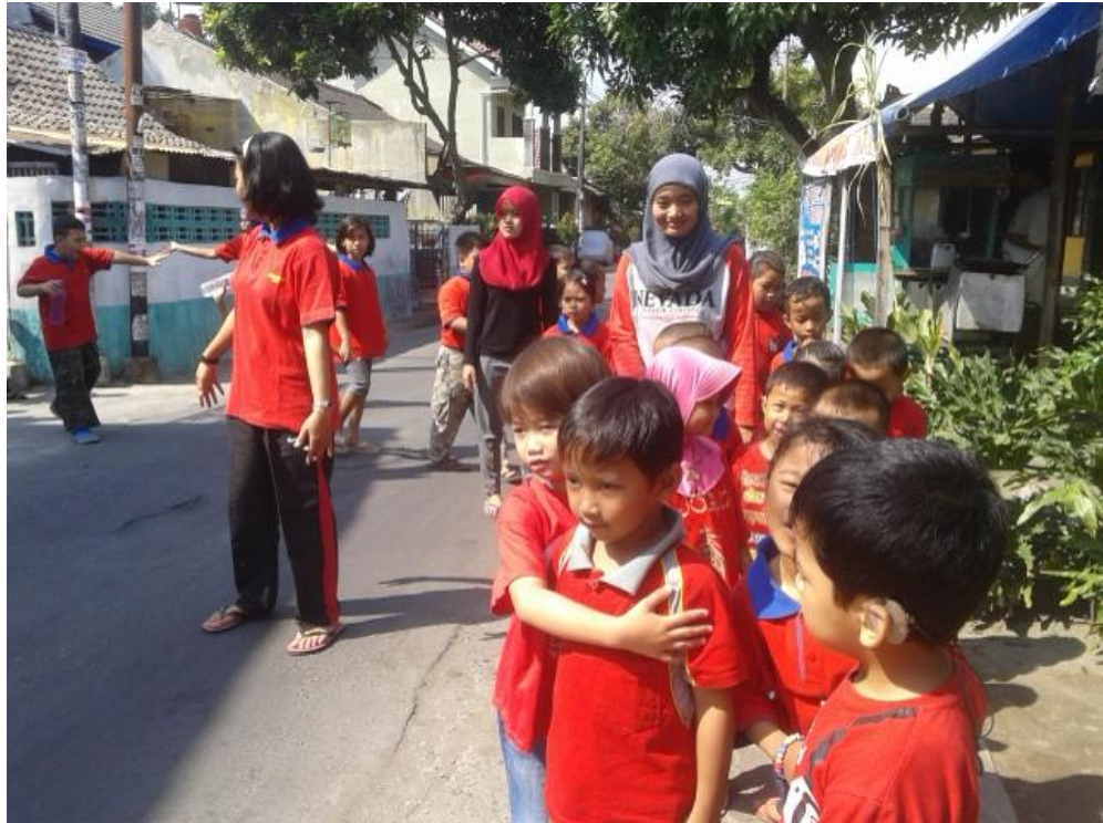
Mahasiswa mendampingi jalan sehat