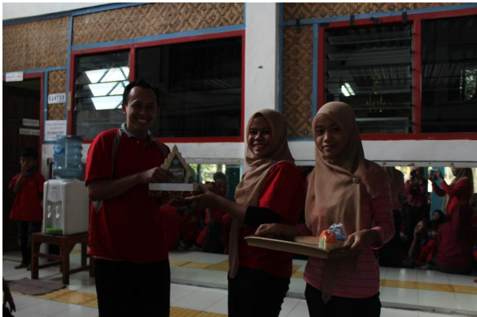
Mahasiswa saat memberikan kenang-kenangan untuk sekolah