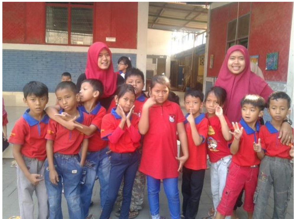
Mahasiswa mendampingi pembelajaran sumber belajar (lingkungan sekitar)