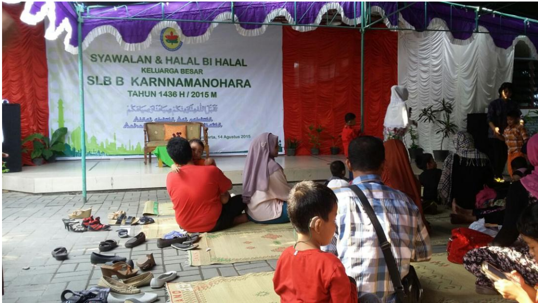
Mahasiswa mengikuti acara halal bi halal keluarga besar SLB B Karnnamanohara