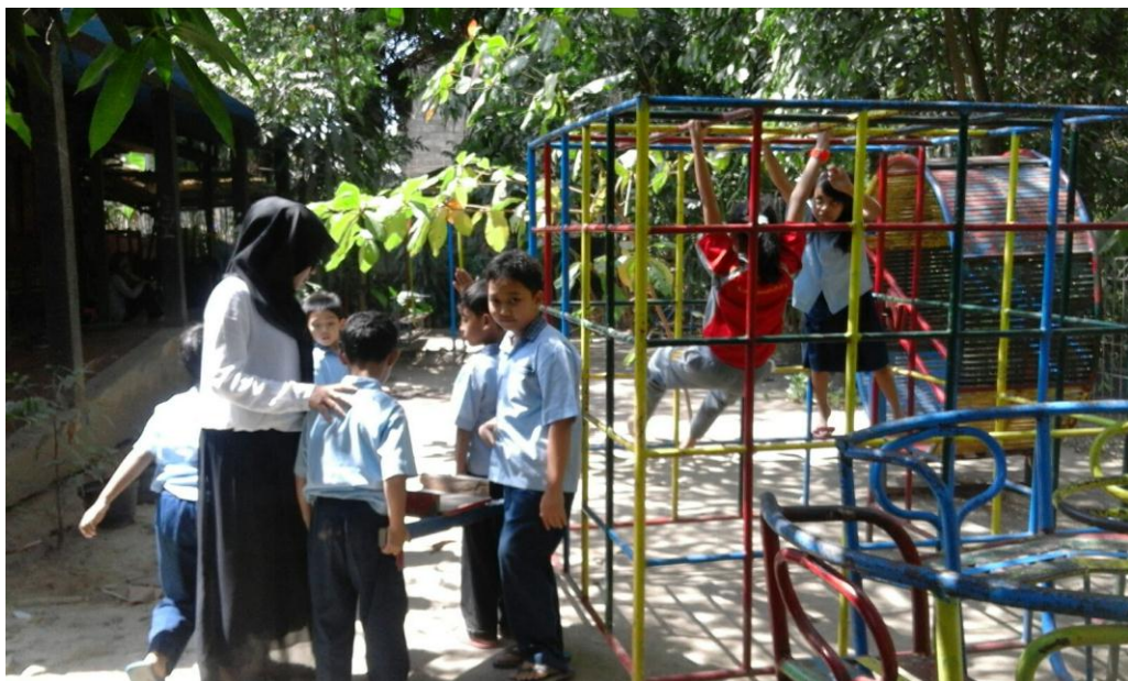
Mahasiswa saat piket menjaga anak pada waktu istirahat