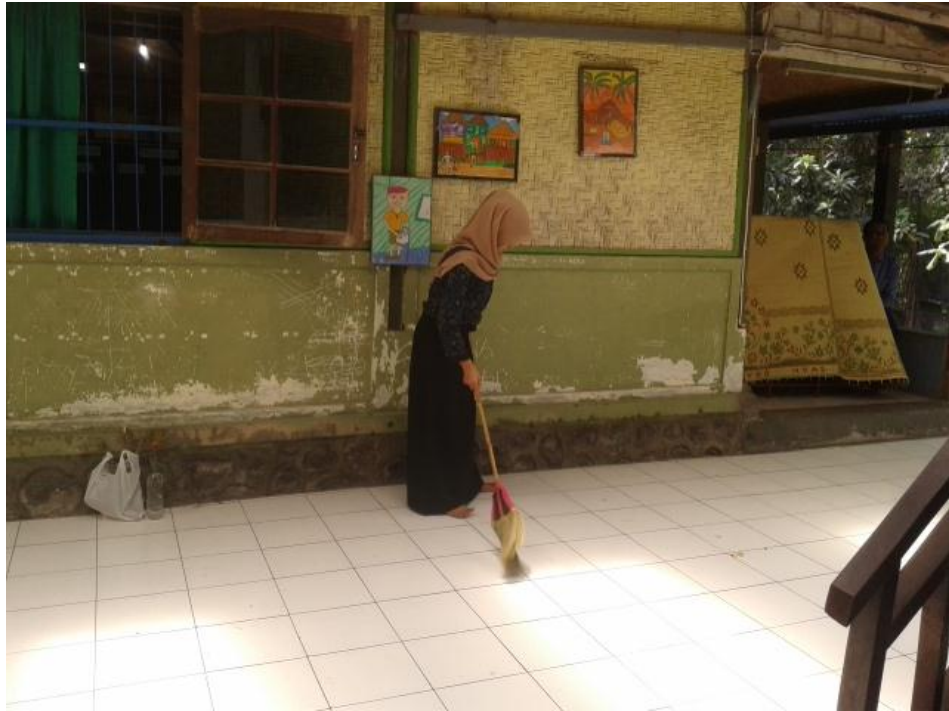
Mahasiswa saat piket menyapu