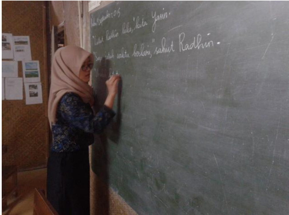
Mahasiswa menulis bacaan di papan tulis