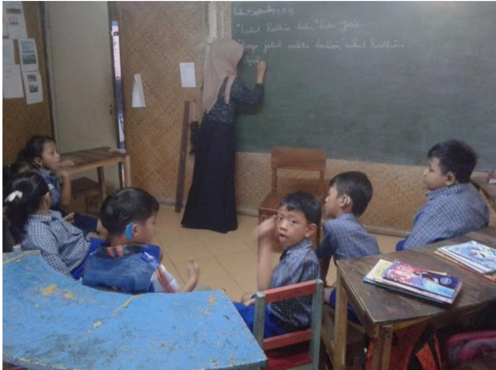
Mahasiswa menulis hasil percakapan dari siswa