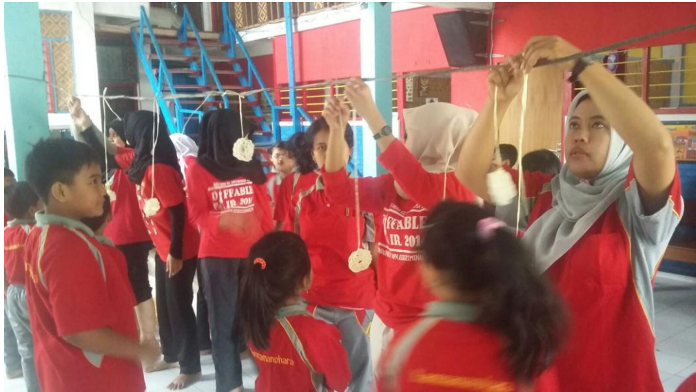
Mahasiswa saat mendampingi kegiatan lomba makan kerupuk