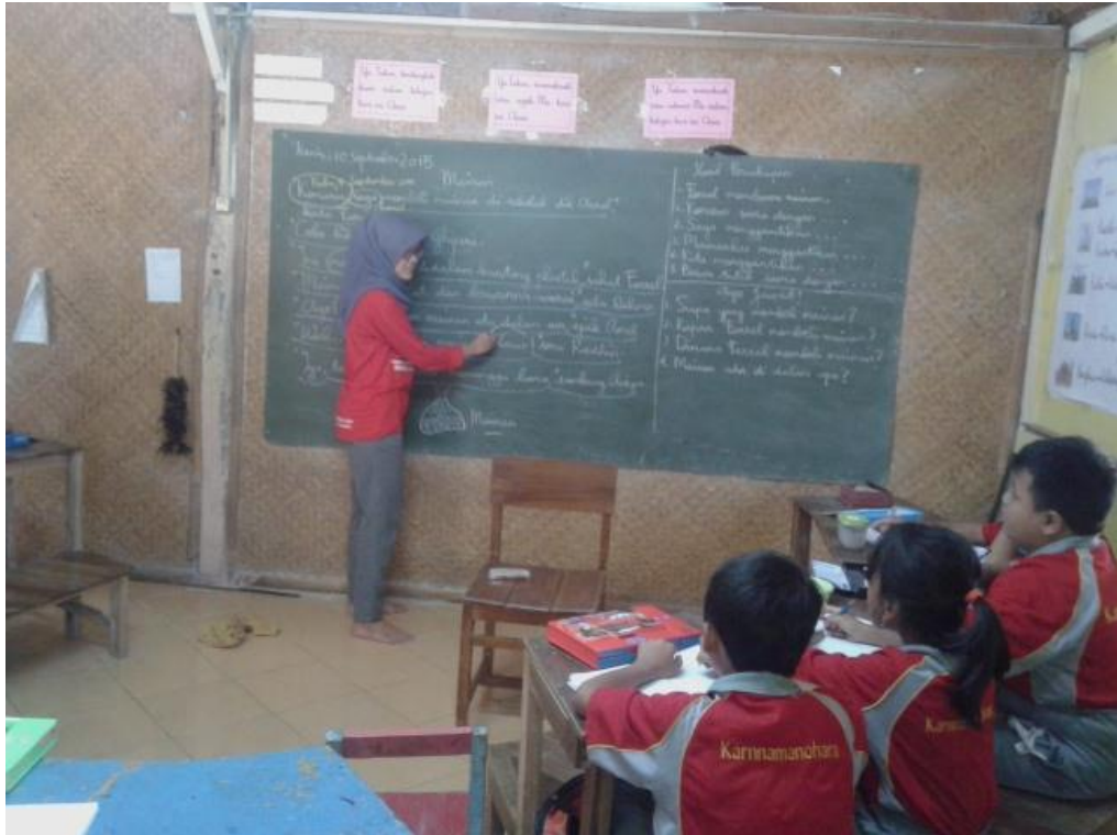
Mahasiswa memilih kata dari bacaan untuk dijadikan refleksi