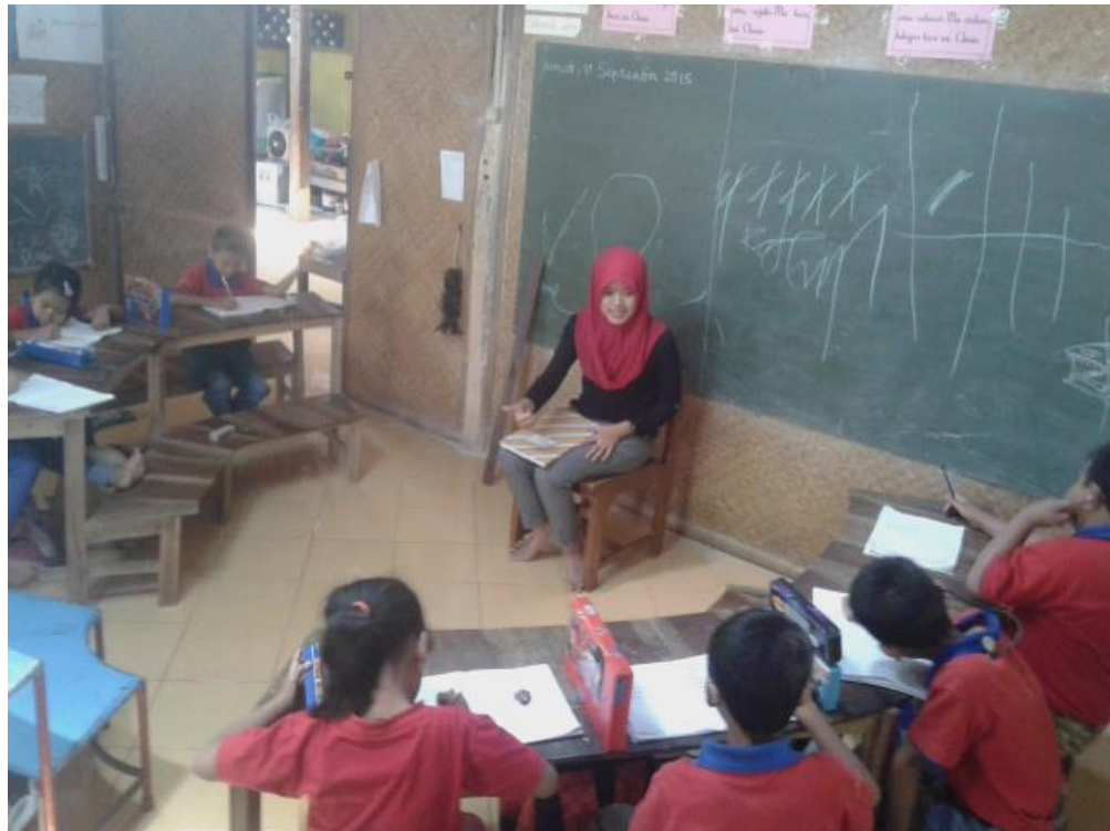
Mahasiswa saat mengajar bahasa (dikte)