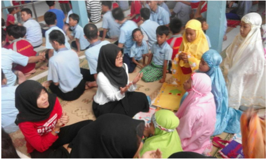
Mahasiswa saat piket mendampingi sholat