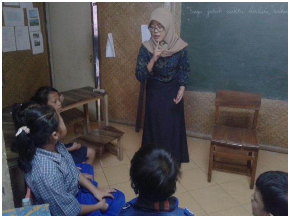
Mahasiswa membetulkan siswa yang pengucapannya salah