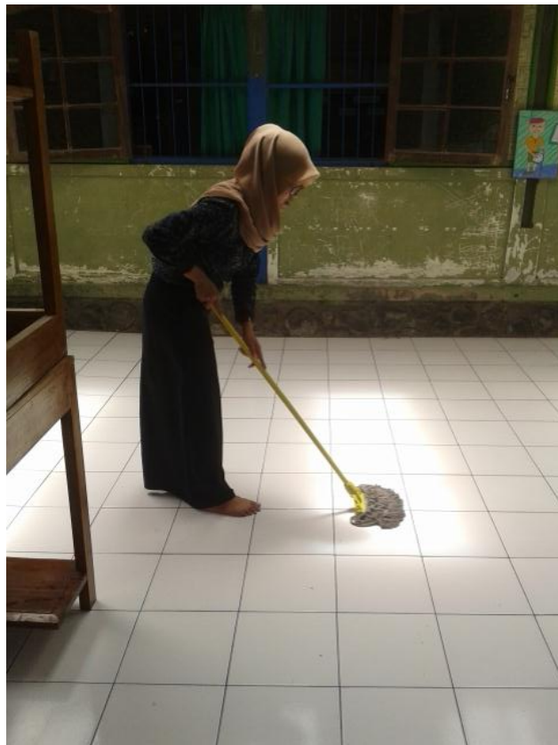
Mahasiswa saat piket mengepel