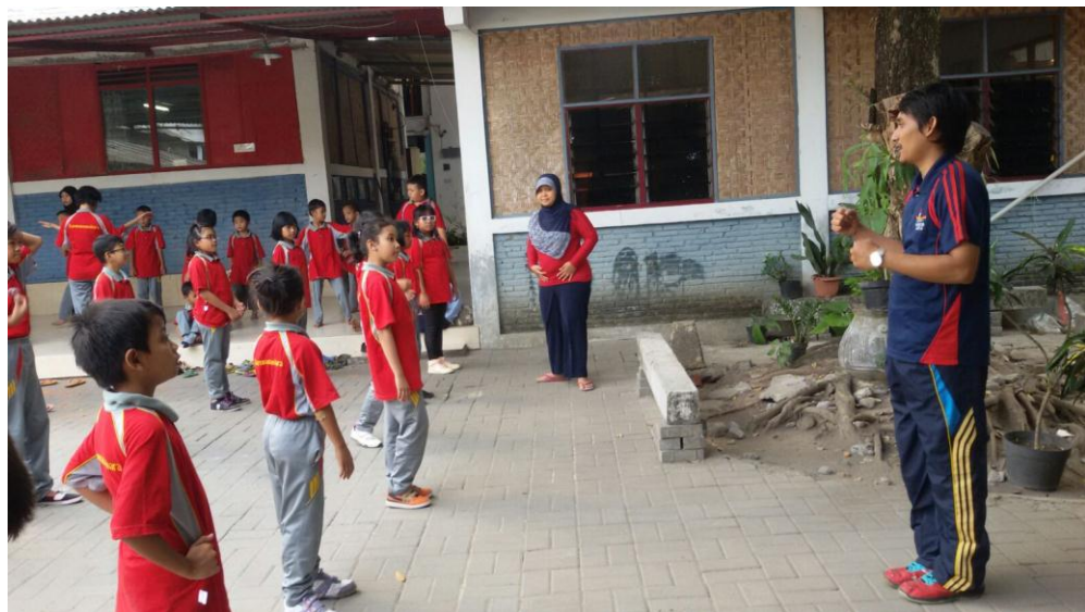
Mahasiswa mendampingi siswa saat kegiatan olahraga