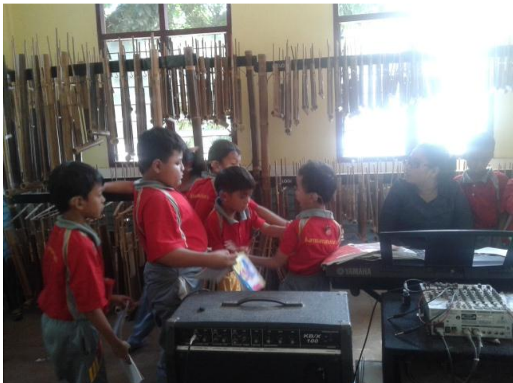
Mahasiswa mendampingi siswa saat pembelajaran BKPBI