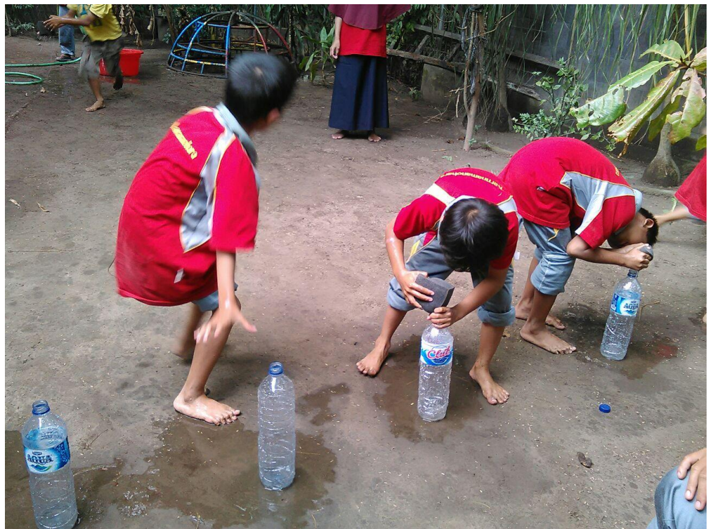
Mahasiswa saat mendampingi kegiatan lomba memasukkan air dalam botol