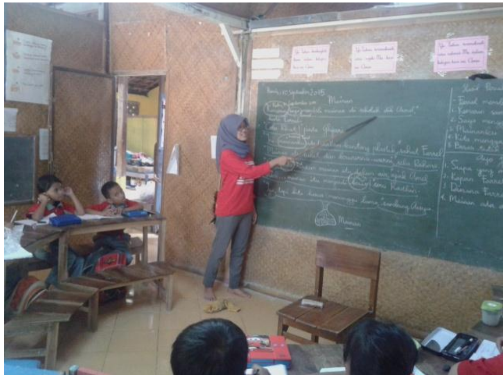
Mahasiswa membimbing siswa membaca