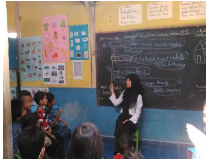
Gambar.02 Praktikan sedang mengajar