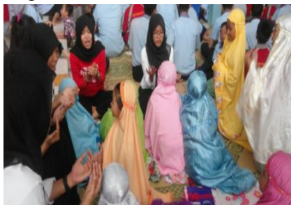
Gambar 07. Piket sholat