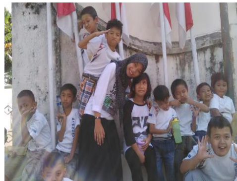
Gambar 06. Kegiatan jalan sehat