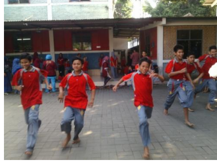
Gambar 10. Lomba pecah air