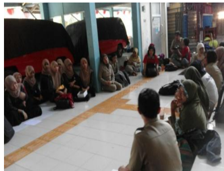
Gambar 12. Rapat guru di ahri rabu