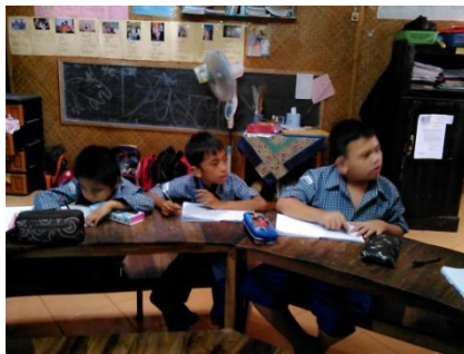
Gambar 03. Siswa menyalin tulisan