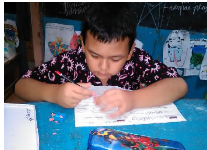
Gambar 04. Subjek sedang menulis