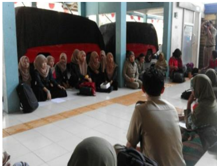
Gambar 11. Rapat guru di hari rabu