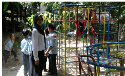
Gambar 08. Piket Istirahat