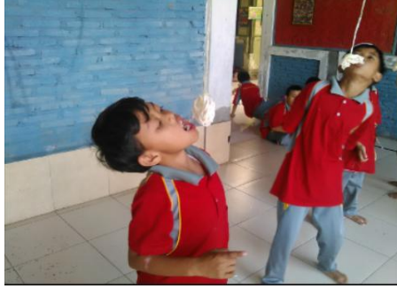
Gambar 09. Lomba Makan kerupuk