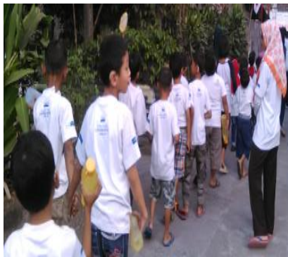
Gambar 05. Kegiatan jalan sehat