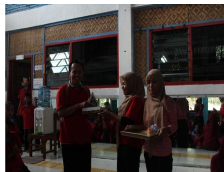
Gambar 14. Penyerahan plakat