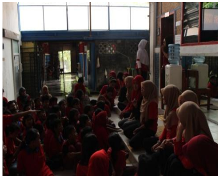
Gambar 13. Perpisahan PPL UNY