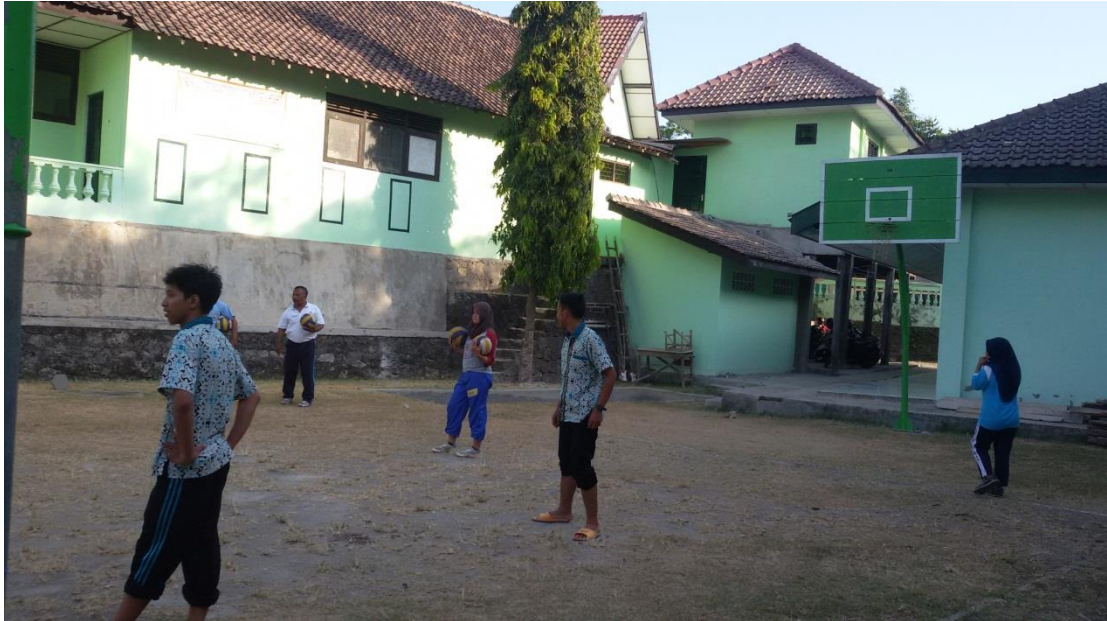
Pendampingan Ekskul Voli