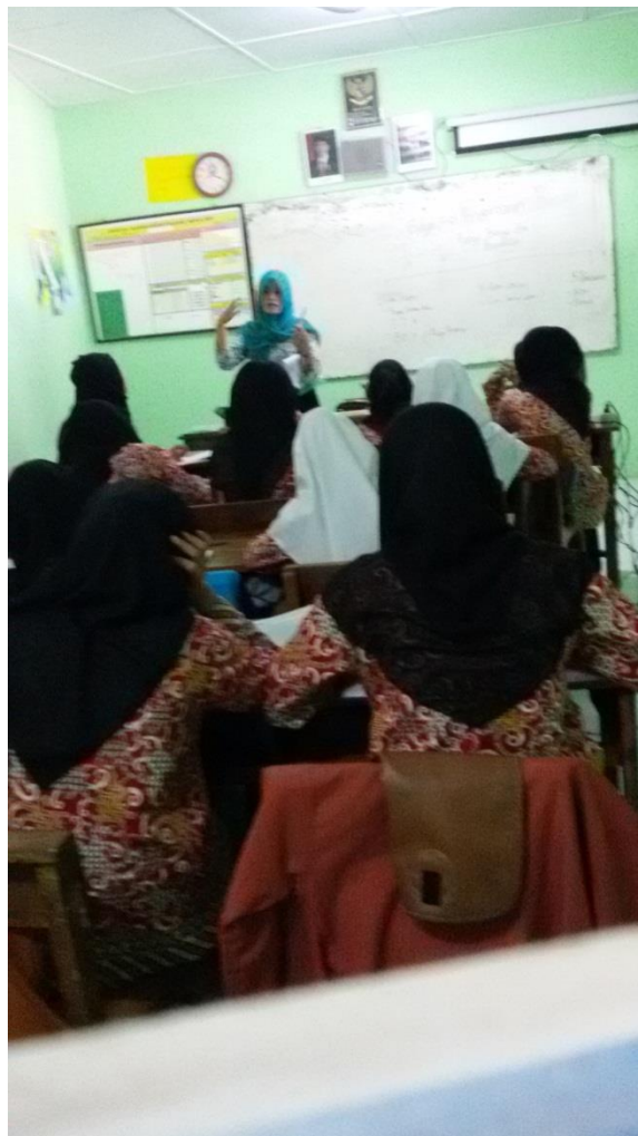
Mengajar Insidental di Kelas XI AK 3