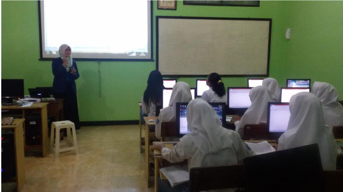
Mengajar Komputer Akuntansi di Kelas XI AK 2