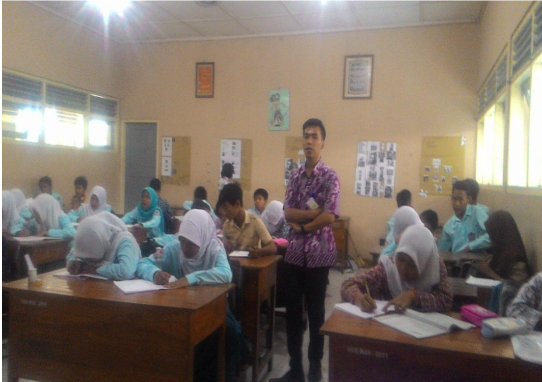
6. Gambar setelah kegiatan pembelajaran