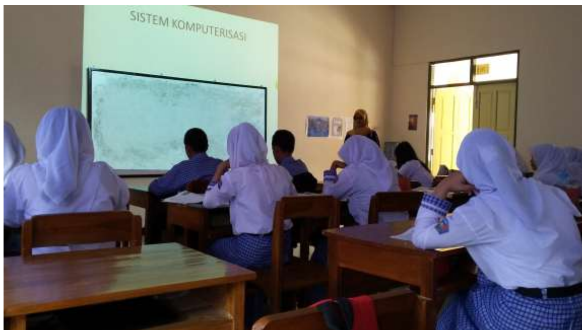
Gambar 1. Saat menjelaskan materi