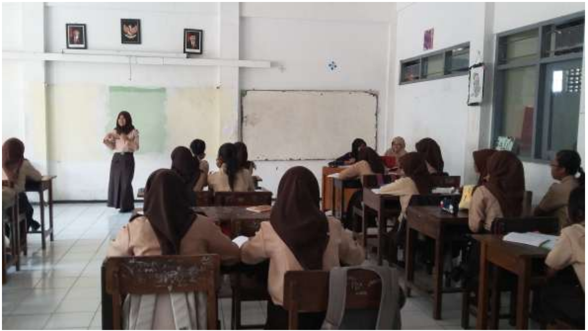
Gambar 3. Siswa mempresentasikan hasil diskusi