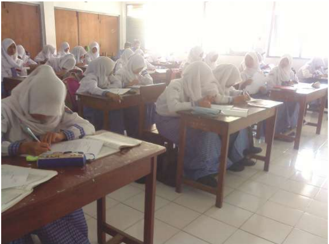
Gambar 4. Siswa mengerjakan tugas