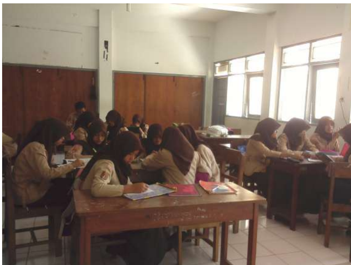
Gambar 2. Saat siswa sedang melaksanakan diskusi JIGSAW