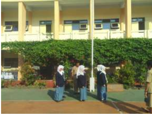
Gambar 1. Mendampingi guru piket