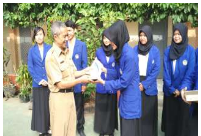
Gambar 6. Saat penyerahan kenang-kenangan