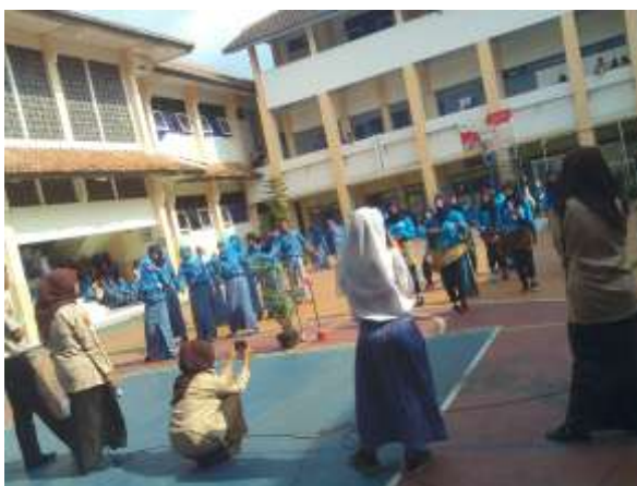
Gambar 5. Saat perpisahan