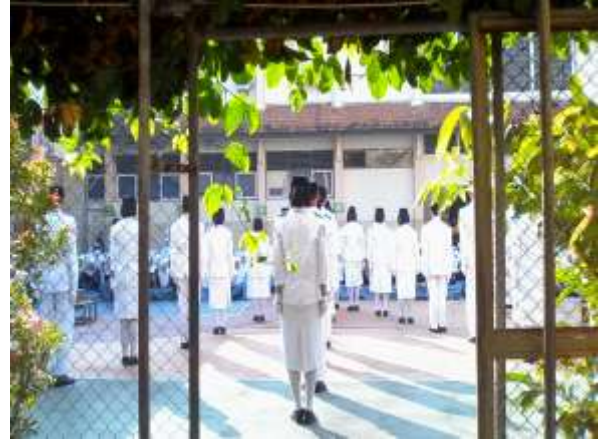
Gambar 2. Mengikuti upacara