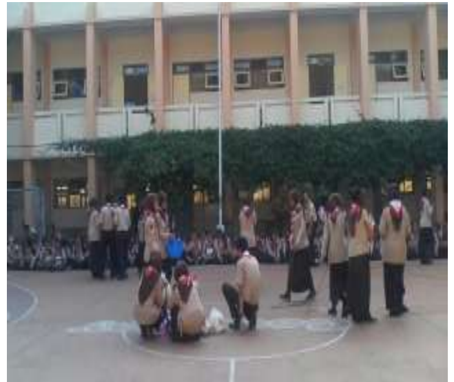
Gambar 4. Mendampingi kegiatan PTA