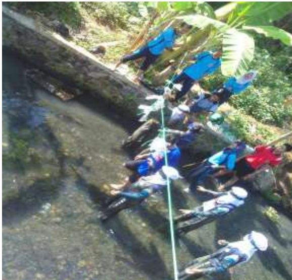
Gambar 3. Mendampingi LDK OSIS