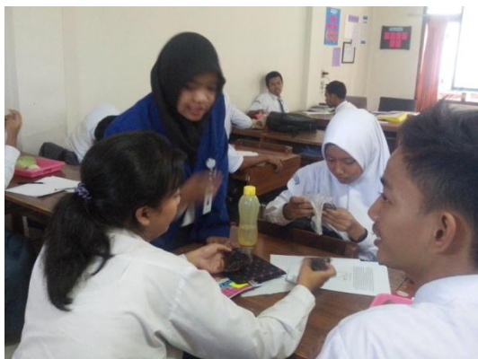
Gb 5. Mahasiswa Memantau Diskusi Siswa