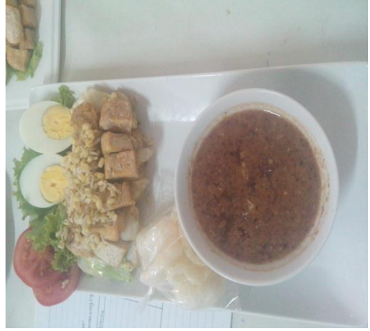
Gb 14. Kupat Tahu