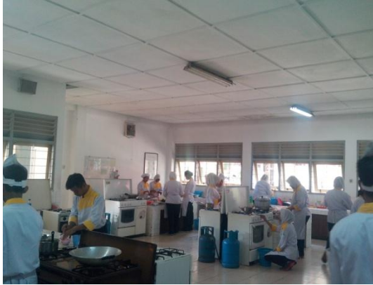
Gb 7. Kegiatan Kelas Praktik