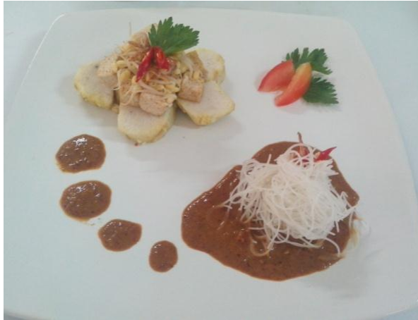
Gb 19. Ketoprak