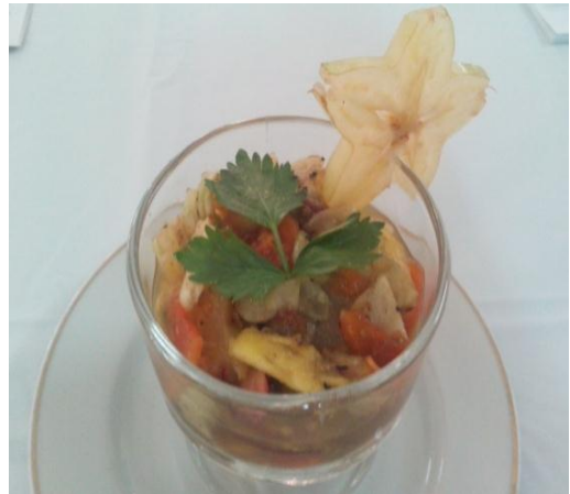
Gb 16. Rujak Ulek