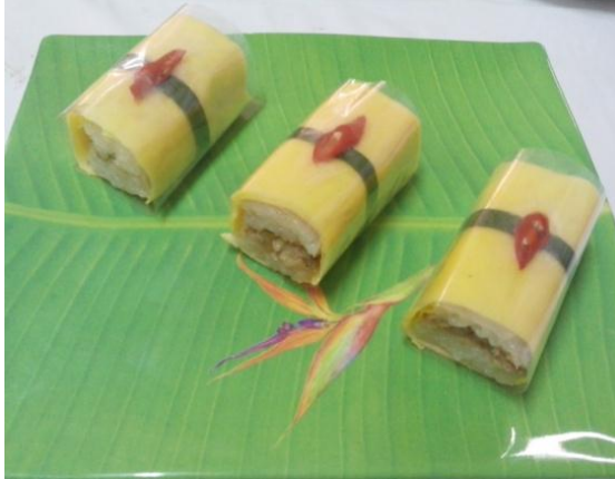
Gb 25. Semar Mendem