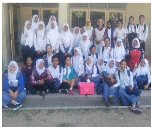
Gb 30. Foto Bersama XI Boga4