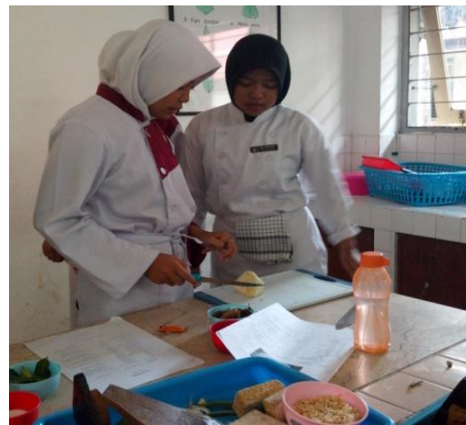
Gb 12. Mahasiswa Mengecek Kinerja Siswa