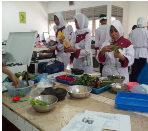
Gb 10. Siswa Bekerja