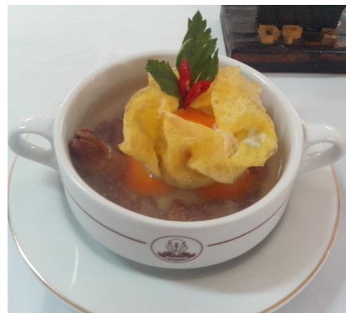
Gb 22. Sup Kembang Waru