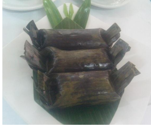
Gb 26. Arem-Arem