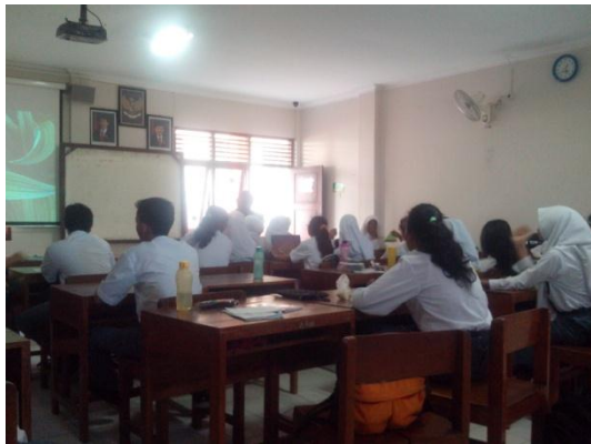
Gb 3. Pembelajaran Kelas X Boga4