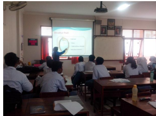
Gb 4. Mahasiswa Menjelaskan Materi