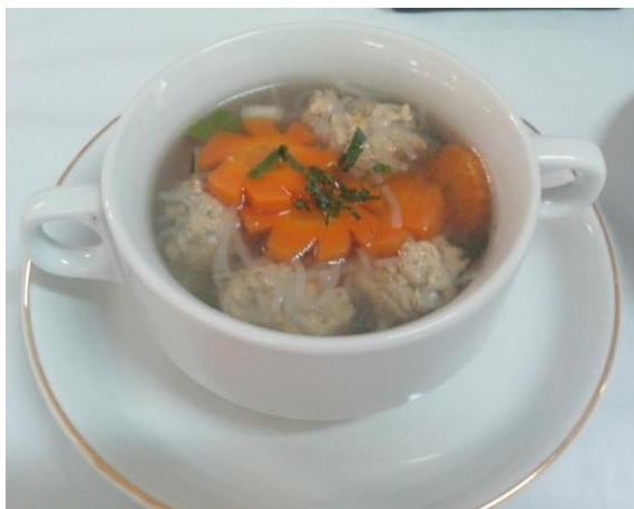
Gb 21. Sup Bakso Rambutan