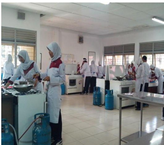
Gb 11. Siswa Mengolah Masakan