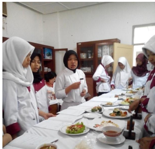
Gb 28. Mahasiswa Mengevaluasi Hasil Praktik Siswa