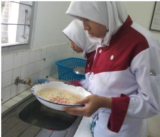
Gb 9. Siswa Melakukan Pencucian Bahan