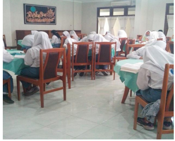
Gb 2. Pembelajaran Dikelas