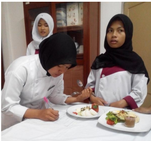
Gb 27. Mahasiswa Menilai Karya Siswa