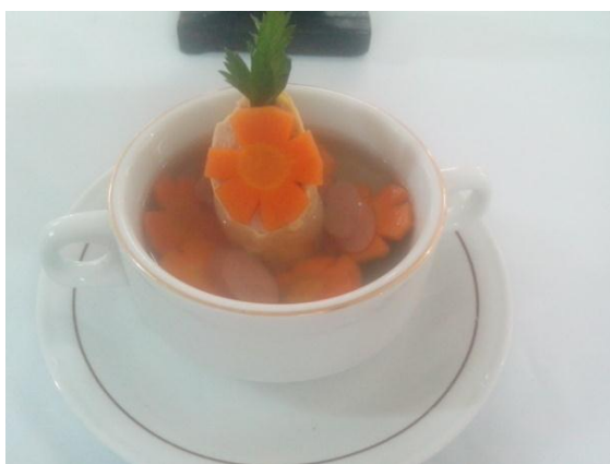
Gb 23. Sup Rollade