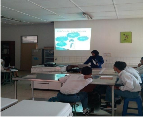
Gb 1. Proses Belajar Dikelas