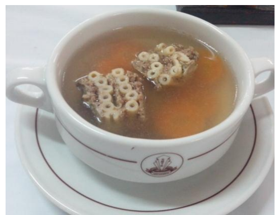
Gb 24. Sup Sarang Tawon