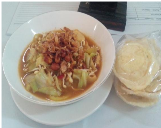
Gb 17. Asinan Jakarta