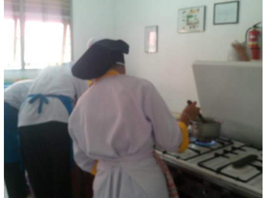
Gb 8. Siswa Membuat Saus Gado-Gado