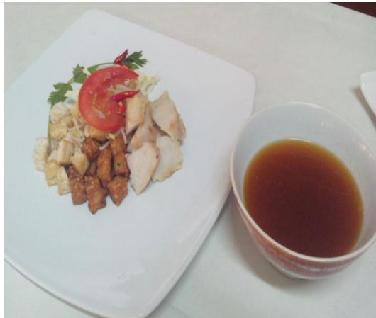
Gb 15. Tahu Guling