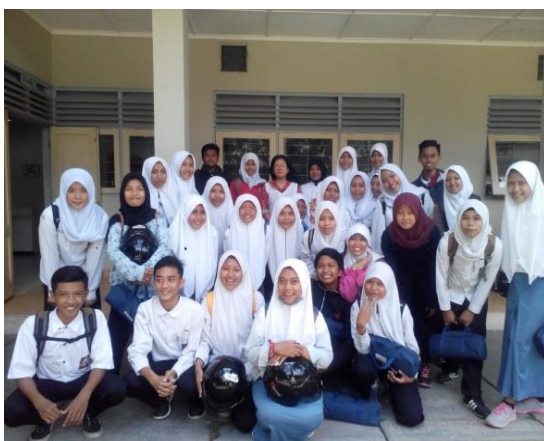
Gb 29. Foto Bersama XI Boga3