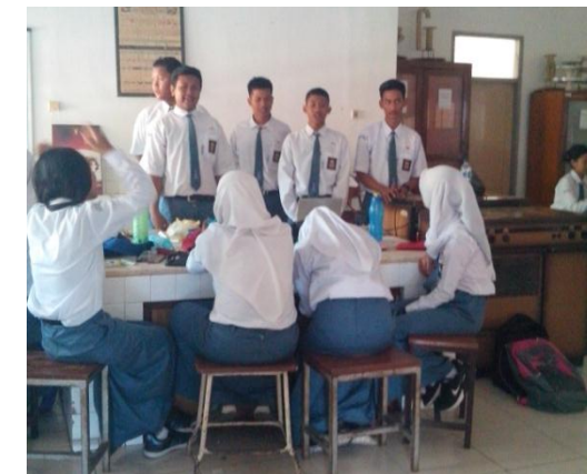
Gb 6. Presentasi Hasil Diskusi Siswa