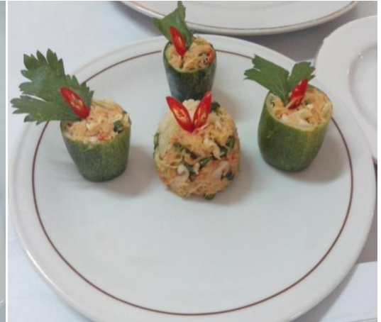
Gb 20. Terancam