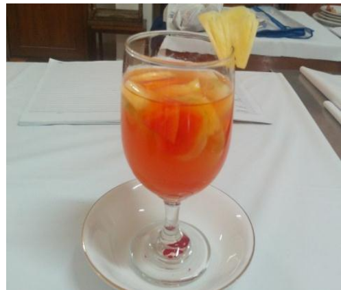
Gb 18. Asinan Buah