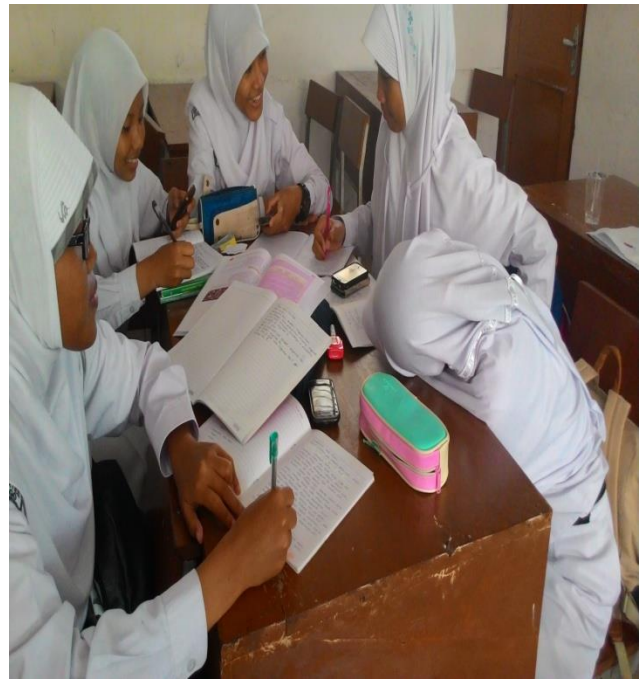
(Gambar siswa berdiskusi kelompok diambil pada 24 Agustus 2015 dengan kamera hp)