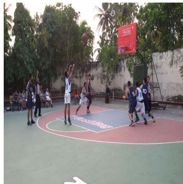
(Gambar siswa dalam pertandingan basket, diambil pada 20 Agustus 2015)