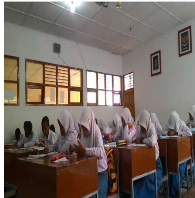
Gambar siswa sebelah kiri mengerjakan media jodoh sosiologi, sebelah kanan siswa sedang ujian)