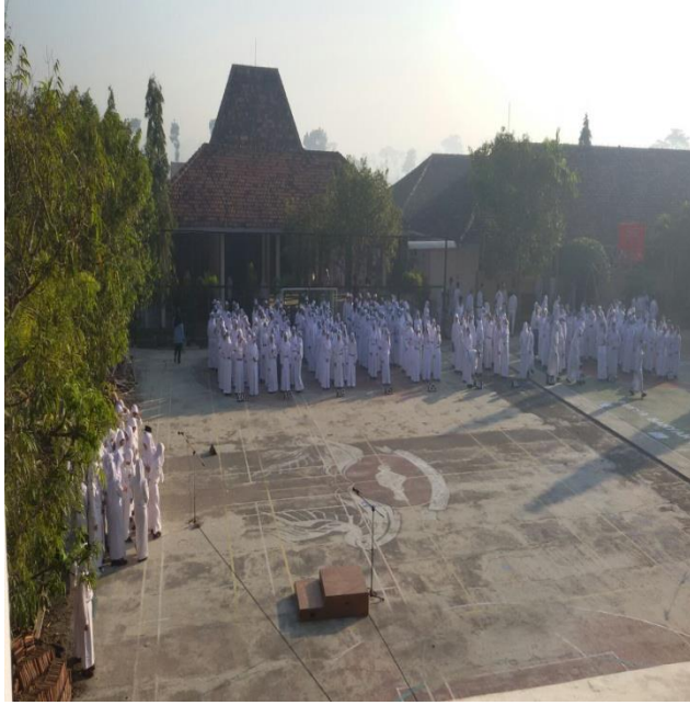
Gambar upacara hari Senin. anak- anak.