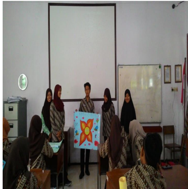
(Gambar siswa presentasi main mapping konflik sosial, diambil pada 05 September 2015)