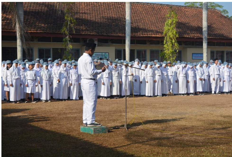
Gambar 07. Upacara bendera pada tanggal 24 Agustus 2015.