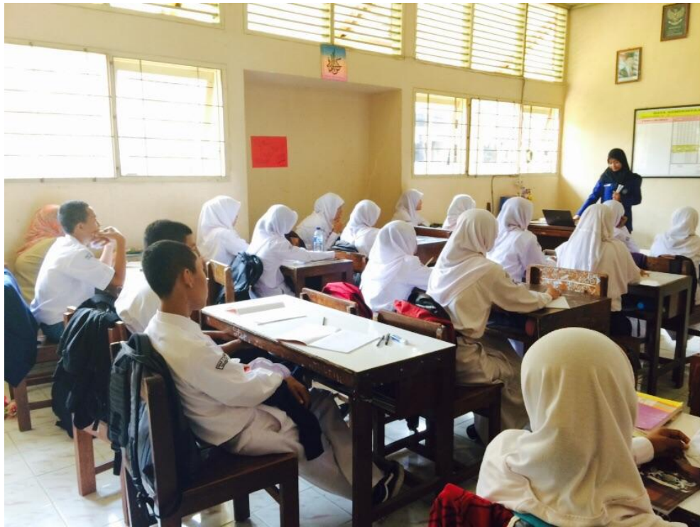
Gambar 03. Mengajar di kelas X4 didampingi oleh guru pembimbing pada tanggal 10 Agustus 2015.