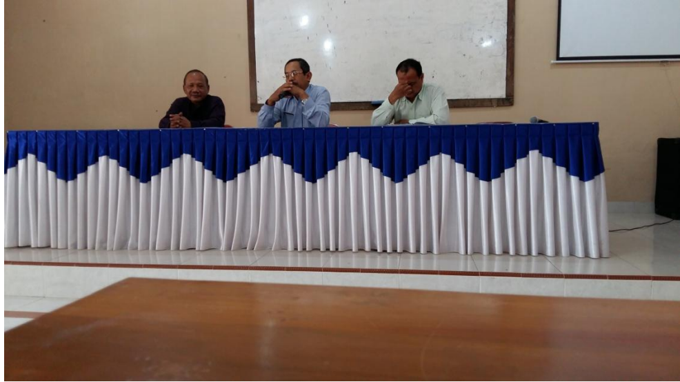
Gambar 19. Penarikan PPL UNY 2015 pada tanggal 12 September 2015.