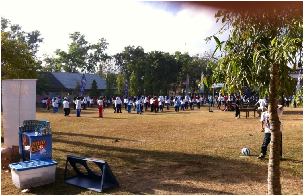
Gambar 11. Pelaksanaan Senam Sehat di lapangan sekolah pada tanggal 30 Agustus 2015