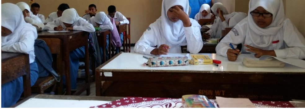
Gambar 13. Pelaksanaan ulangan harian di kelas X4 pada tanggal 31 Agustus 2015.