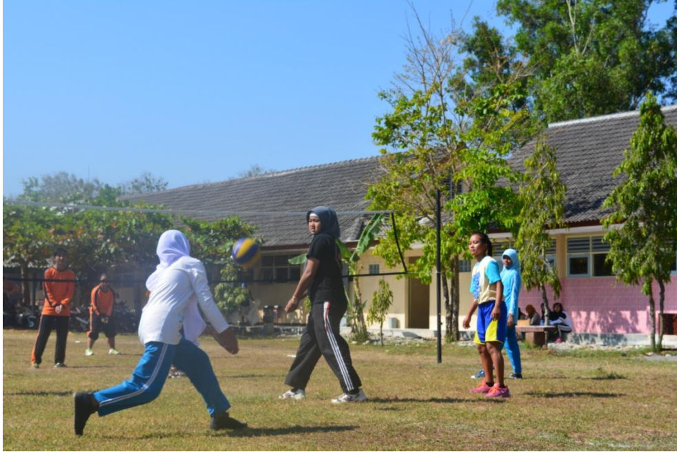
Gambar 15. Perlombaan memperingati HUT SMA N 1 Pengasih ke-24 pada tanggal 5 September 2015.