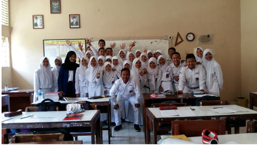
Gambar 17. Bersama siswa-siswi kelas X4 pada tanggal 7 September 2015.