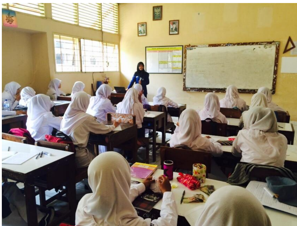
Gambar 08. Mengajar di kelas X4 pada tanggal 24 Agustus 2015.