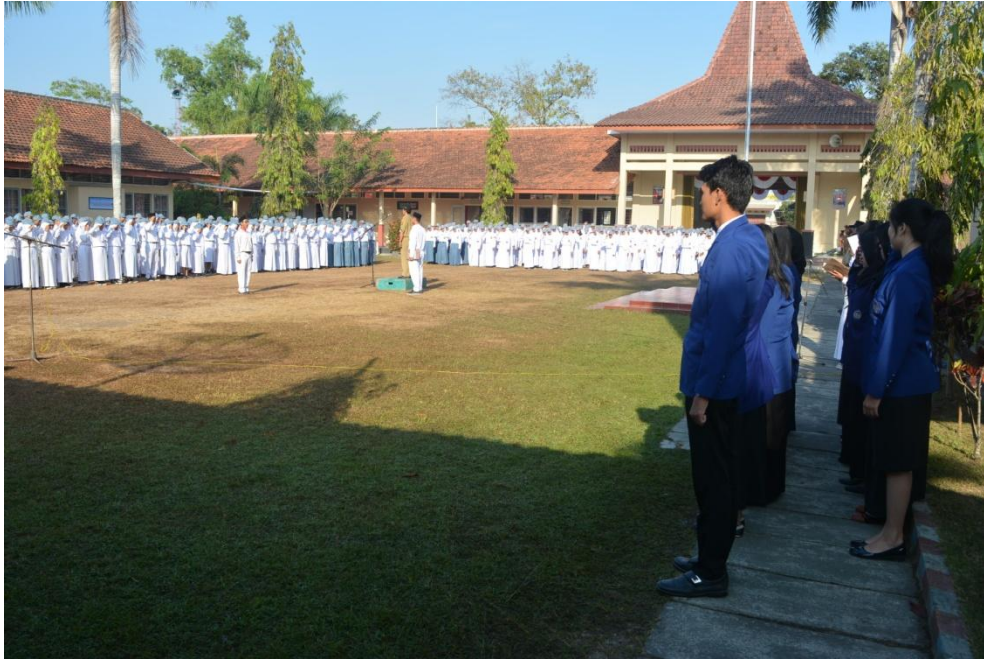
Gambar 01. Upacara bendera pada tanggal 10 Agustus 2015.