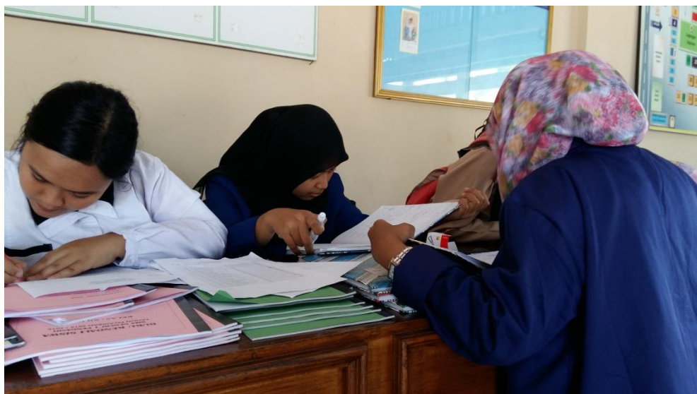
Gambar 04. Piket jaga di hall SMA N 1 Pengasih pada tanggal 11 Agustus 2015