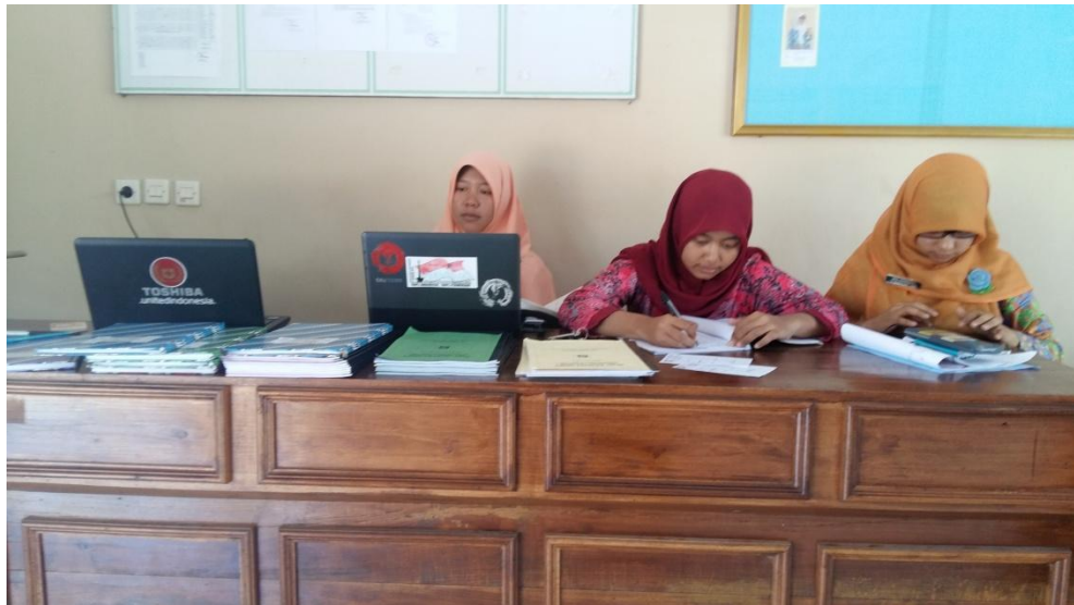
Gambar 10. Piket jaga pada tanggal 29 Agustus 2015.