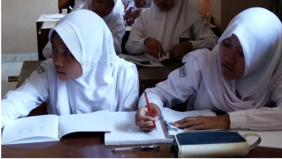
Gambar 05. Peserta didik di kelas X3 mengerjakan tugas latihan di buku Studio D A1 pada tanggal 12 Agustus 2015.