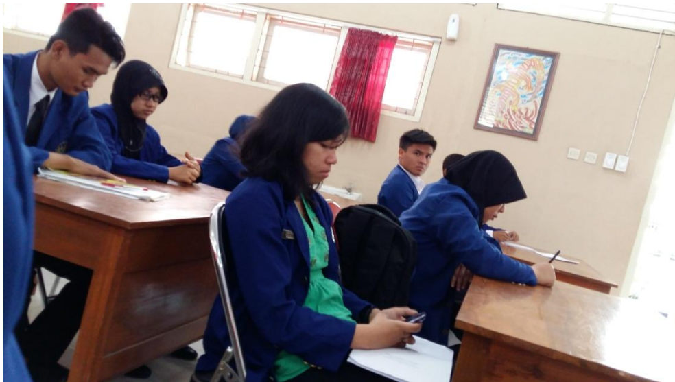
Gambar 02. Penerjunan PPL UNY 2015 di SMA N 1 Pengasih tanggal 10 Agustus 2015.