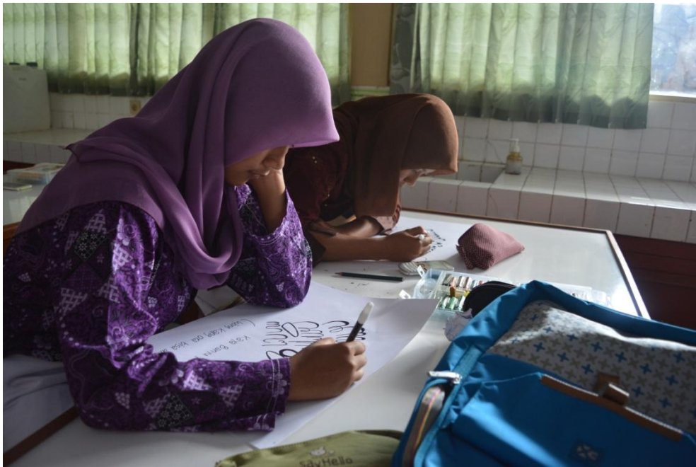
Gambar 16. Perlombaan memperingati HUT SMA N 1 Pengasih ke-24 pada tanggal 5 September 2015.