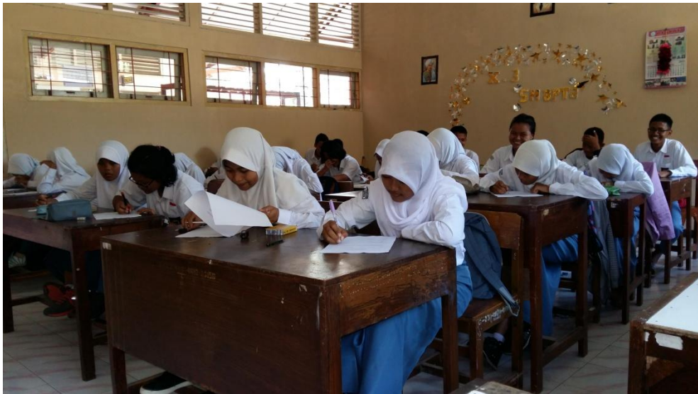
Gambar 14. Pelaksanaan ulangan harian di kelas X3 pada tanggal 2 September 2015.