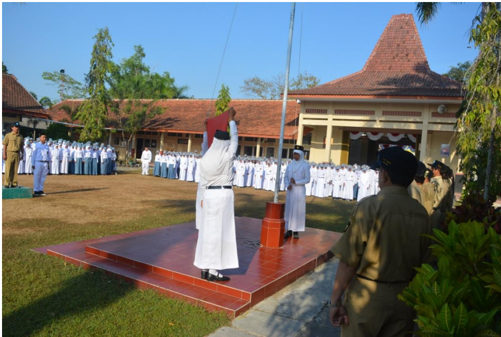
Gambar 06. Upacara Peringatan HUT RI ke-70 pada tanggal 17 Agustus 2015.