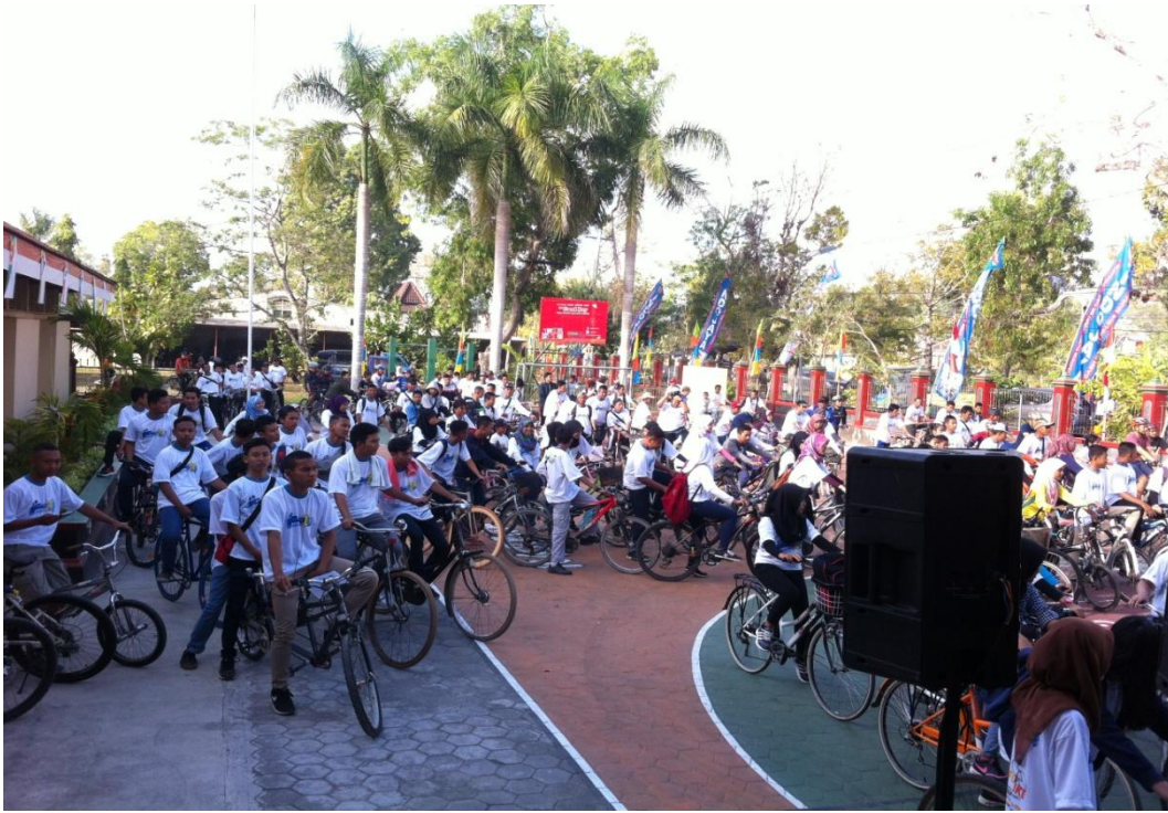
Gambar 10. Pelaksanaan Fun Bike pada tanggal 30 Agustus 2015.