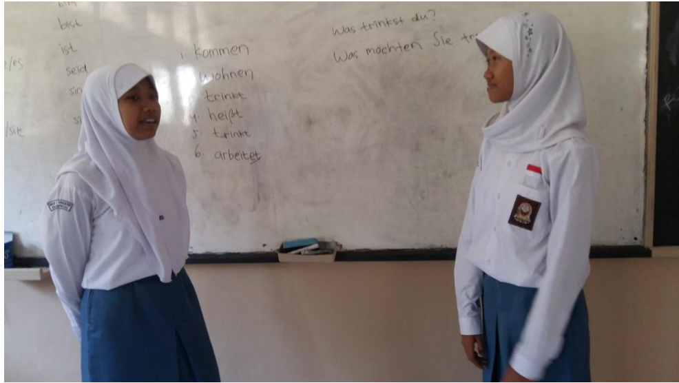
Gambar 09. Mengajar di kelas X3 pada tanggal 26 Agustus 2015. Anak-anak praktik di depan kelas.