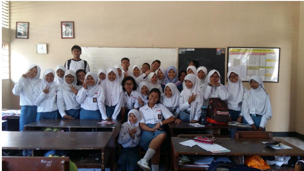
Gambar 18. Bersama siswa-siswi kelas X3 pada tanggal 9 September 2015.