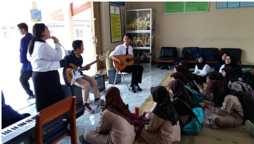
Gambar 20. Perpisahan dengan siswa-siswi SMA N 1 Pengasih pada tanggal 12 September 2015.