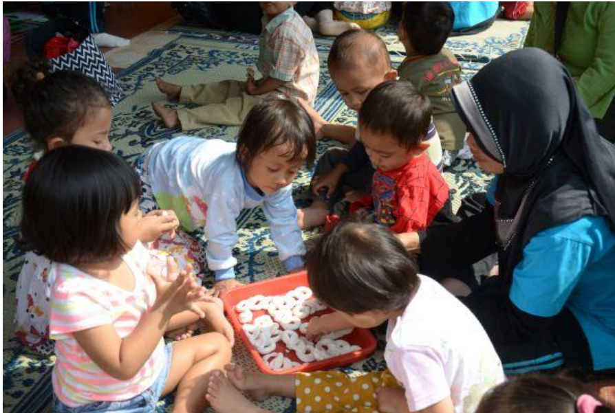
Anak-anak sedang membuat geblek