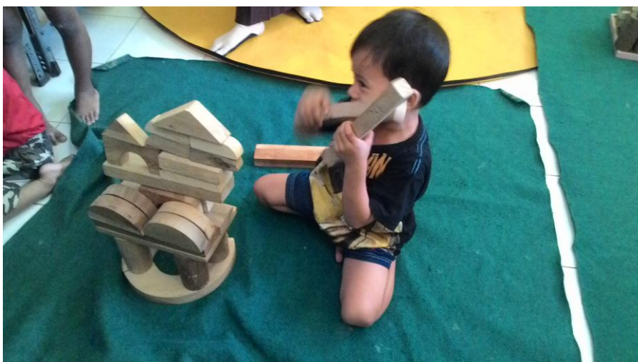
Lomba kreasi balok dalam kegiatan kelas umum