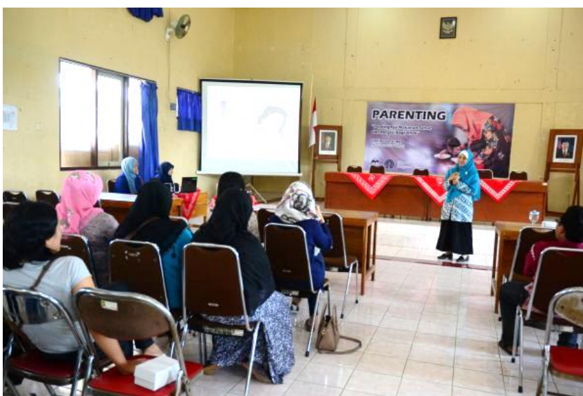
Pemateri sedang menerangkan pentingnya makanan sehat dan bergizi untuk anak