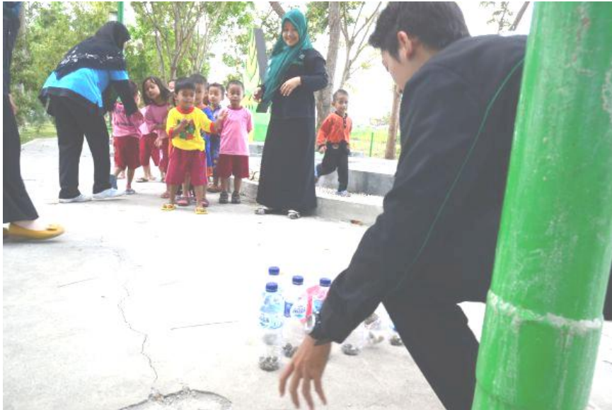
Anak-anak sedang bermain Bowling Botol di tama Binangun