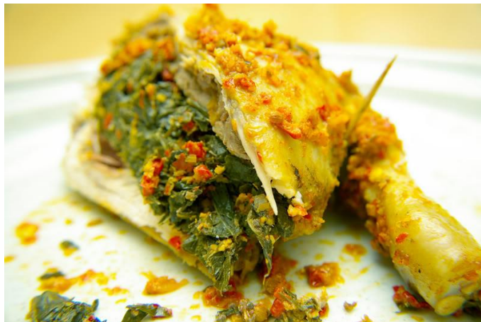
Gambar 1. Ayam Betutu

Ayam Betutu adalah masakan kebanggaan Bali. Biasanya dibuat dari ayam yang dibungkus daun pisang, lalu dibungkus lagi dengan pelepah pinang hingga rapat. Ayam ditanam dalam lubang di tanah dan ditutup dengan bara api selama 6-7 jam sampai matang.