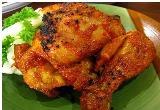
Gambar 2. Ayam Panggang Bumbu Rujak

Ayam Panggang Bumbu Rujak adalah ayam yang dimasak menggunakan bawang merah, bawang putih, cabai rawit, cabai merah, gula jawa, garam yang kemudian dibakar.