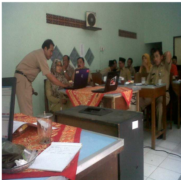
Gambar 13. Sosialisasi Dapodik SPM NISN dan LI