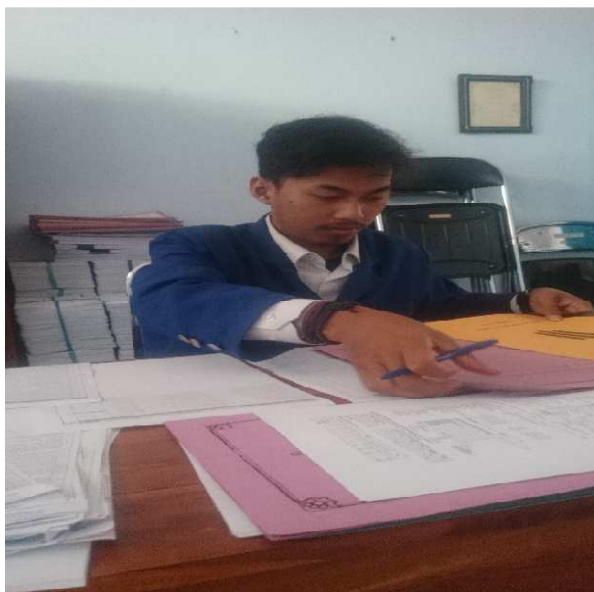
Gambar 14. Pengecekan data SPM dan LI