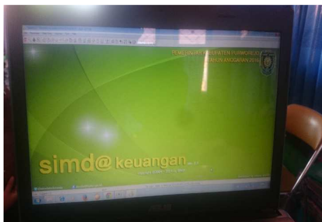
Gambar 17. Contoh tampilan aplikasi SIMDA Keuangan