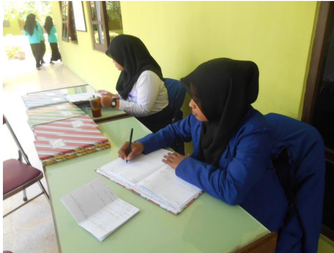
Gambar 12. Jaga piket harian guru