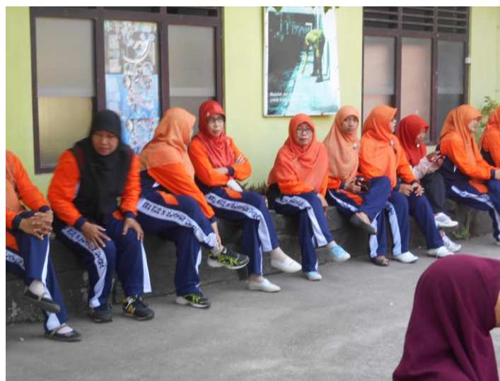
Gambar 14. Persiapan Jalan Sehat (HAORNAS)