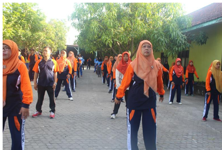
Gambar 4.Senam Sehat bersama guru