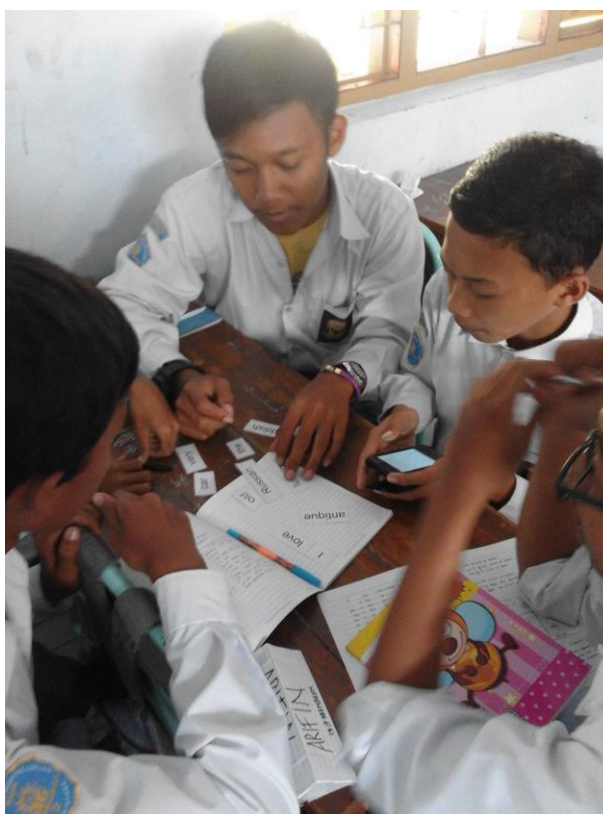
Gambar 2.Game dengan materi describing thing