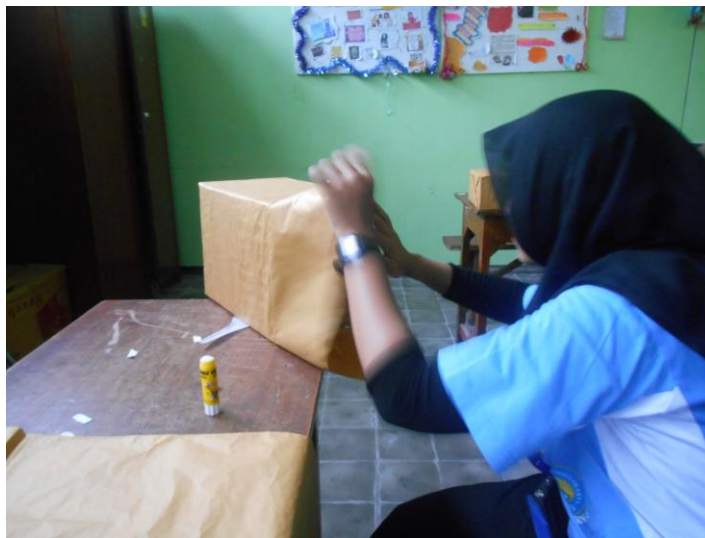
Gambar 10. Membungkus hadiah lomba