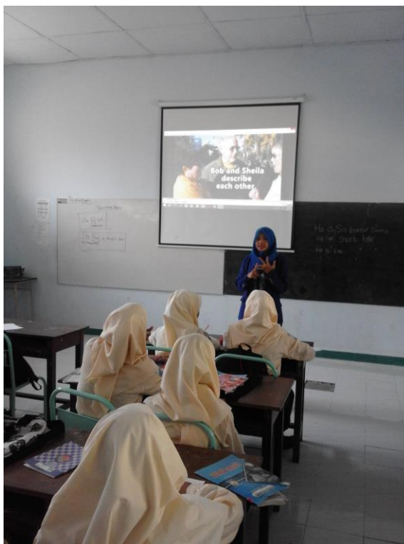
Gambar 1.KBM di kelas X MM 1