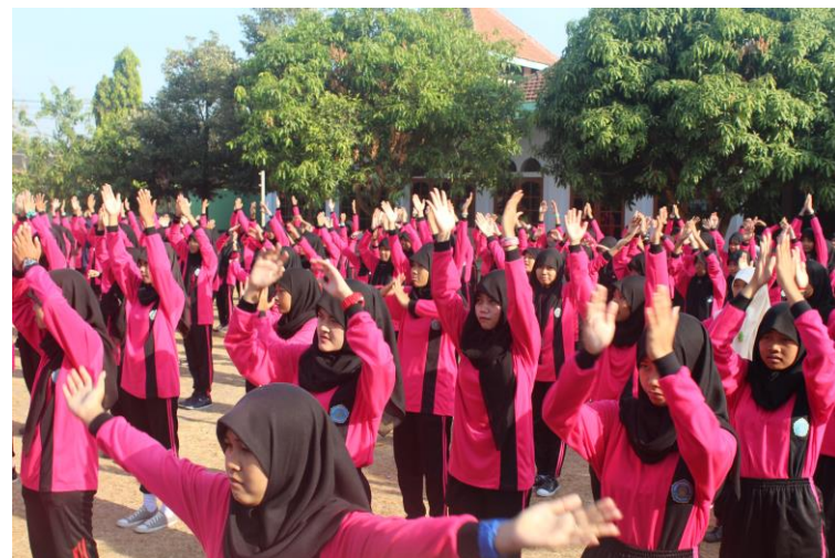
Gambar 5.Senam Sehat bersama siswa