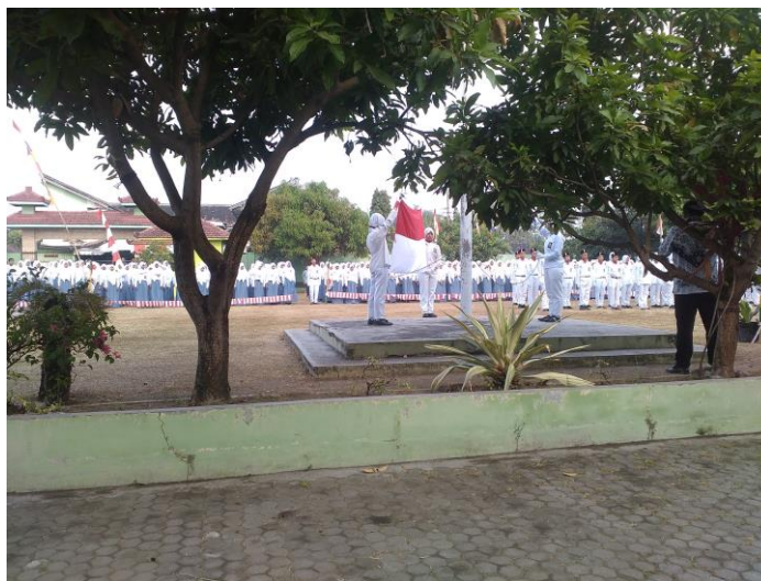
Gambar 11. Upacara Bendera HUT RI 70