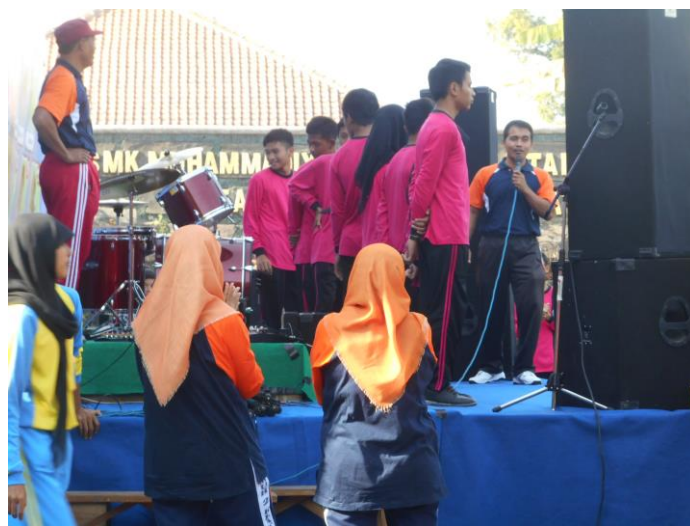
Gambar 13. Pemilihan ketua IPM baru