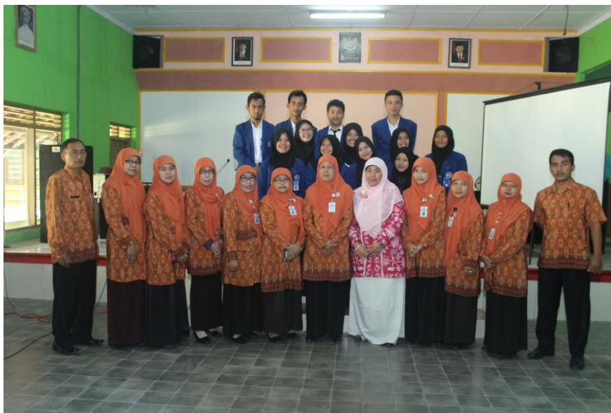
Gambar 16. Foto bersama setelah penarikan