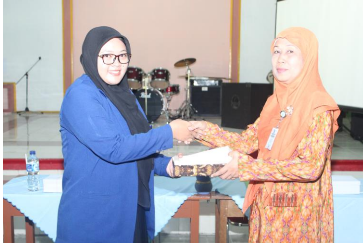
Gambar 15. Penyerahan Kenang-kenangan (Penarikan PPL UNY)