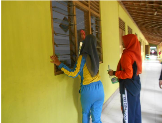
Gambar 9. Mendampingi Lomba Peringatan HUT RI 70