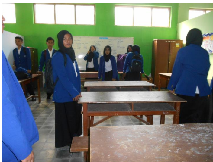
Gambar 7. Membersihkan Posko PPL