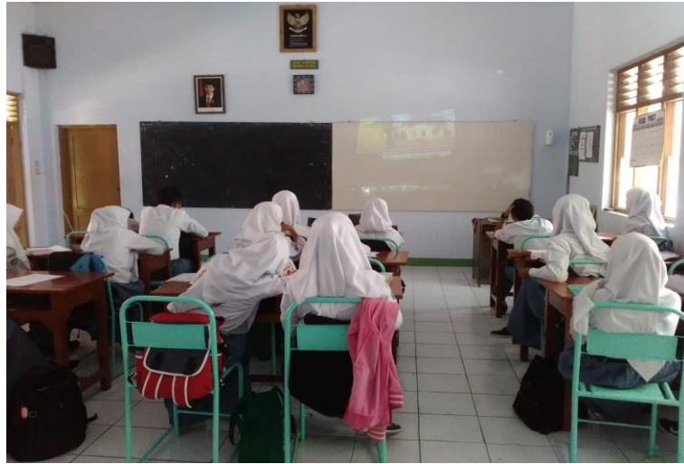
Gambar 3.KBM XI RPL