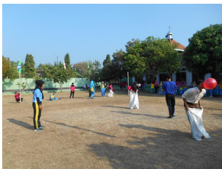
Gambar 8. Mendampingi Lomba Peringatan HUT RI 70