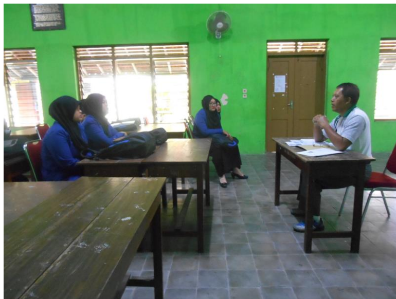
Gambar 6. Pengarahan dari Koordinator PPL di sekolah