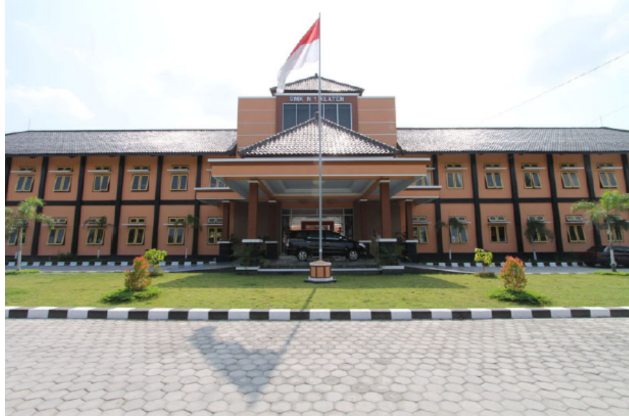
Gambar 3: Gedung SMK N 1 Klaten Unit 2 Tampak dari Depan