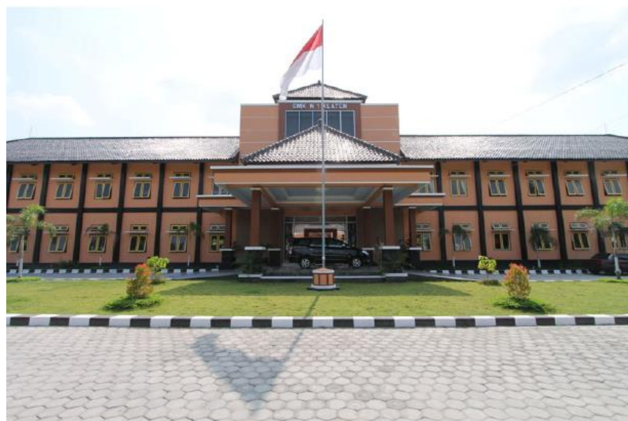
Gambar 3 Gedung SMK N 1 Klaten Unit 2 Tampak dari Depan