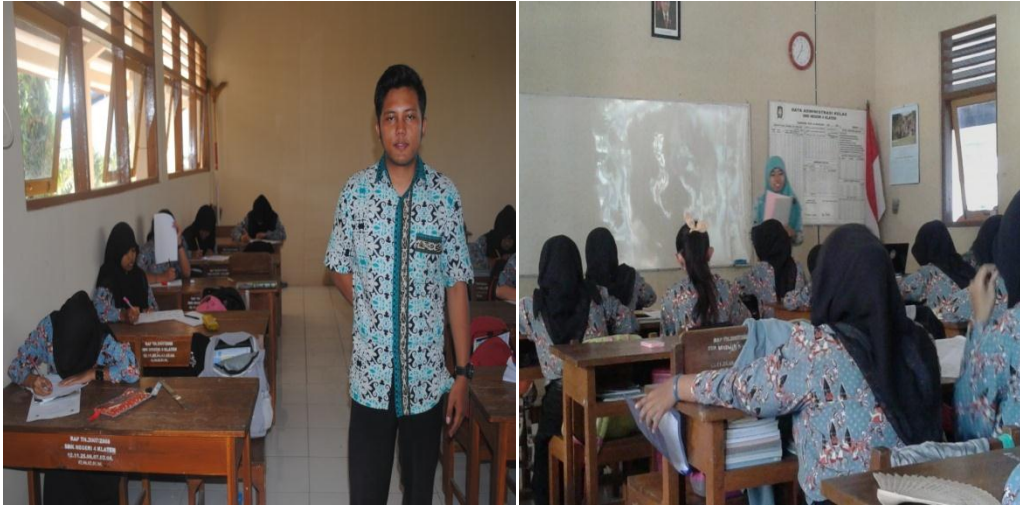
Mengajar di Kelas XI AP 3