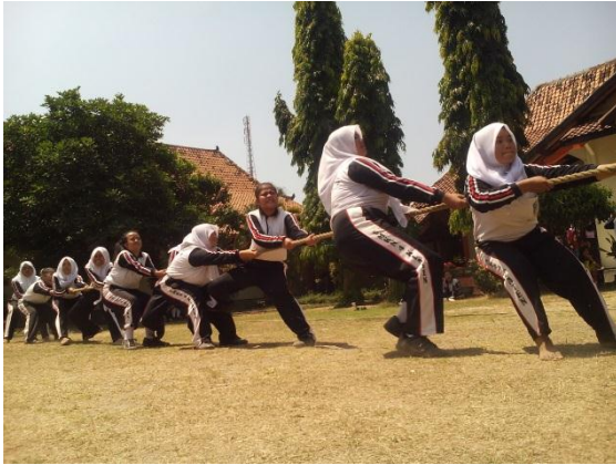
Lomba tarik tambang yang dilakukan Oleh siswi hari Senin, 24 Agustus 2015