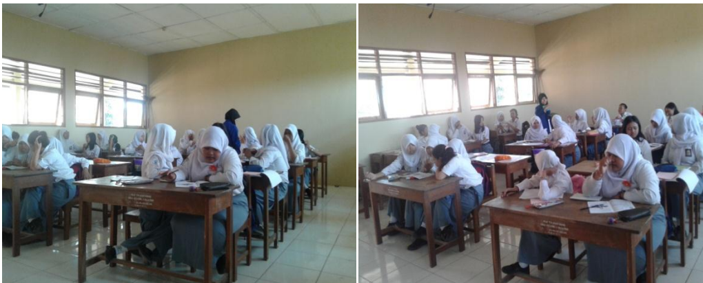
Mengajar di Kelas XI AP 2