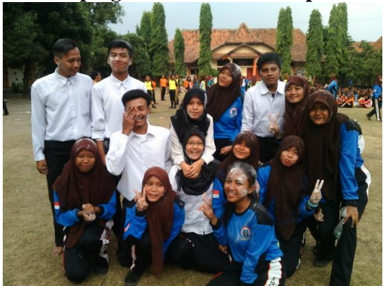
Pendampingan pelatihan pramuka. Kegiatan berupa lomba-lomba yang dilakukan antar kelas.