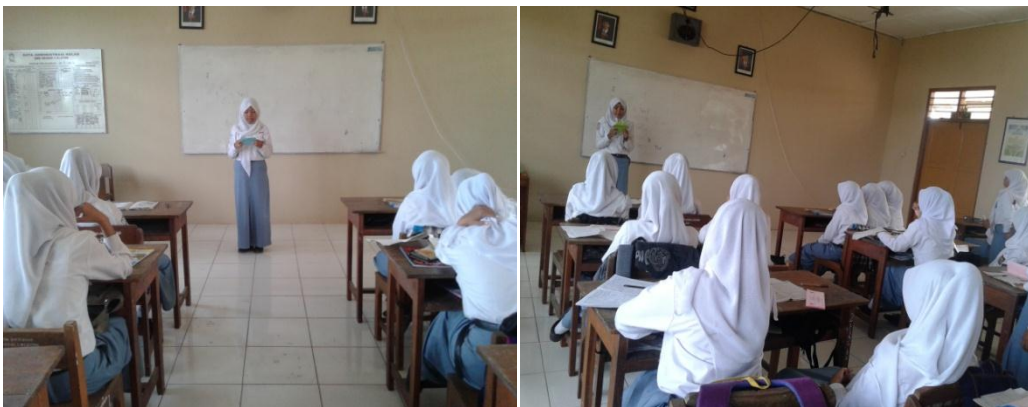
Mengajar di Kelas XI AP 1