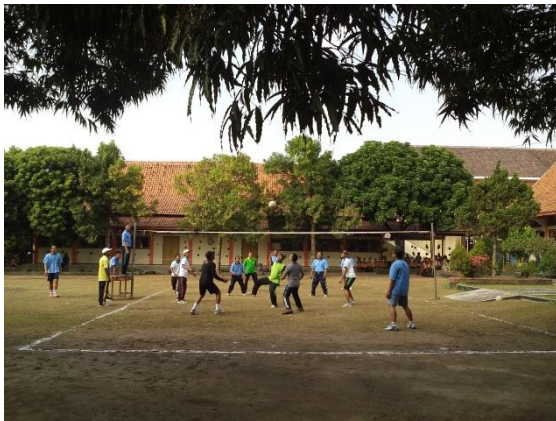
Lomba voli antar guru-guru. Hari jumat 14 Agustus 2015 pukul 09.00 WIB