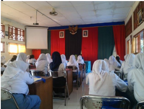
Kegiatan rapat OSIS yang dilakukan membahas tentang kegiatan lomba memperingati HUT RI ke 70