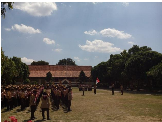
Upacara Hari Pramuka pada hari Jumat 14 Agustus 2015 pukul 07.00 WIB