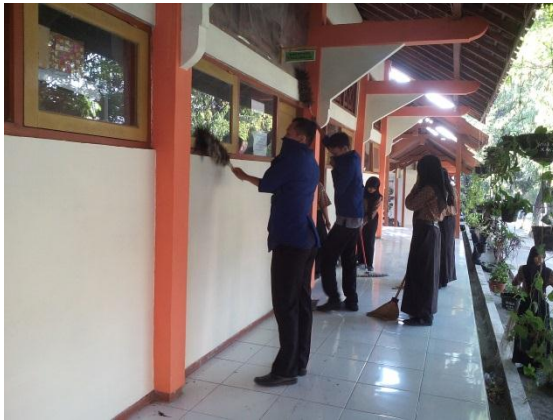
Kegiatan bersih-bersih sekolah dalam rangka penilaian kebersihan sekolah pada hari Rabu 19 Agustus 2015 pukul 08.00