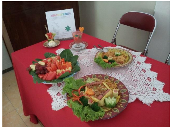
Salah satu hasil masakan nasi goreng lomba antar jurusan hari Jumat 14 Agustus 2015