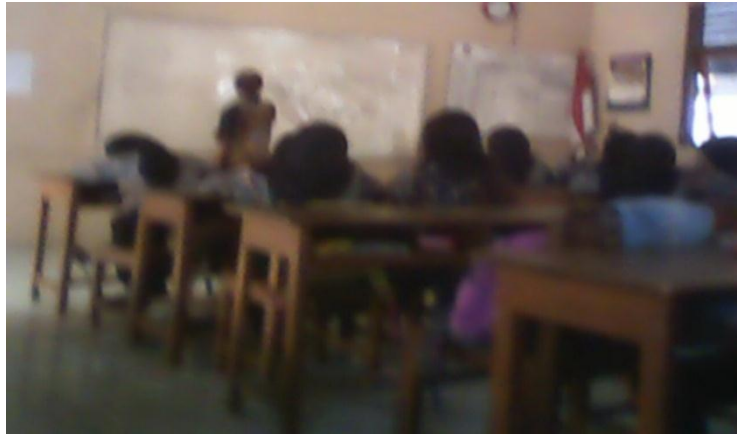
Observasi Kelas XI AP