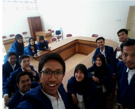
Kegiatan pengarahan kepala sekolah yang dilaksanakan hari Selasa 11 Agustus 2015 pukul 12.00 – 13.00 WIB