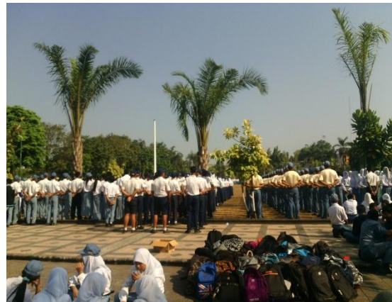
Kegiatan pendampingan pelatihan aubade di alun-alun Klaten hari Rabu, 12 Agustus 2015 pukul 16.30