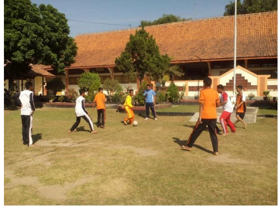
Lomba futsal yang dilakukan oleh siswa hari Senin, 24 Agustus 2015