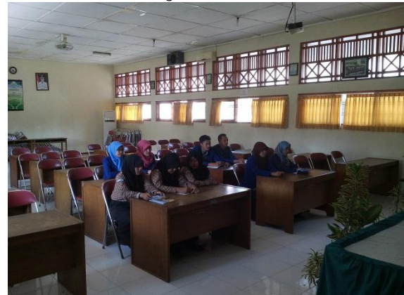
Rapat koordinasi membahas jalan sehat pada hari Rabu 19 September 2015 pukul 10.00 WIB