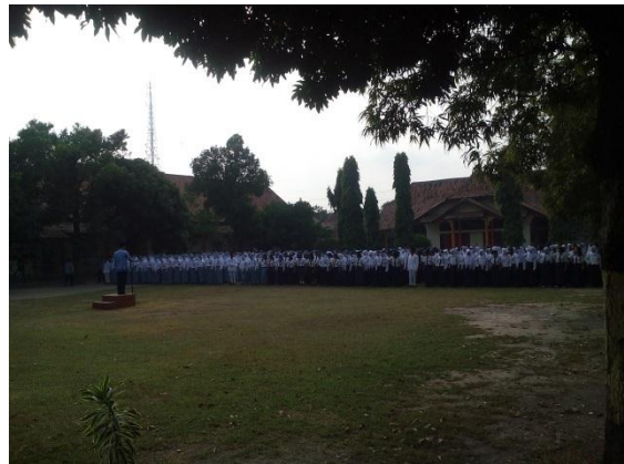
Upacara perayaan HUT RI ke 70 pada hari Senin 17 Agustus 2015 pukul 07.00